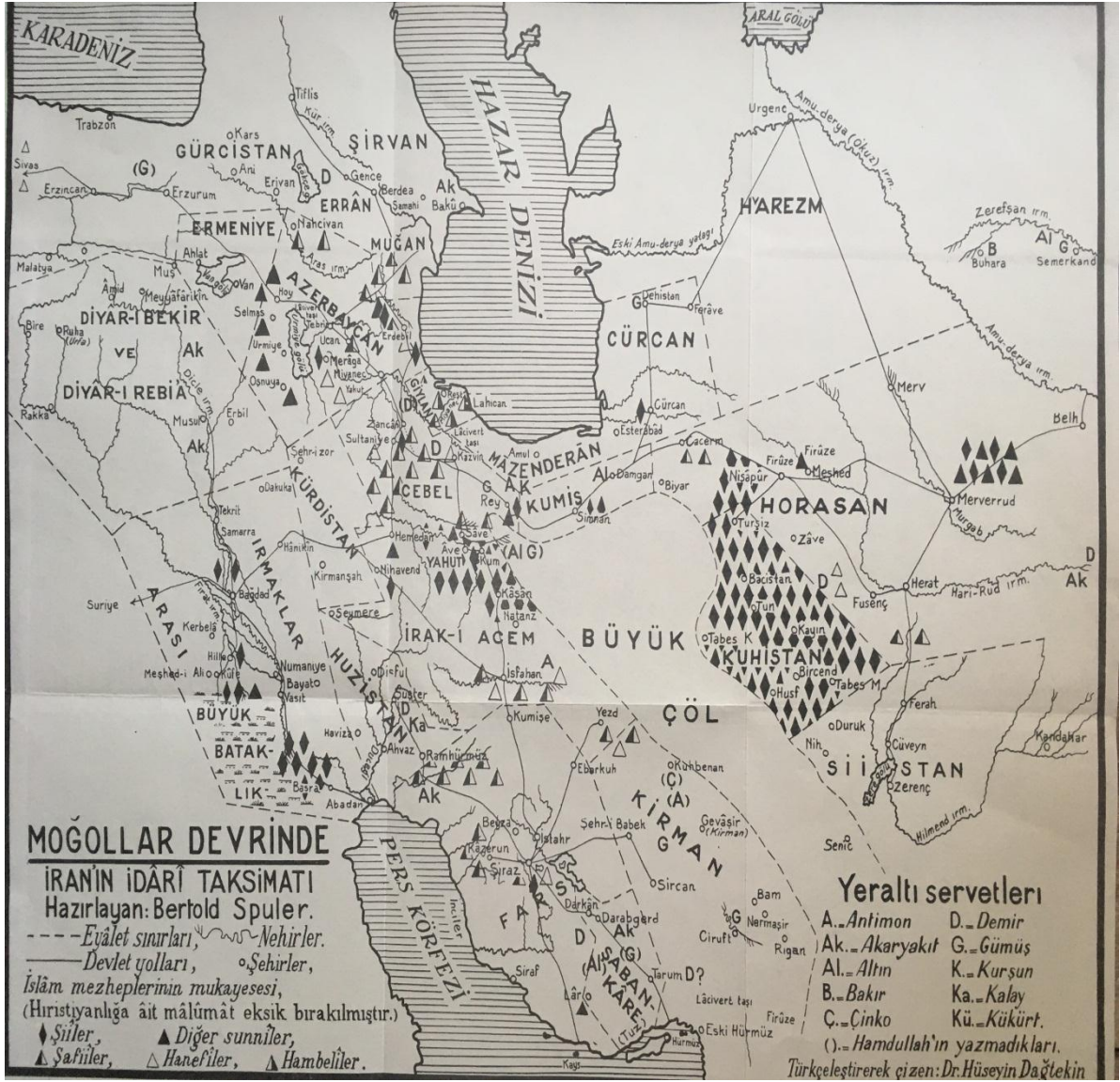
Bertold Spuler'in İran Moğolları adlı eserinden alındı