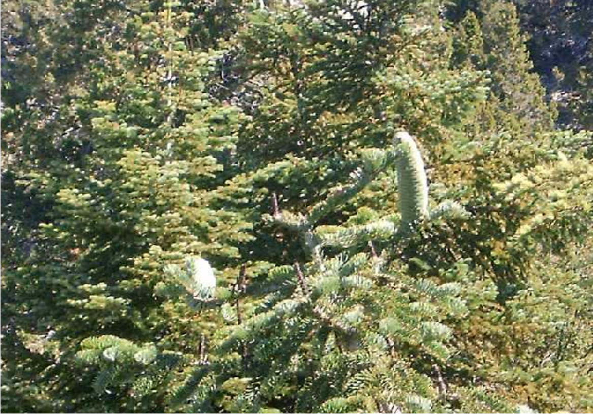
Resim 43: am Kozadı