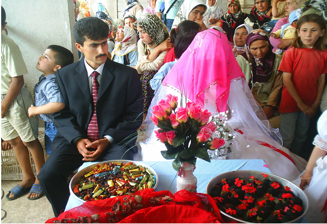
Resim 31: Kına Merasimi

Kına gecesi kızın anası ve kaynanası ayrı yakımlar yakarlar.Kız da bu yakımlara katılır.Kınaya katılan kadınlar da aynı konuda yakımlar yakarlar.