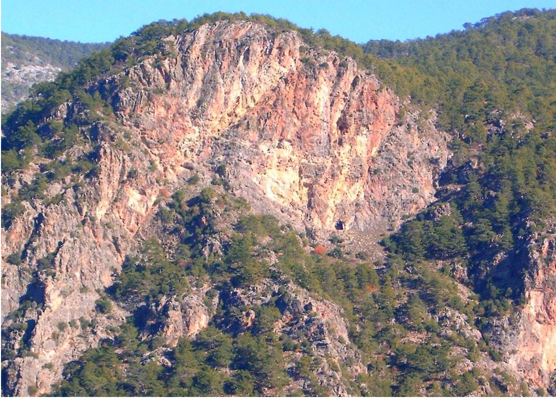
Resim 2 Toroslardan Grnm

Bozyazı da denizin hemen gerisindeki ovanın ardınca geit vermez Ŗekilde ykselen Toros dađları bulunmaktadır. Torosların yksekliti yer yer 2 000 metreyi bulmaktadır. Bu durum ilenin diđer illerle olan ulaŖımını bir hayli zorlaŖmaktadır 3 .