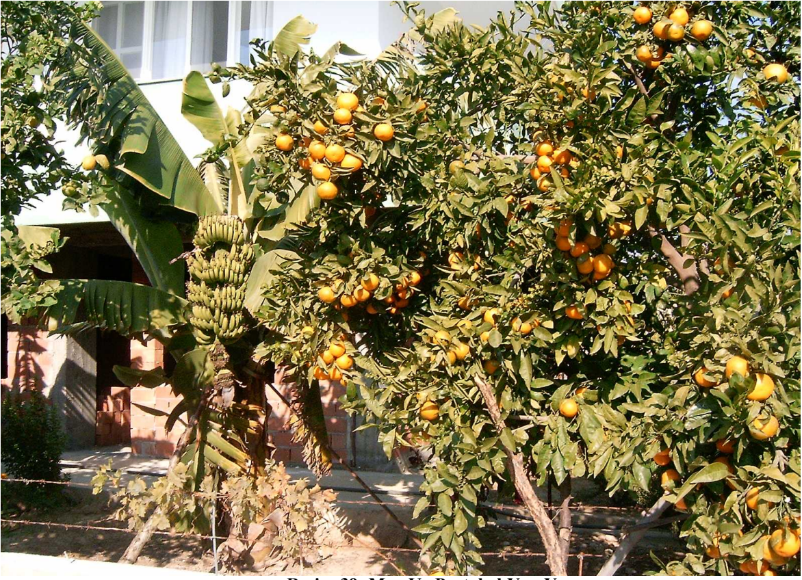
Resim 39: Muz Ve Portakal Yan Yana