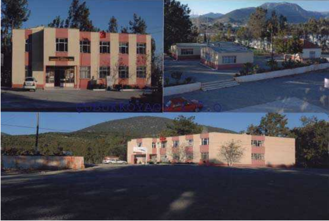
Resim 17 Okulumuzdan Görünüm

Okulun Tarihçesi: Okul 1961 yılında 3 derslikle eğitim-öğretime başlamış 1973 yılında 2 derslik ve 1 idare odadan oluşan ayrı bir bina daha eklenmiştir.