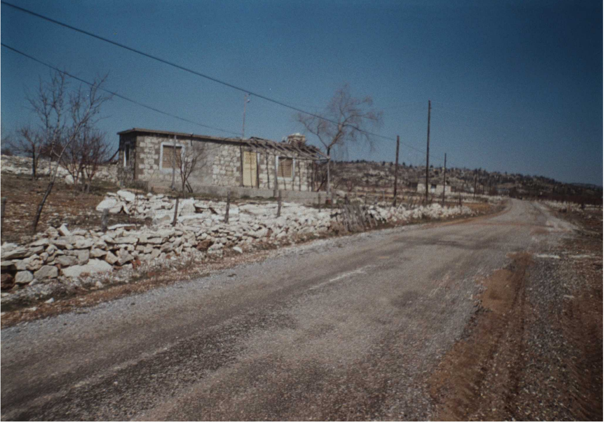
Resim 51: Toroslarda Yayla Evinden Kesit