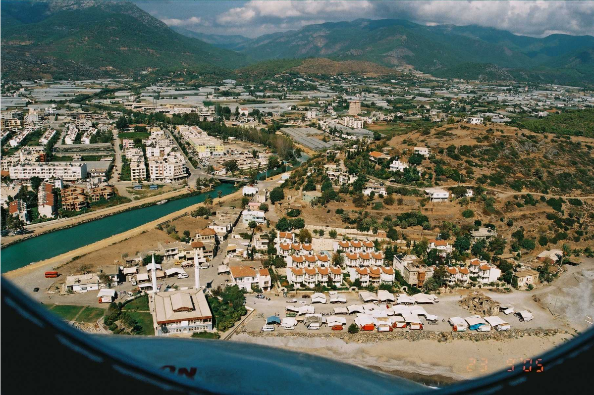
Resim 50: Kuş Bakışı Bozyazı