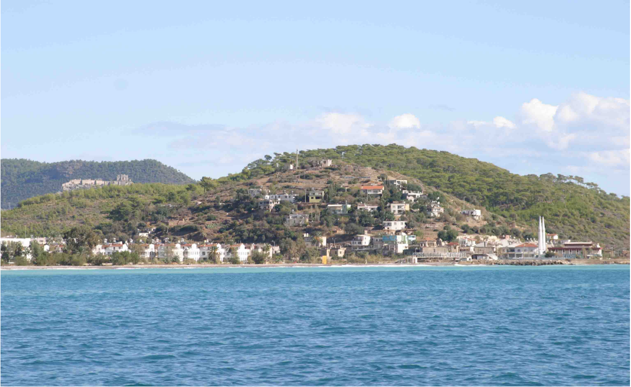
Resim 52: Paşa Beleni