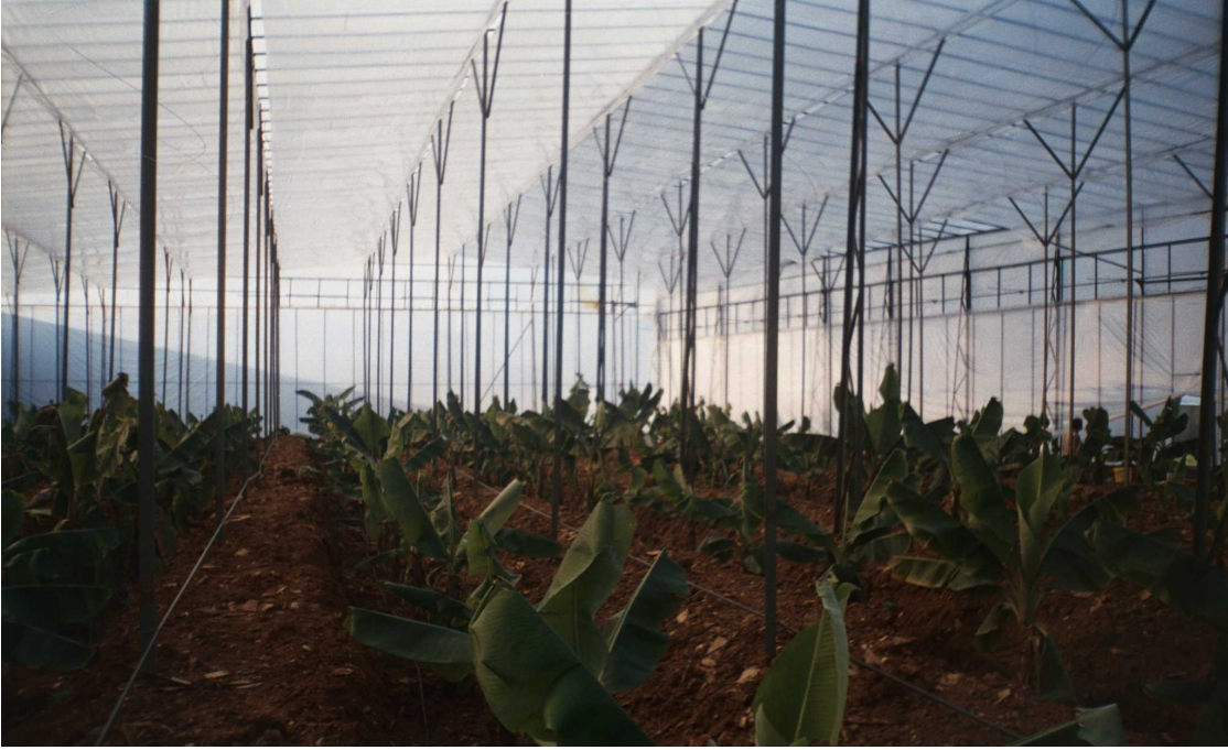
Resim 7 Muz Bahçesinden Görünüm

Bugün Bozyazı tarımının ve belki de Bozyazı ekonomisinin motor gücü muz üretimidir. 3.500 dekarı bulan bir alanda muz üretimi yapılmakta, bunun