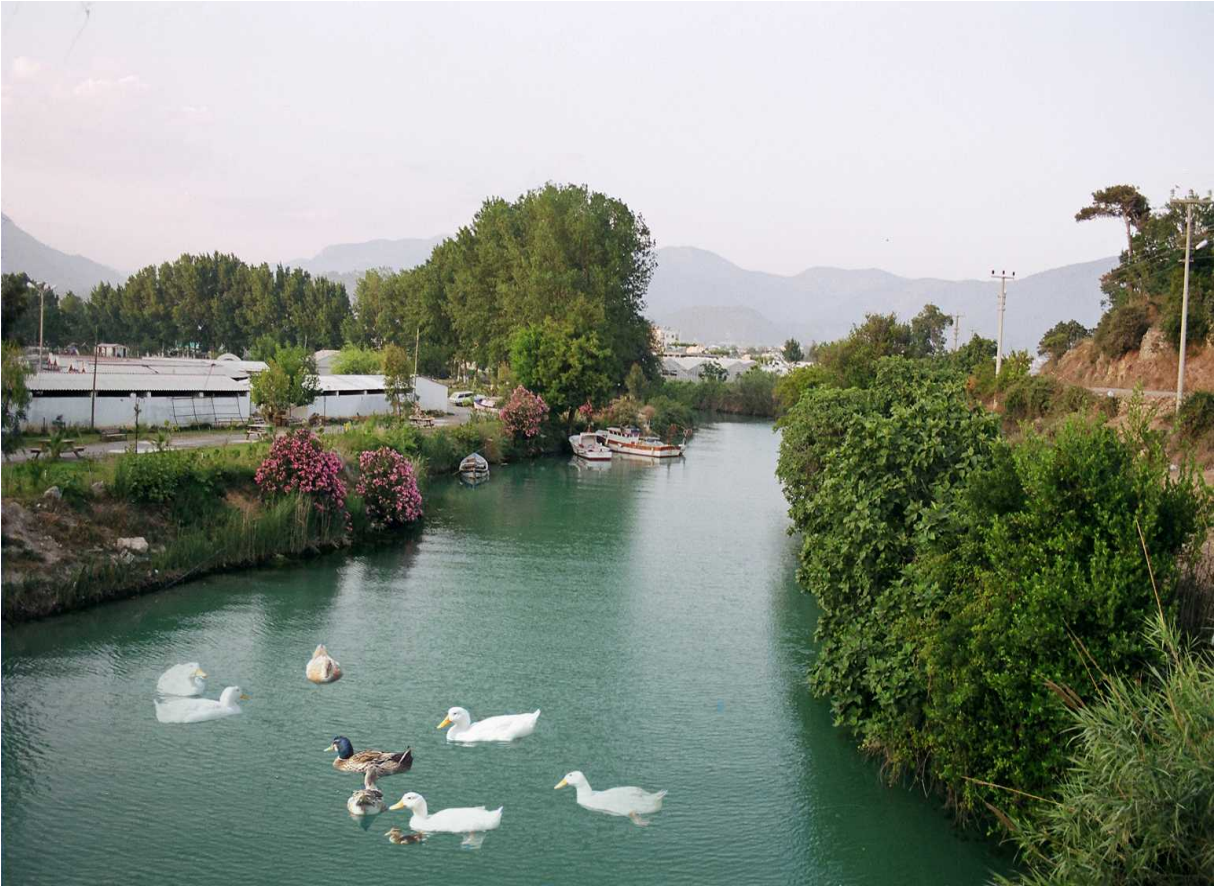
Resim 48: Sini Çayı Ve Ördekler