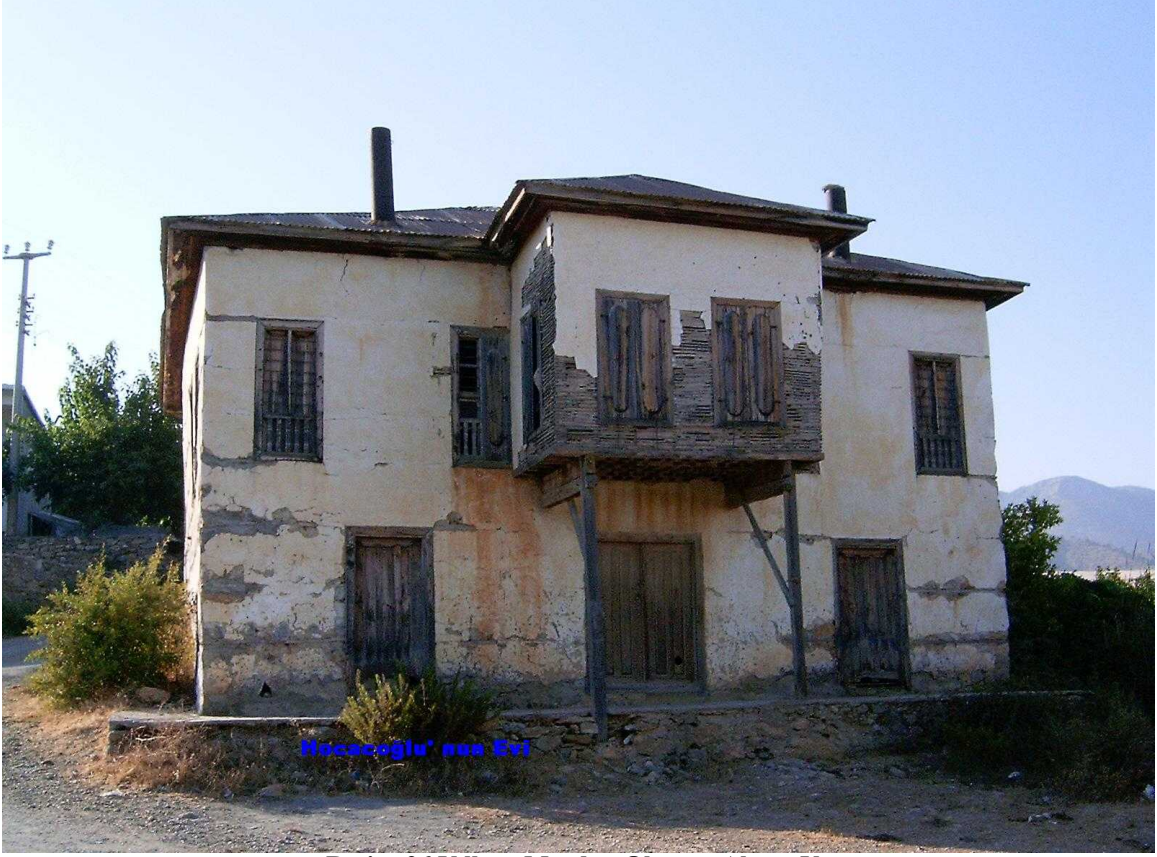
Resim 26 Yıllara Meydan Okuyan Ahşap Yapı

Buluntuların ağırlıklı olarak sikke(40adet)ve (ticari ürün taşınmasına yaygın olan) amphoralardır.