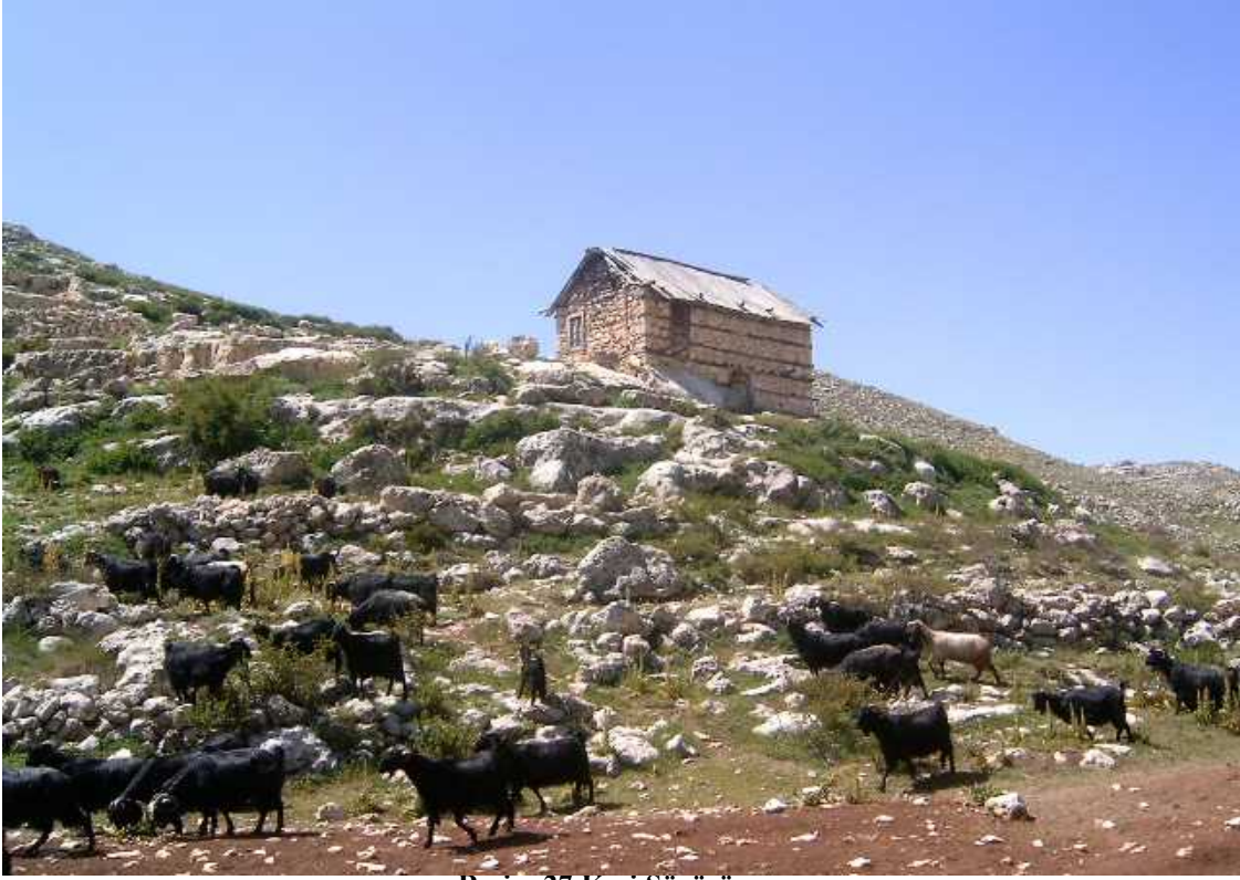
Resim 27 Keçi Sürüsü

Yörükler geçimlerini hayvancılıkla sağlarlar. Bu yüzden hayatlarında olan her şeye, her adette hayvanlarında rolü payı vardır. Kısacası hayatlarını onlara göre düzenlerler.