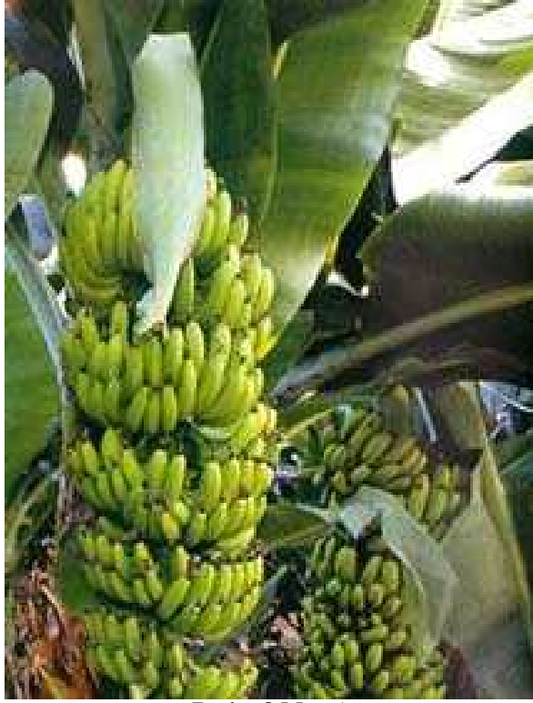
Resim 8 Muz Ağacı

Bozyazı’da son yıllarda çok artmıştır. Muzdan sonra başlıca tarım ürünleri serada ve açıkta turfanda sebze, çilek ile yer fıstığı ve narenciyedir. Bozyazı kendi verimli ovasından ve özel ikliminden faydalanmayı sebze alanında bilmiş ve seralardaki sebze üretimi vasıtasıyla turfanda sebze üretiminin Türkiye’deki önemli merkezlerinden biri olmuştur. 22