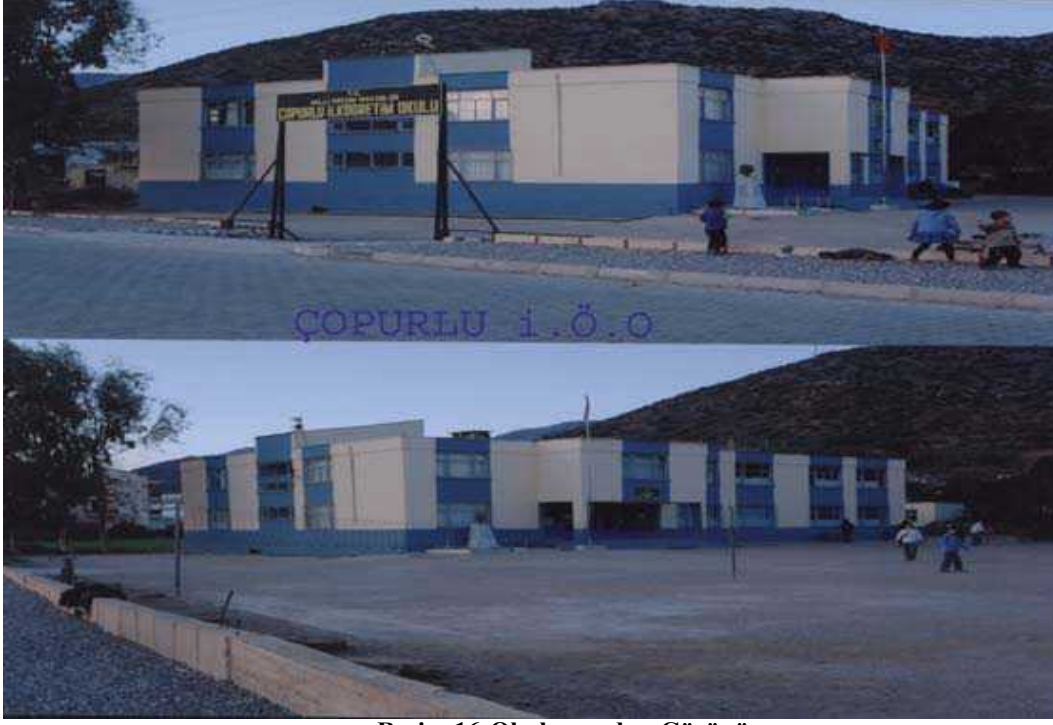
Resim 16 Okulumuzdan Görünüm