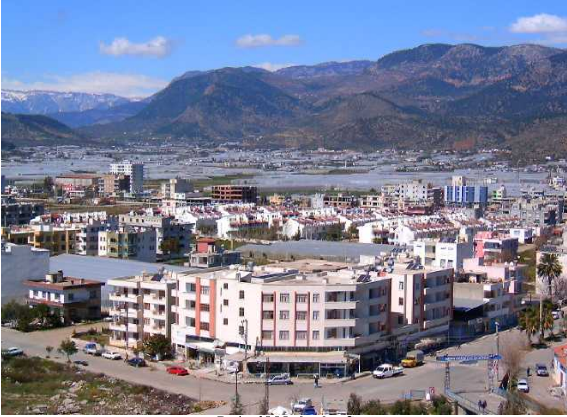
Resim 35:Merkezden Görünüm