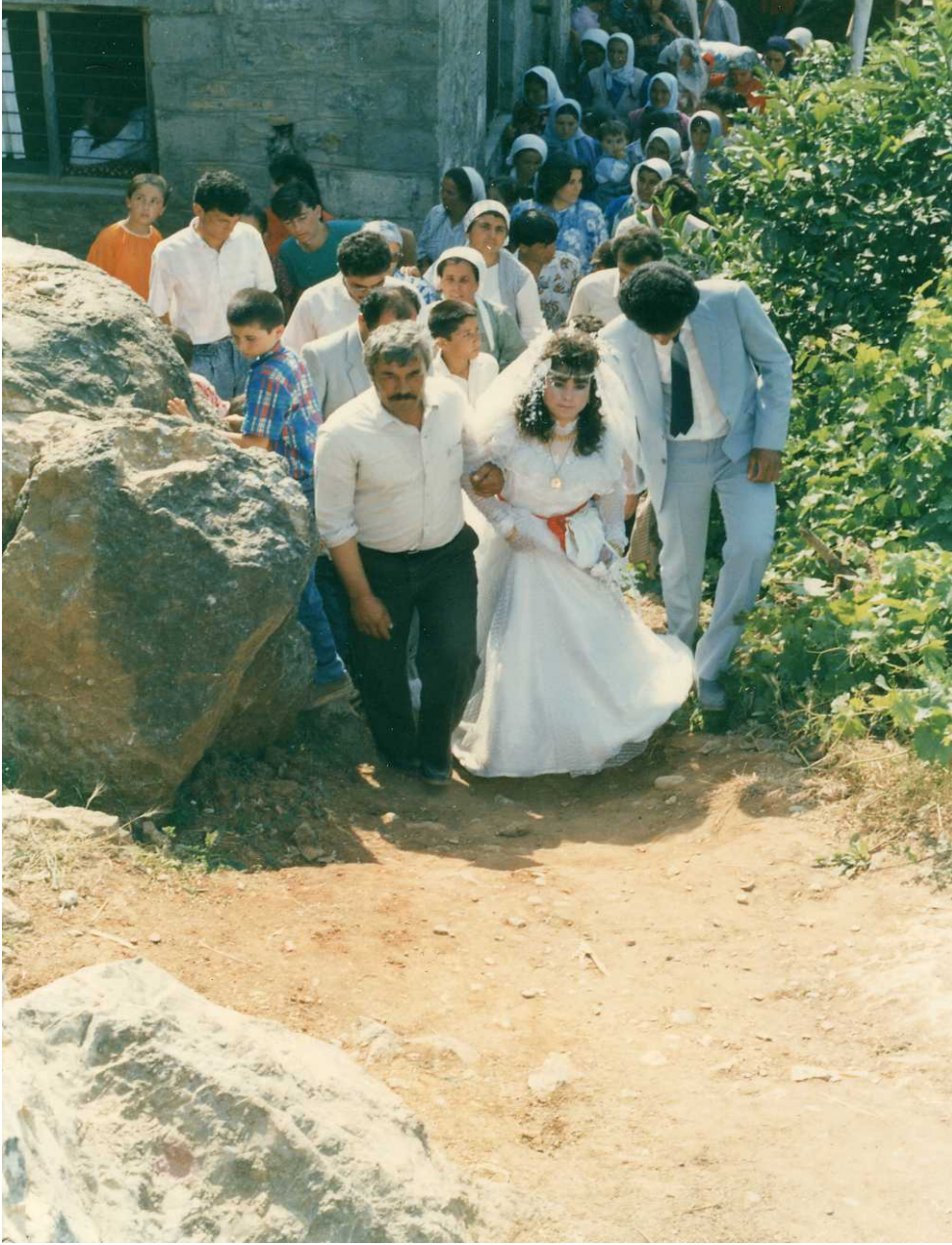
Resim 30: Gelin Evden Çıkarken

Bunlar yemeklik ürünler olabileceği gibi giyim eşyası ve kesim için et hayvanı da olabilir. Kız evine ise çeyizi tamamlayan hediyeler gelir. Pazartesi ve Salı eğlence devam eder. Güreşler, atışlar, yemeler, içmeler günüdür. Çarşamba “KESENE” günüdür. Eğlence yine devam eder. Kız evine gidecek yiyecek ve sergi eşyaları götürülür. Akşama doğru bir iki kilo kına ile çalgı eşliğinde meşalelerle yine kız evine gidilir. Kıza kına yakılır. Aynı gece buradan dönülür ve erkeğe de kına yakılır 46 .