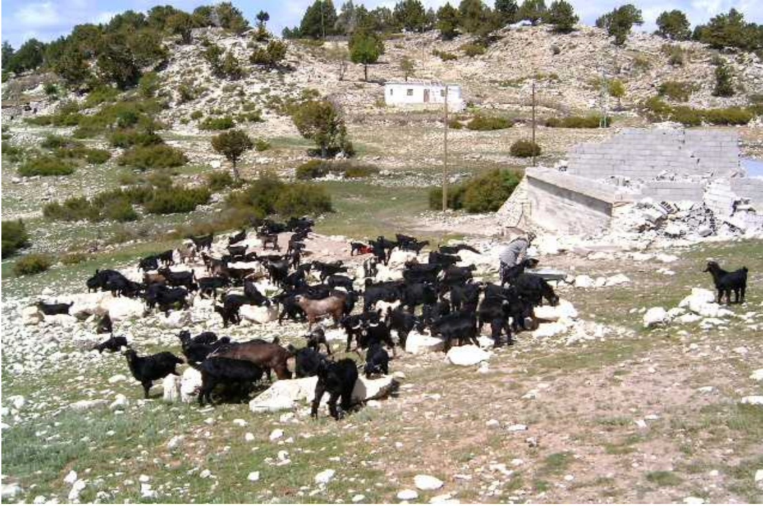
Resim 11 Kıl Keçileri

Her yıl 200 dekar yeni sera yapılmaktadır. Bunlardan demir ticareti yapan kuruluşlar ve gündelikçi yevmiyeciler, sera yapım ustaları da geçimini sağlamakta. Böylece Örtü altı muz yetiştiriciliğinden Bölge halkının % 90 ı geçimini sağlamakta ve bölge için önemli bir değer taşımaktadır.