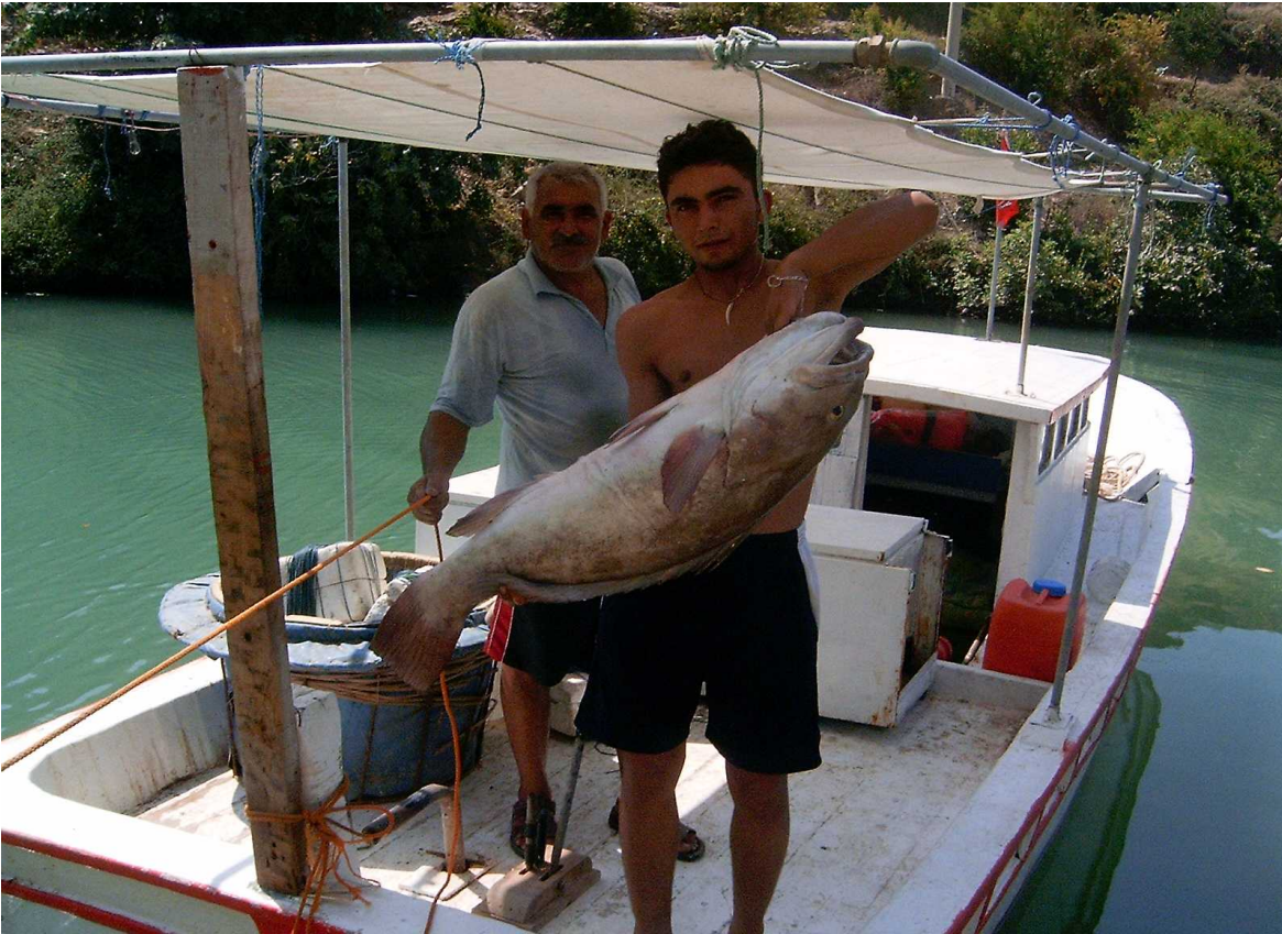
Resim 46: Balıkçılar