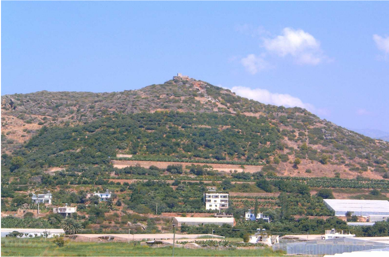
Resim 42: Muz Bahçeleri