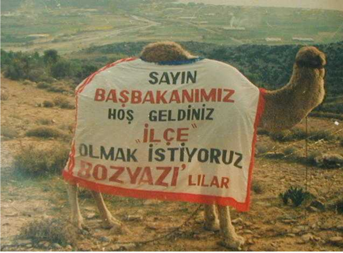
Resim 49: 1985 Yılında Turgut Özal'a İlçe Olmak İsteği Sırasında Vaat Edilen Kurban