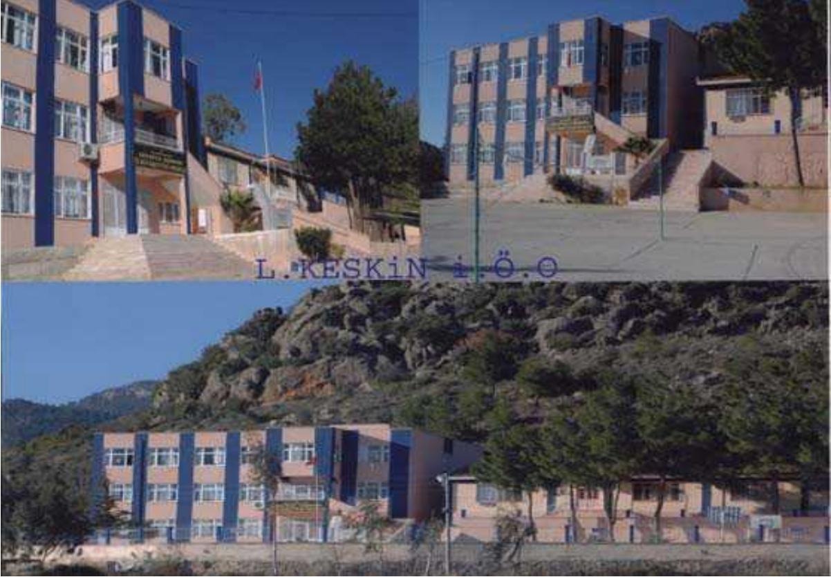
Resim 21 Okulumuzdan Görünüm

Okulun Tarihçesi: Okul 1967–1968 Öğretim yılında 5 derslikli prefabrik bina ile öğretime başlamıştır. 1981 yılında bu binanın tamamen yanması sunucunda halk ve devlet katkısı ile yeniden iki bina olarak 6 derslik yapılmıştır. 2002 yılında yeniden ayrı 3. binanın yapımı 3 katlı 10