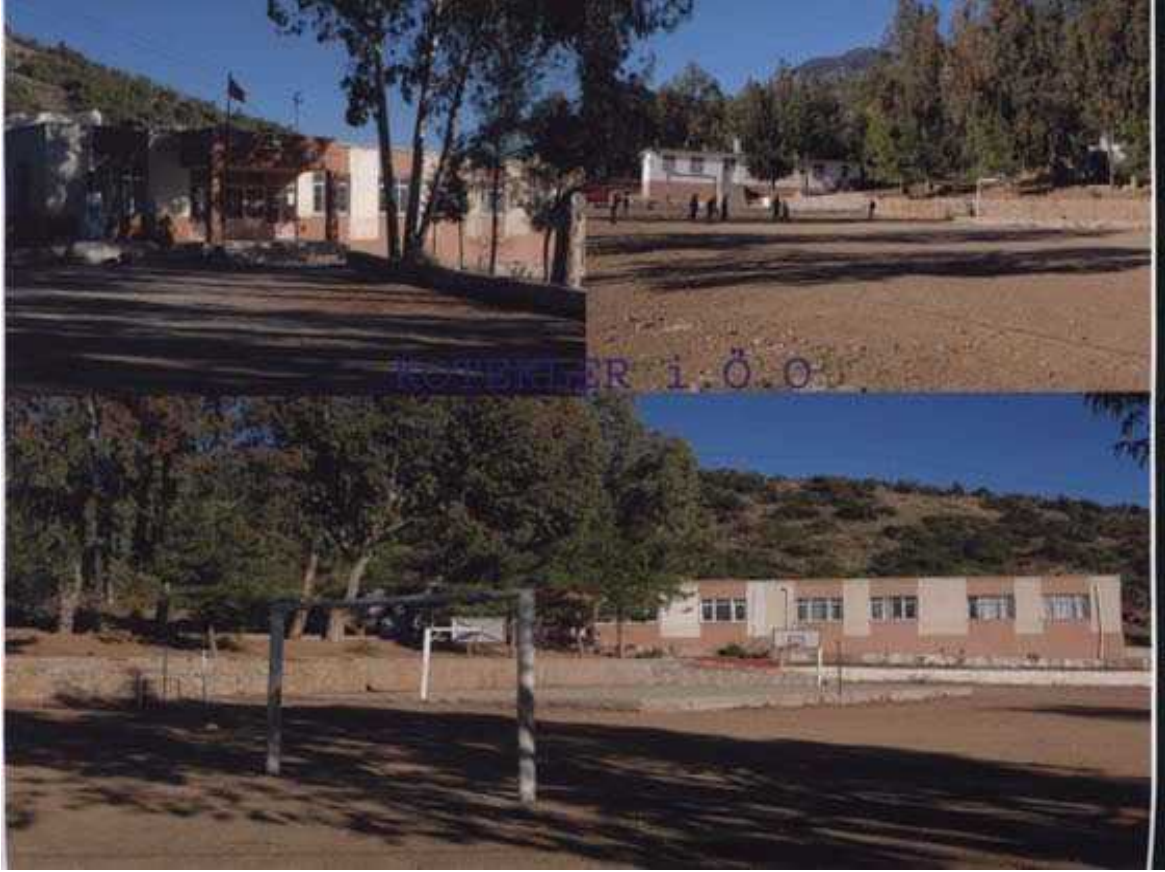
Resim 20 Okulumuzdan Görünüm

1984–1985 öğretim yılında 1 derslik, 1991–1992 Öğretim yılında ek 2 derslik yapılmıştır. 1993–1994 öğretim yılında da 5 derslikli yeni bir bina yapılmıştır. 1996–1997 öğretim yılında da ilköğretim okulu olmuştur. Okulumuz halen 1 anasınıfı, 1 bilgisayar sınıfı ve toplam 9 sınıfı ile eğitim öğretime devam etmektedir.