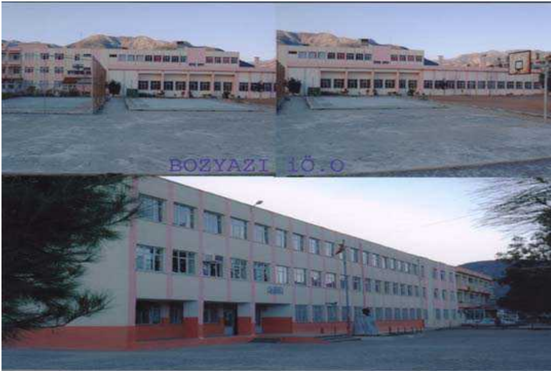
Resim 15 Okulumuzdan Görünüm

Okulun Tarihçesi: Okul 1982–1983 Eğitim-Öğretim yılında hizmete açılmıştır. 2000 yılına kadar ikili öğretim yapan okul 2000–2001 öğretim yılı dâhil olmak üzere Öğretmenevi ile birlikte yapılan 12 derslikle normal öğretime geçmiştir. İlçemizde eğitim-öğretim, sosyal ve kültürel alanlarda diğer okullara öncülük yapan okulun bilgi kültür yarışmalarında birçok ilçe birinciliklerinin yanı sıra 1993–1994 eğitim-öğretim yılında il üçüncülüğü, 1996–1997 öğretim yılında il dördüncülüğü, 2002–2003 eğitim öğretim yılı il birinciliği, 2003–2004 öğretim yılı il üçüncülüğü vardır.