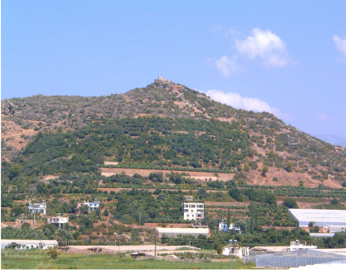
Resim 25 Susanlık Kalesi