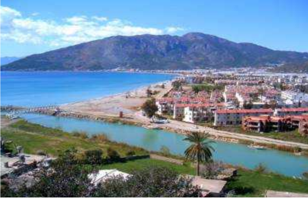
Resim 1 Bozyazı İlçesinden Görünüm

Bozyazı ilçesi adını sulu tarım yapılmadan önceki zamanda fiziki görüntüsünden almaktadır. İlk yerleşim yeri olan Gürlevik yöresinin güneyinde uzanan verimsiz boz renkli toprakların halk tarafından “Çorak Düzlük” manasına “Bozalan, Bozova, Bozyazı “ denmesinden almıştır. 1