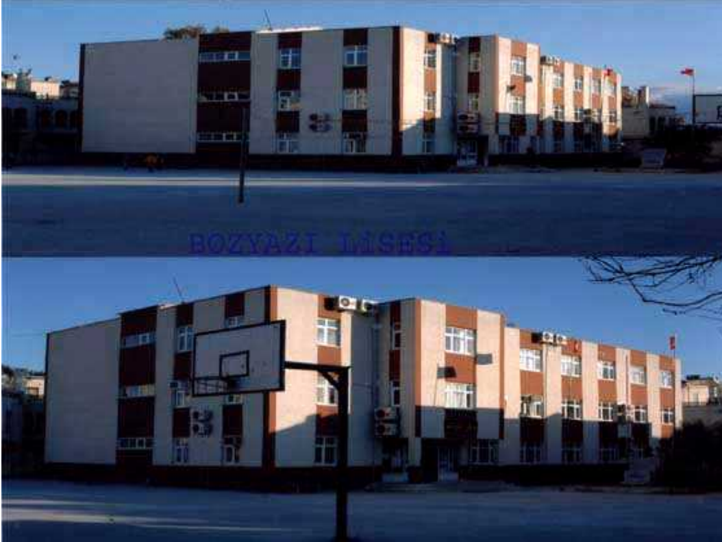
Resim 23 Okulumuzdan Görünüm