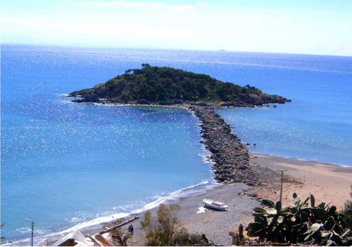
Resim 45: Bozyazı Adası