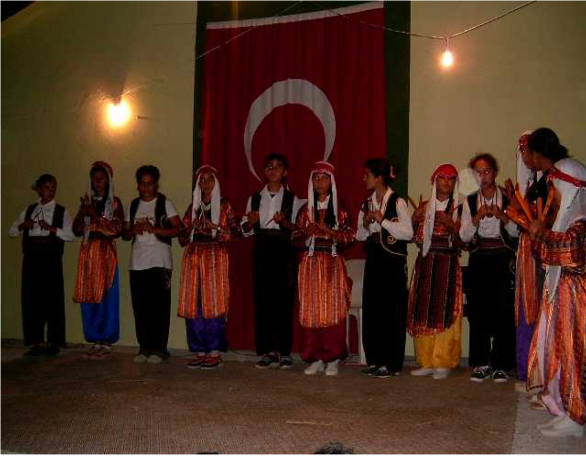
Resim 29: Kına Gecesinden Bir An