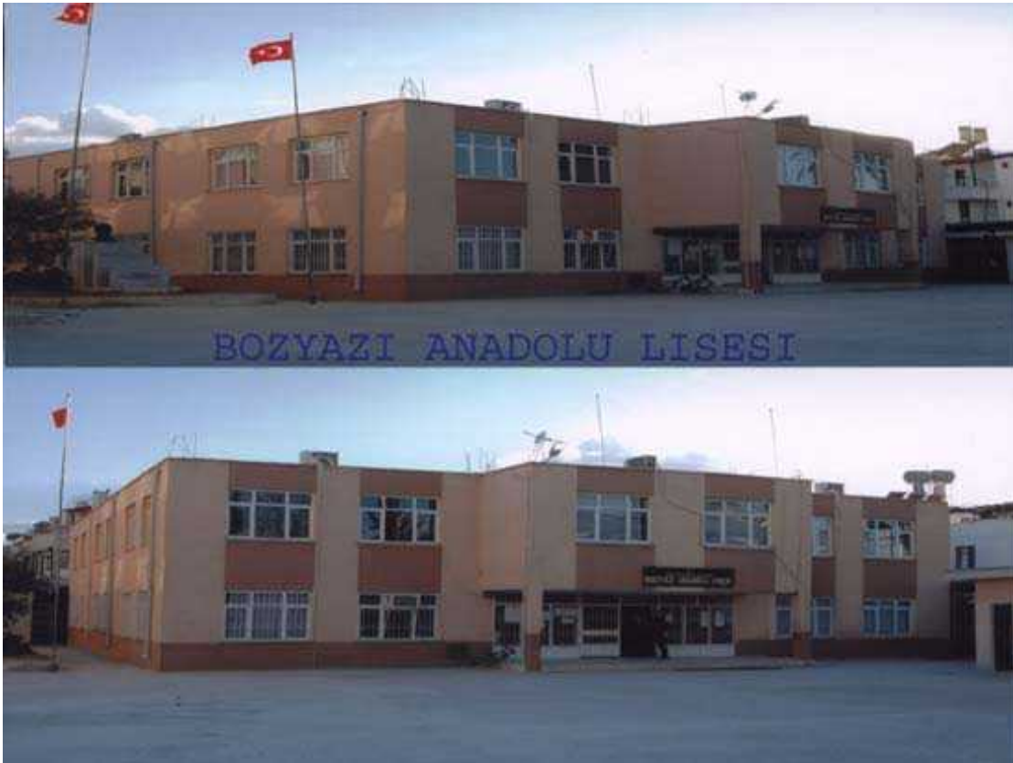
Resim 22 Okulumuzdan Görünüm

Okulun Tarihçesi: Bozyazı Anadolu Lisesi 20.08.1996 yılında Bozyazı Lisesi bünyesinde açılmış olup, Bozyazı lisesinin ikinci katında eğitim-öğretime başlamıştır. Halen Bozyazı Lisesi'ne ait binada eğitim-öğretimini devam ettirmektedir. 34