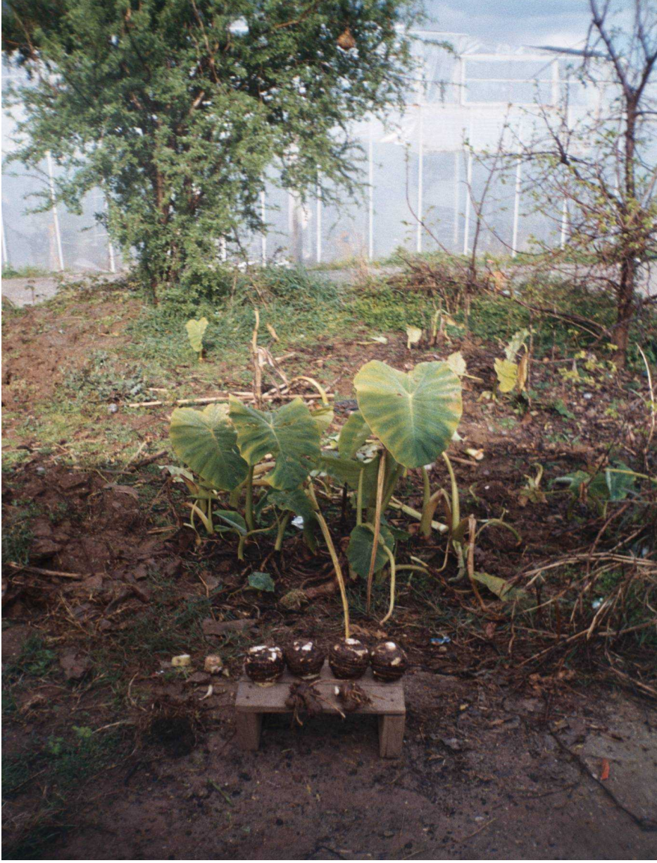
Resim 32: Gölevez Bitkisi

Gölevez önce soyulmadan iyice yıkanır. Soyulduktan sonra gölevezler güzelce bir bez veya peçete ile silinir. Silinen gölevezler bıçak yarıya kadar keser şekilde yana kıvrılarak kırılacak şekilde doğranır. Doğranan gölevezler tencerede ısıtılmış yağda