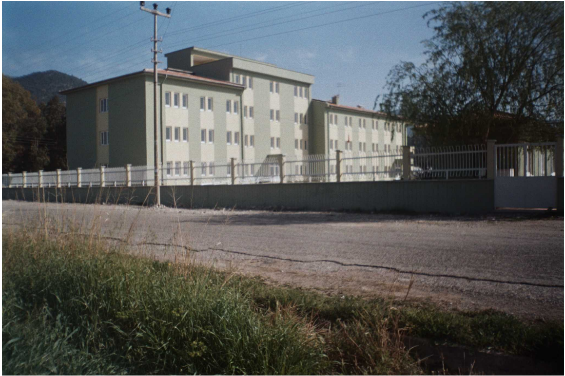
13 Devlet Hastanesi

1998 Yılında 197. Milyar lira keşif bedeli ile ihalesi yapılan 30 yataklı Bozyazı Devlet Hastanesi İnşaatı devam etmektedir.