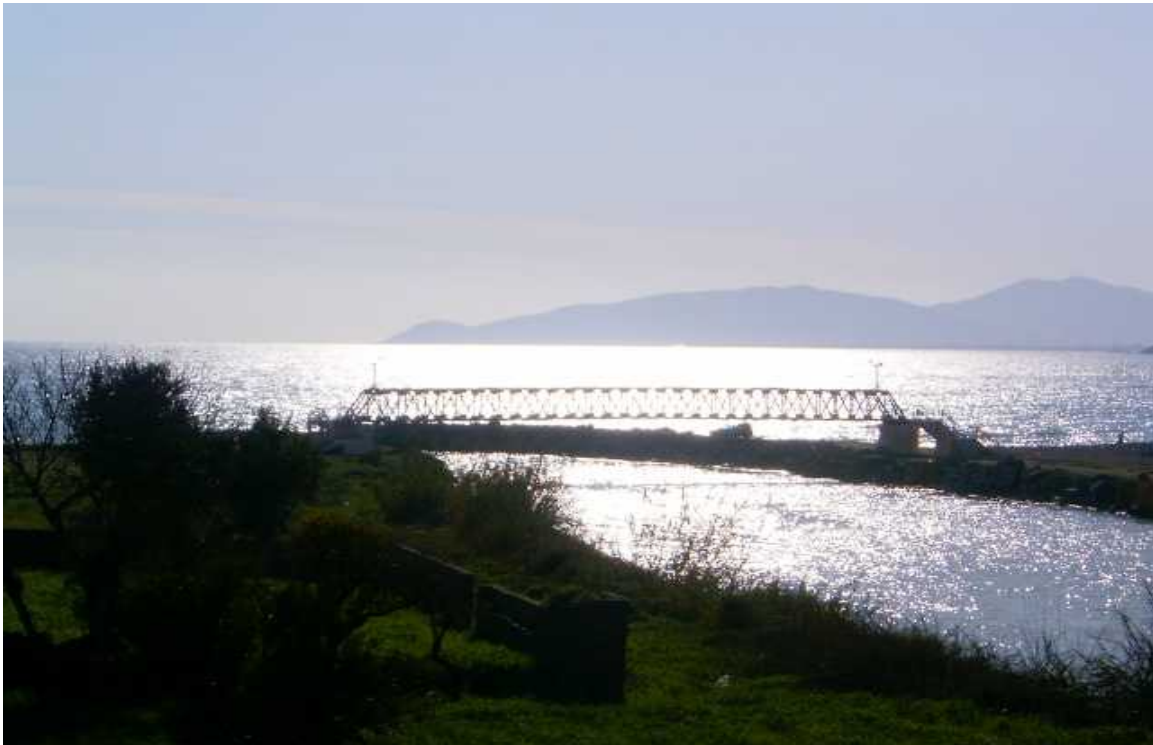
Resim 34: Sini Çayının Denizle Buluşması