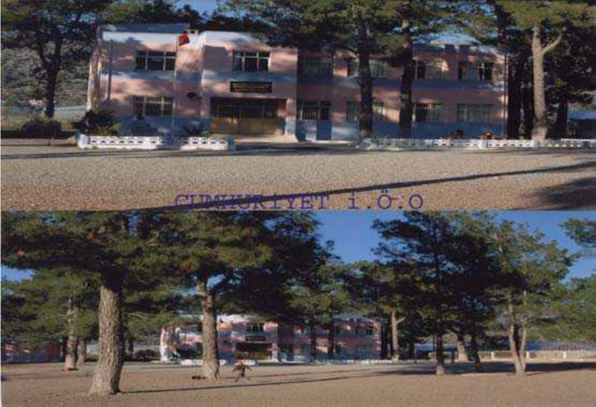
Resim 18 Okulumuzdan Görünüm

Okulun Tarihçesi: Okul 1974 yılında o günkü adıyla Çubukkoyağı köyünde Kırarası ilkokulu adıyla 4 derslikli binasında eğitim öğretime başlamıştır. Daha sonra Cumhuriyetin kuruluşunun 75. yılı nedeniyle adı Cumhuriyet İlköğretim okulu olarak değiştirilmiştir. Zorunlu ilköğretimin 8 yıla çıkarılmasından hemen