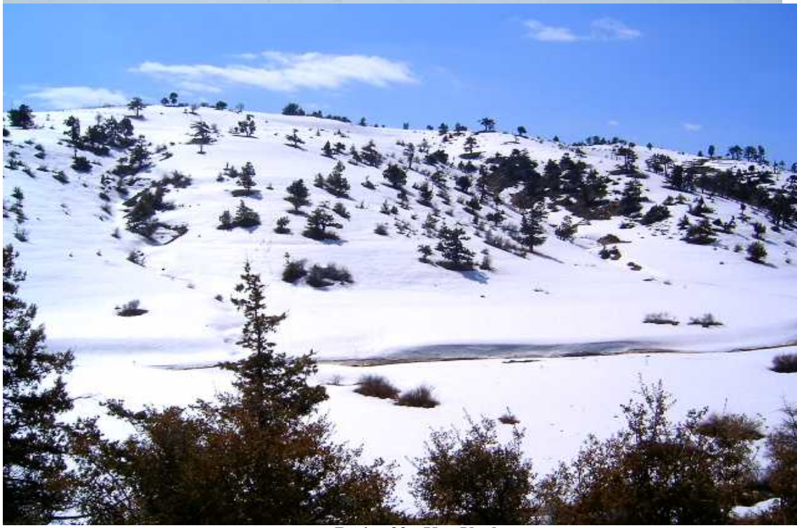
Resim 33: Kaş Yaylası