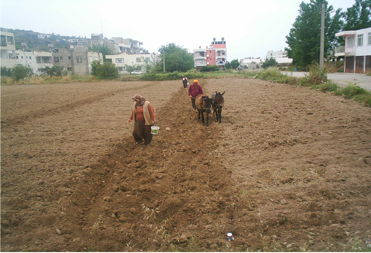
Resim 47: Tarladaki Çiftçiler