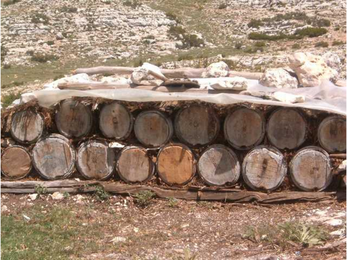
Resim 12 Arı kovanlarından görünüm