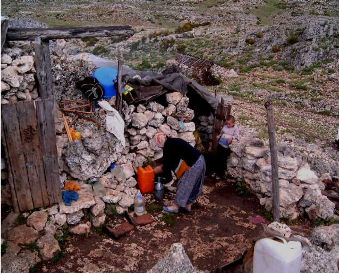
Resim 4 İlçede Dağınık Bir Nüfus Mevcuttur