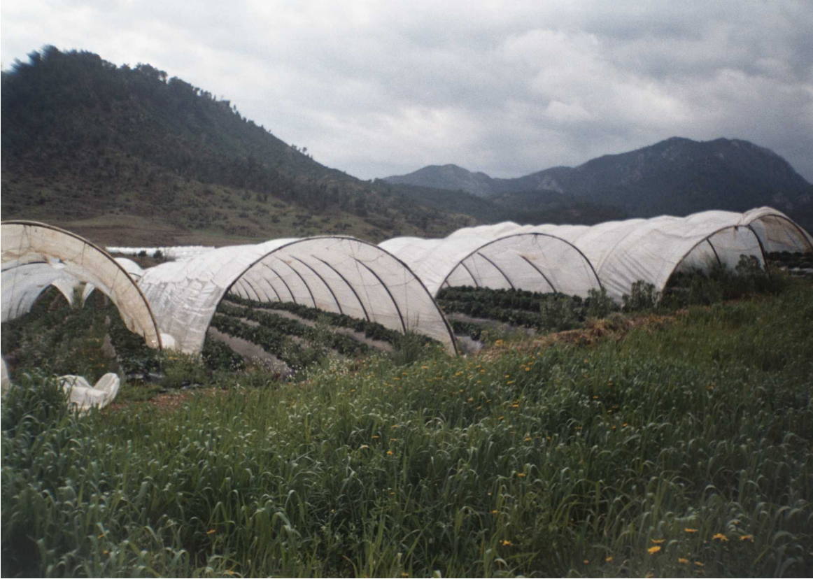
Resim 38: Çilek Bahçesi