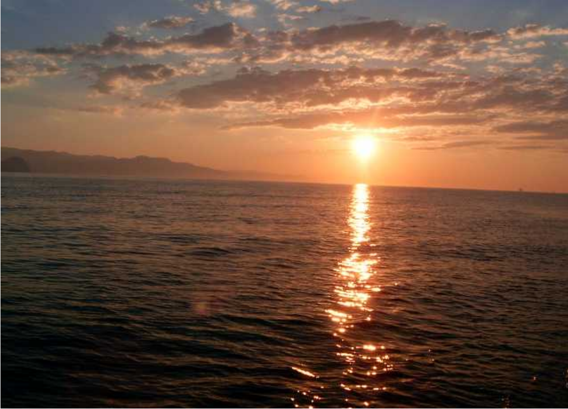
Resim 36: Bozyazı'da Gün Batımı