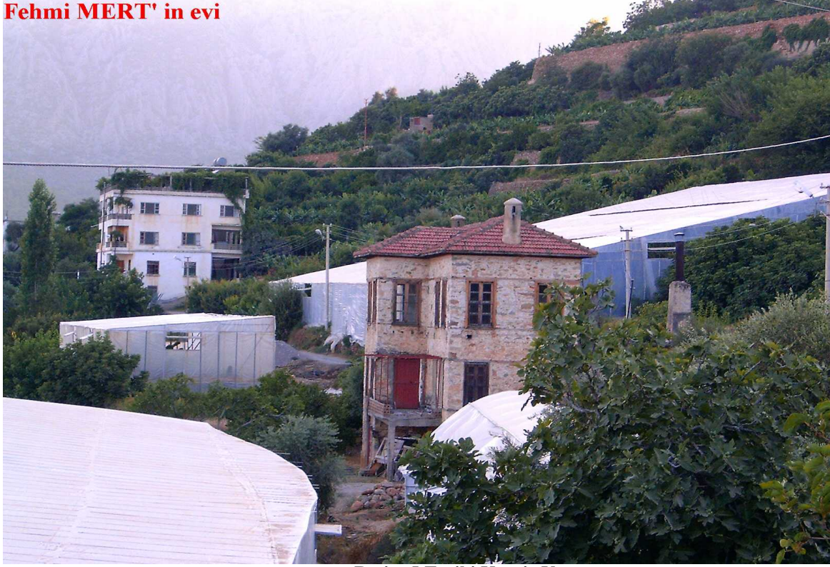
Resim 5 Tarihi Kerpiç Yapı

Bölgeye Türkler'in kesin olarak ele geçirmesi ve yerleşmesi Selçuklu Hükümdarı 1. Alaaddin Keykubat zamanında, 1228 tarihinde olmuştur. Bölgede ilk Türk yerleşimleri Yuvalı boyuna mensup Türkler tarafından Tekeli, Derebaşı, Gürlevik ve Akcamii yörelerinde kurulmuştur. Daha sonra bölge Karamanoğulları'na 1487 yılından itibaren Osmanlı topraklarına katılmıştır. 8 Bugünkü Bozyazı ilçesi, Beyreli ve Gürlevik Köyleri'nin birleşmesiyle Haziran 1966 tarihinden Belediyelik, 28 Eylül 1988 tarihinde de ilçe olmuştur.