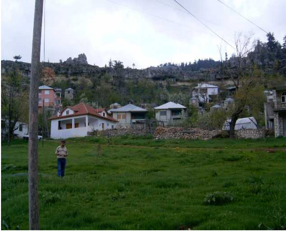
Resim 3 ( Kozağacı Yaylasından Görünüm )

Bozyazı yaşanan Akdeniz iklimi ilçede yaylacılığın yaygınlaşmasını sağlamıştır. 4