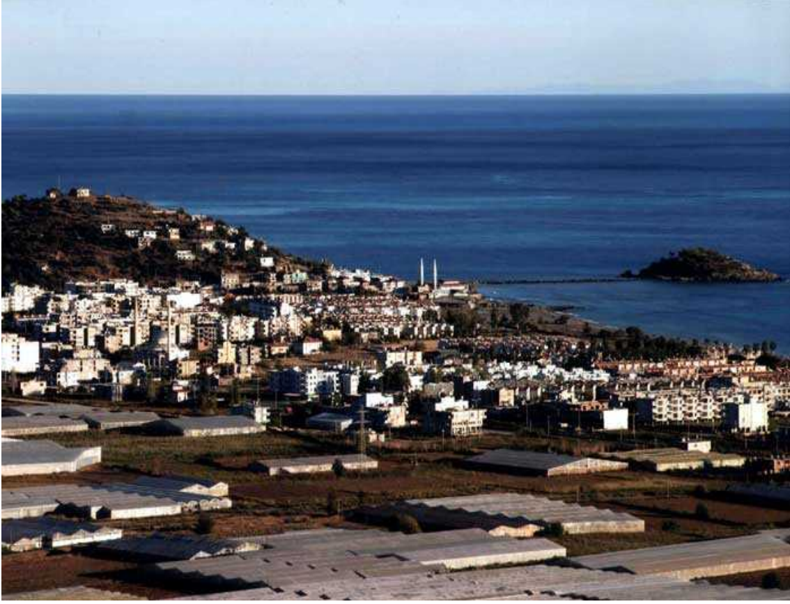
Resim 6 İlçe merkezinden görünüm