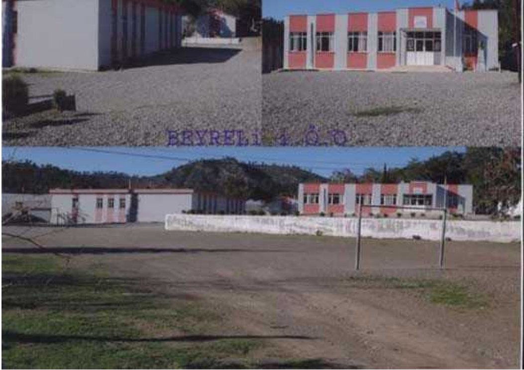
Resim 14 Okulun Genel Bir Görünümü

Okulun Tarihçesi: Okul 1951 yılında Belediye arazisine ait yerde mahallenin desteği ile açılmıştır. Bozyazı'daki açılan okullardan biridir. Kötekler, Narince, Akcami, Denizciler, Gürlevik mahallesinin öğrencileri de bu okula devam etmişlerdir. Öğrenciler çok kalabalık olduğundan sabahçı ve öğleci uygulaması ve her sınıfta en az üç şubesi bulunmuştur.