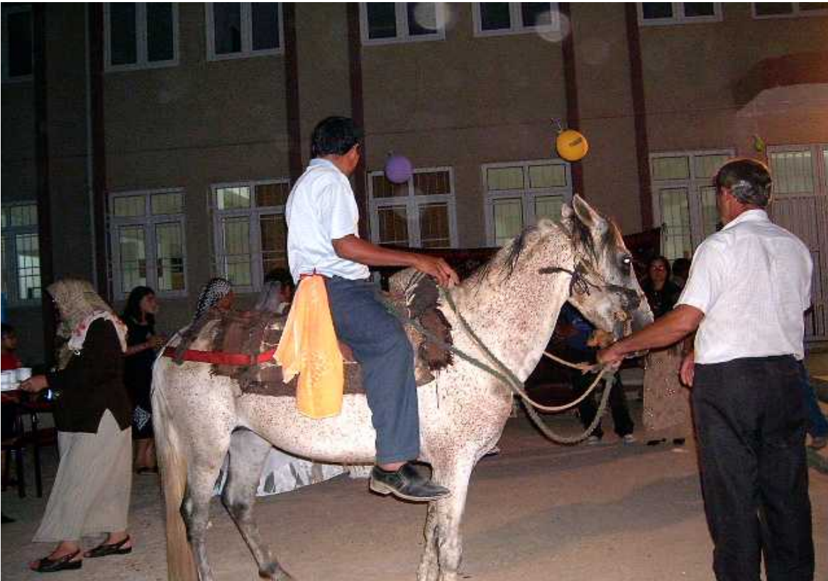
Resim 44: Ath Gelin Ahcılar