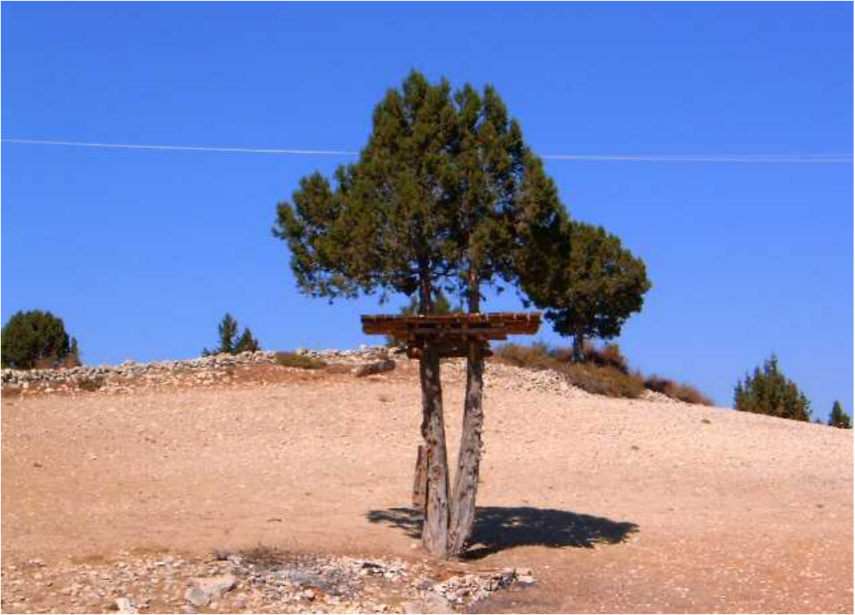
Resim 40: Ardıç Ağacı Ve Kovanlık