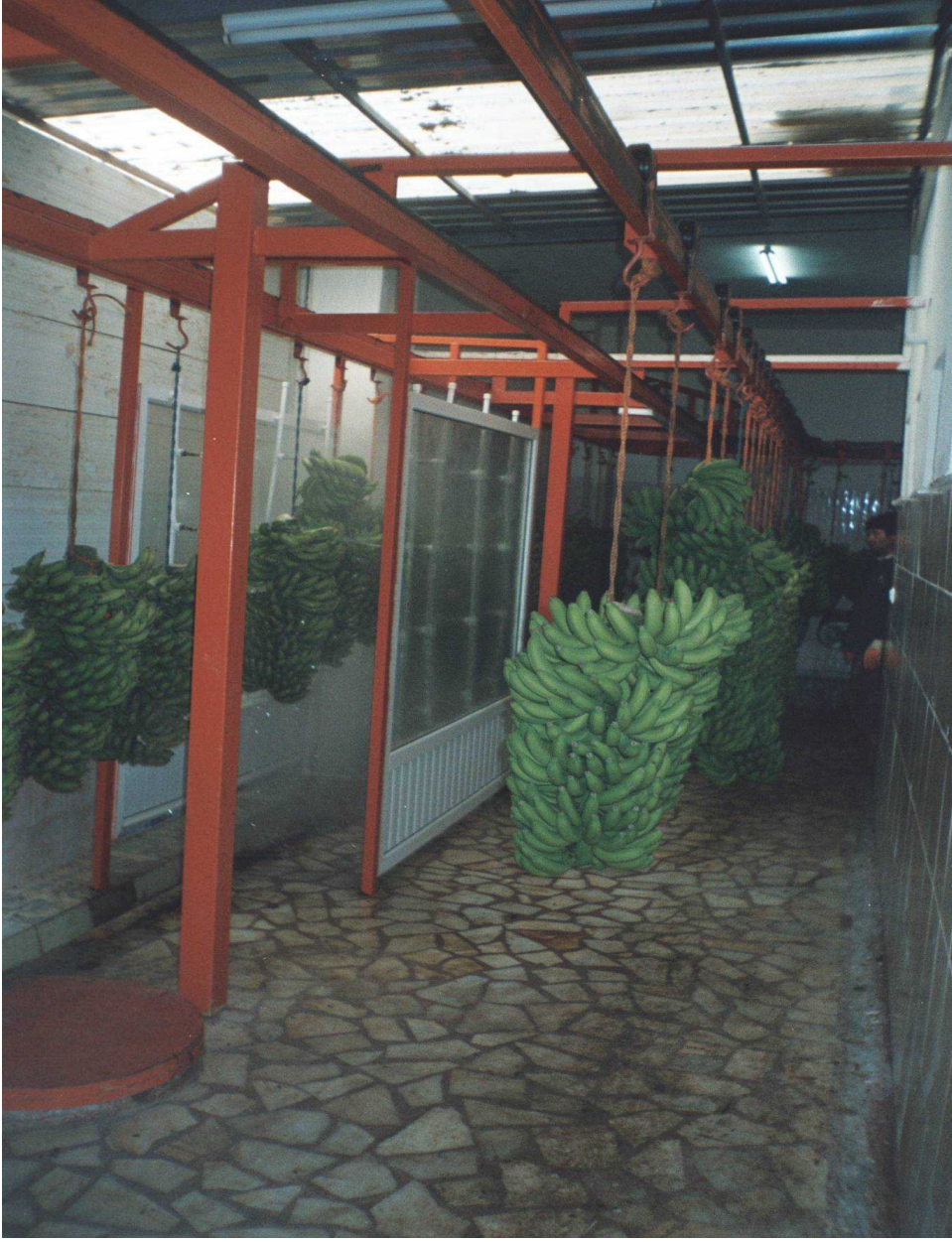
Resim 9 Muz Sarartma Fabrikası Görünümü

Seralarda suni olarak oluşan tropik iklim özelliği neticesinde iyi sonuç alınmış ve muz Anamur’da 1980 li yıllardan sonra hızla üretimi artmaya başlamıştır. Teknoloji’nin getirdiği imkânlar sayesinde yüksek verim elde edilmiş olup, dünya ortalamasının üzerinde ürün alınır hale getirilmiştir. 25 Dekar başına 6.000 kg. gibi verim alınmaktadır. Seralarda gübreleme, damlama sulama