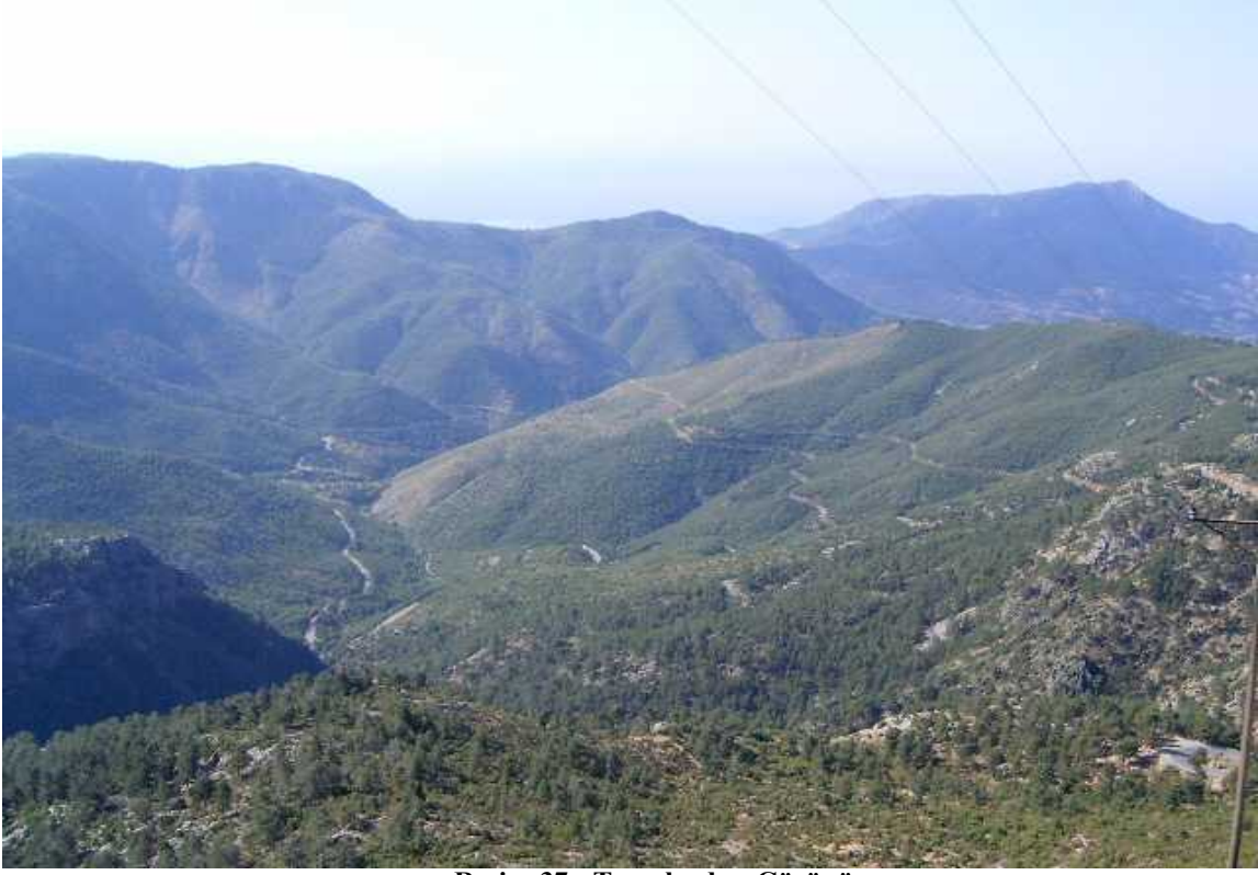
Resim 37: Toroslardan Görünüm