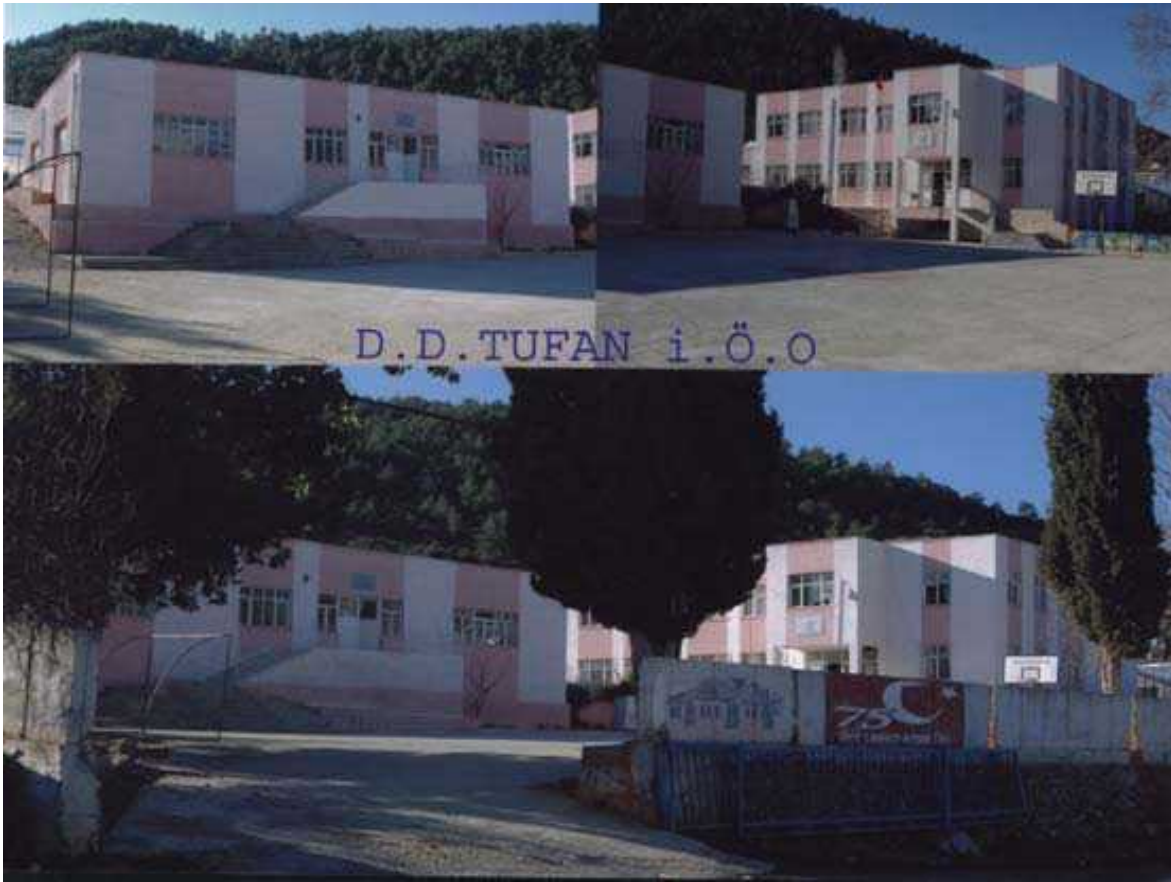
Resim 19 Okulumuzdan Görünüm

Okulun Tarihçesi: 1970 yılı eğitim-öğretime açılan okul ilköğretimin 8 yıla çıkarılmasından sonra 1991 yılında ikinci bir bina yapılmıştır.