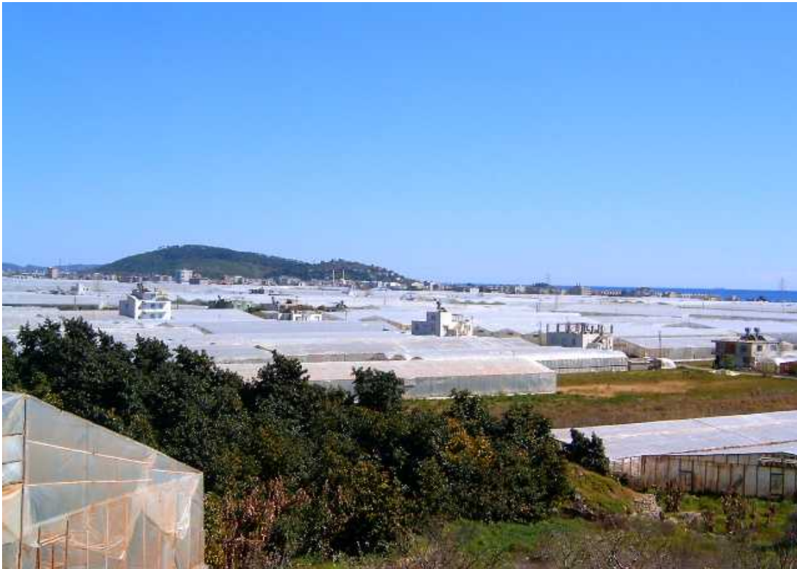
Resim 10 Muz Seralarından Görünüm

Bu durum yerli muzun pazar şansını azaltmaktadır. Oysa yukarda belirttiğimiz gibi depolama ve ambalajlama aşamasında gerekli hassasiyetleri göstererek, muzun büyük şehirlerdeki hipermarketlere ve süper marketlere ulaşmasını sağlayarak pazar payını genişletmek ve daha yüksek fiyata satmak mümkündür. Böylelikle üreticinin geliri artacak ve daha kaliteli muz yetiştirilmesini teşvik edecektir.