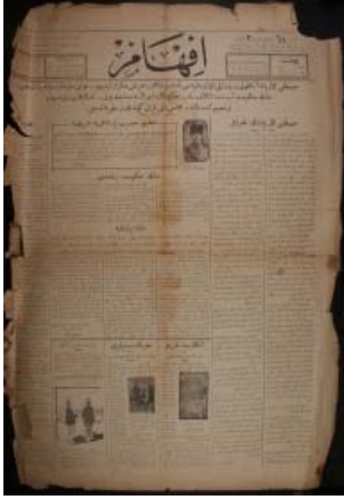
68. sayının birinci sayfası.