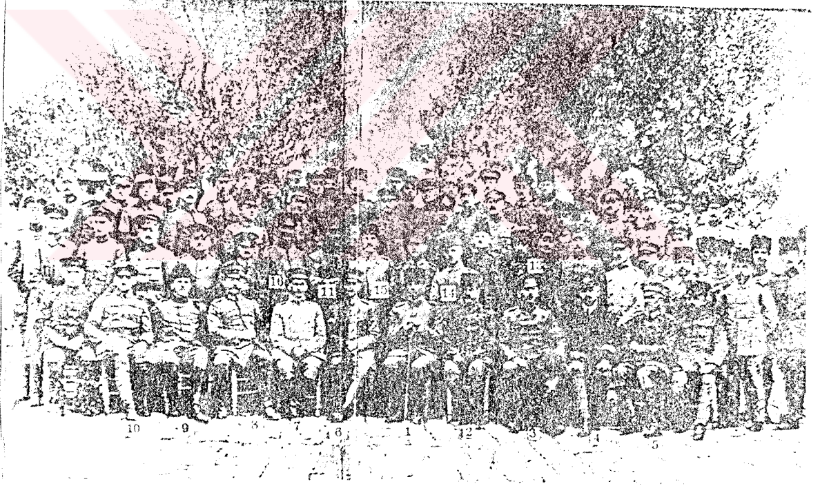
RESİM 3 : Yıldırım Ordular Grubu Komutanı Mareşal Von Falkenheim ve Karargah Subayları*

* GENELKURMAY BAŞKANLIĞI, 1986, Birinci Dünya Harbinde Türk Harbi Sina-Filistin Cephesi , Genelkurmay Basımevi, Baskı I, IV. Cilt 2 nci Kısım, Ankara.