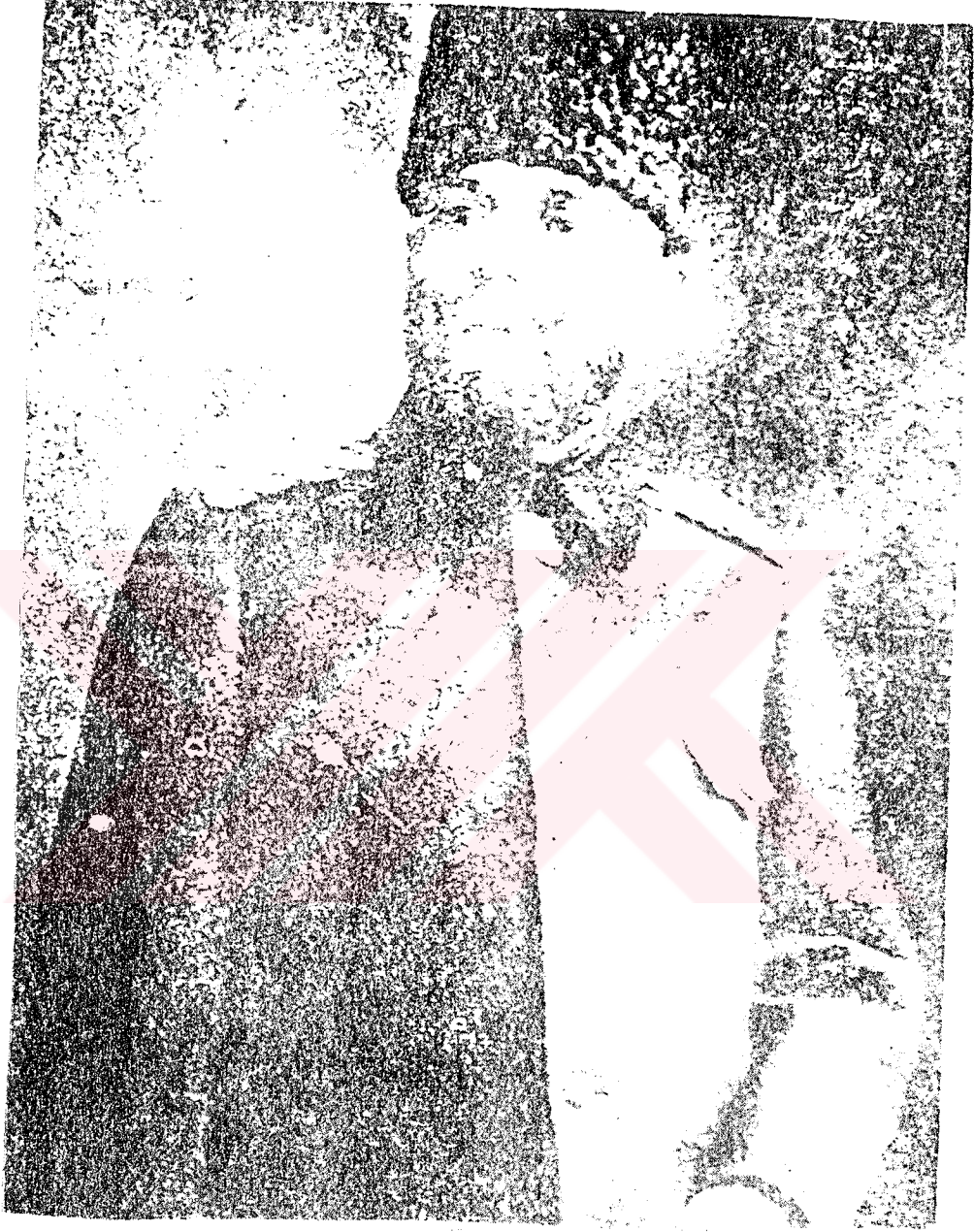
RESİM 5: Bahriye Nazırı ve 4 ncü Ordu Komutanı Ahmet Cemal Paşa

* GENELKURMAY BAŞKANLIĞI, 1986, Birinci Dünya Harbinde Türk Harbi Sina-Filistin Cephesi, Genelkurmay Basımevi, Baskı I, IV. Cilt 2 nci Kısım, Ankara.