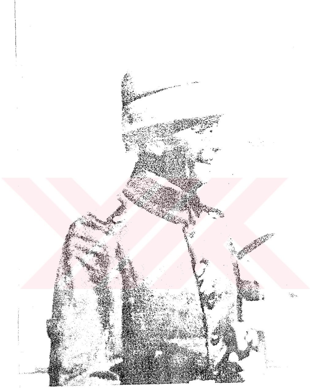
RESİM 6: Sina Cephesi ve 8 nci Ordu Komutanı Von Kress*

* GENELKURMAY BAŞKANLIĞI, 1986, Birinci Dünya Harbinde Türk Harbi Sina-Filistin Cephesi , Genelkurmay Basımevi, Baskı I, IV. Cilt 2 nci Kısım, Ankara.