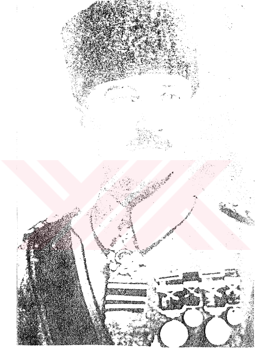
RESİM 7: 7 nci Ordu Komutanı Mustafa Kemal Paşa (Atatürk)*

* GENELKURMAY BAŞKANLIĞI, 1986, Birinci Dünya Harbinde Türk Harbi Sina-Filistin Cephesi , Genelkurmay Basımevi, Baskı I, IV. Cilt 2 nci Kısım, Ankara.