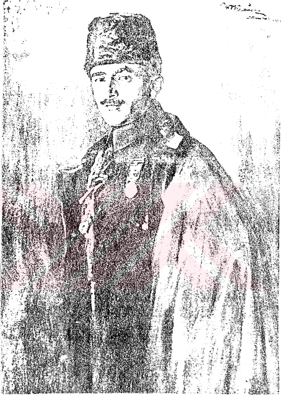
RESİM 1 : Başkomutan Vekili Ve Harbiye Nazırı Enver Paşa*

* GENELKURMAY BAŞKANLIĞI, 1986, Birinci Dünya Harbinde Türk Harbi Sina-Filistin Cephesi , Genelkurmay Basımevi, Baskı I, IV. Cilt 2 nci Kısım, Ankara.