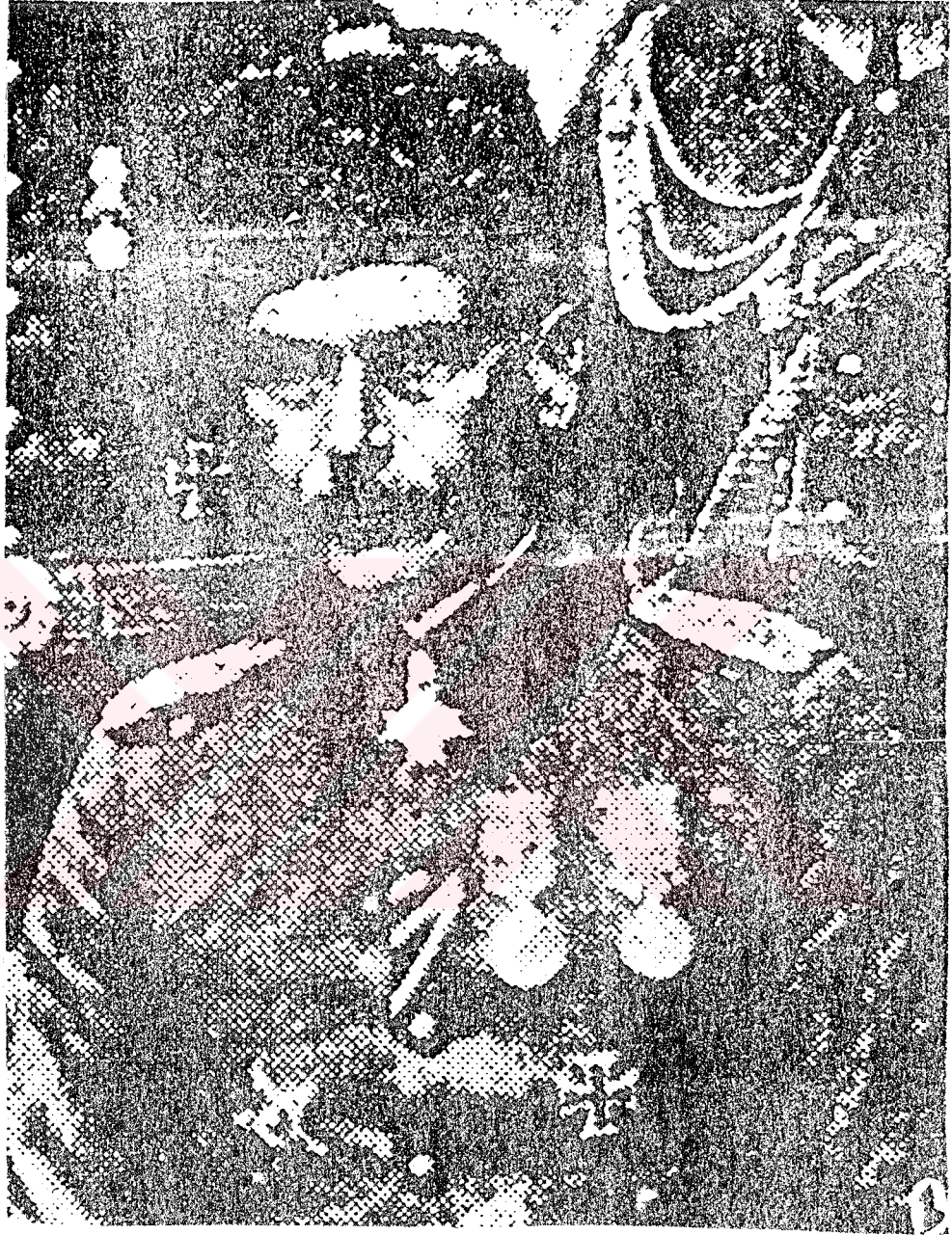
RESİM 8 : Alman Askeri Heyeti Başkanı, 5 nci Ordu Komutanı ve Yıldırım Ordular Grubu Komutanı Liman Von Sanders*