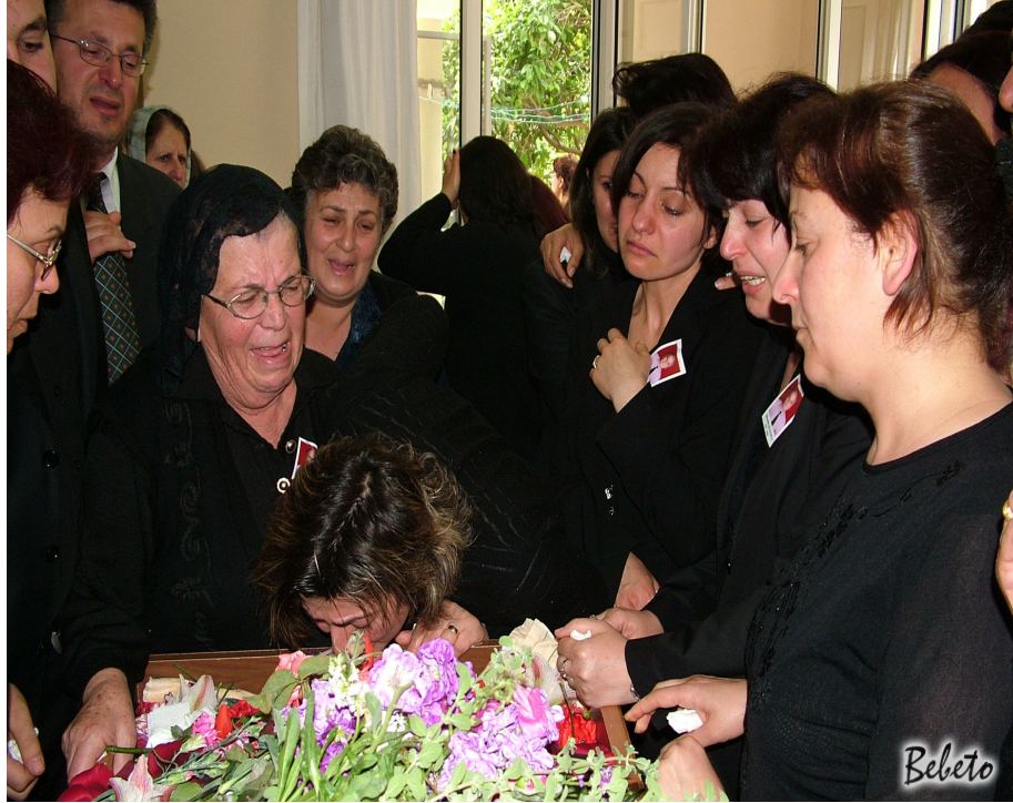
Resim 84. Vedalařma ( Samandađ )