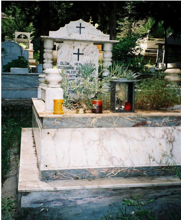
Resim 14. Mum Bırakılmış Mezar Örneği (Sarılar)