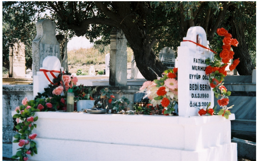
Resim 4. Üzerine Ölü Hediyesi Olarak Kolonya Bırakılmış Mezar (Samandağ / Alevi)