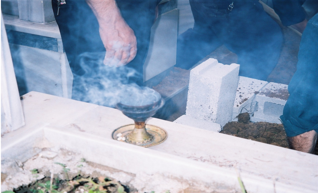
Resim 75. Bahur Yakılan Kap