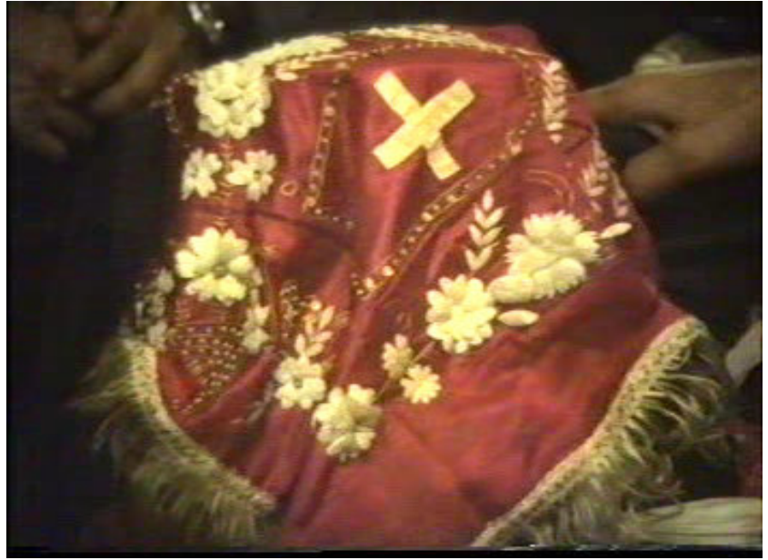
Resim 37. Papazın Yüzünü Kapatın Üzeri İşlemeli Örtü