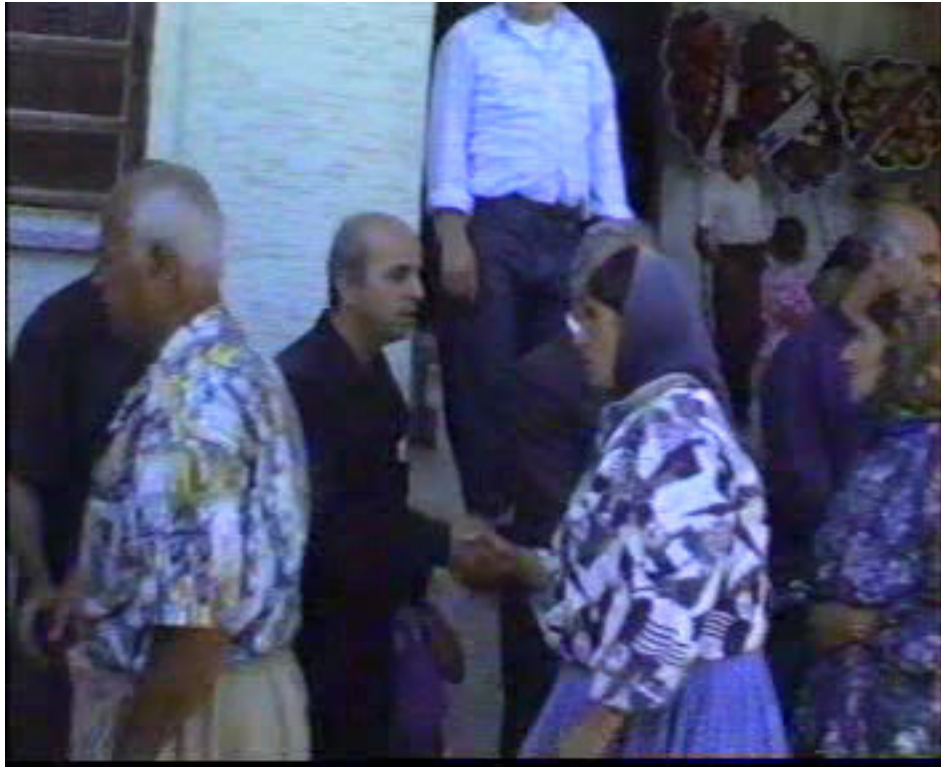
Resim 65. Taziyelerin Mezarlık Çıkışında Kabul Edilmesi ( Altınözü )