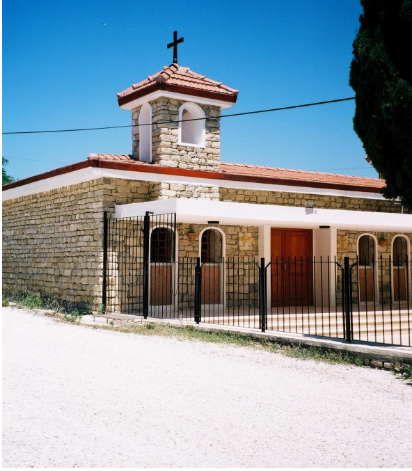
Resim 28. Vakıflı Surp Asdvadzadzin Ermeni Kilisesi