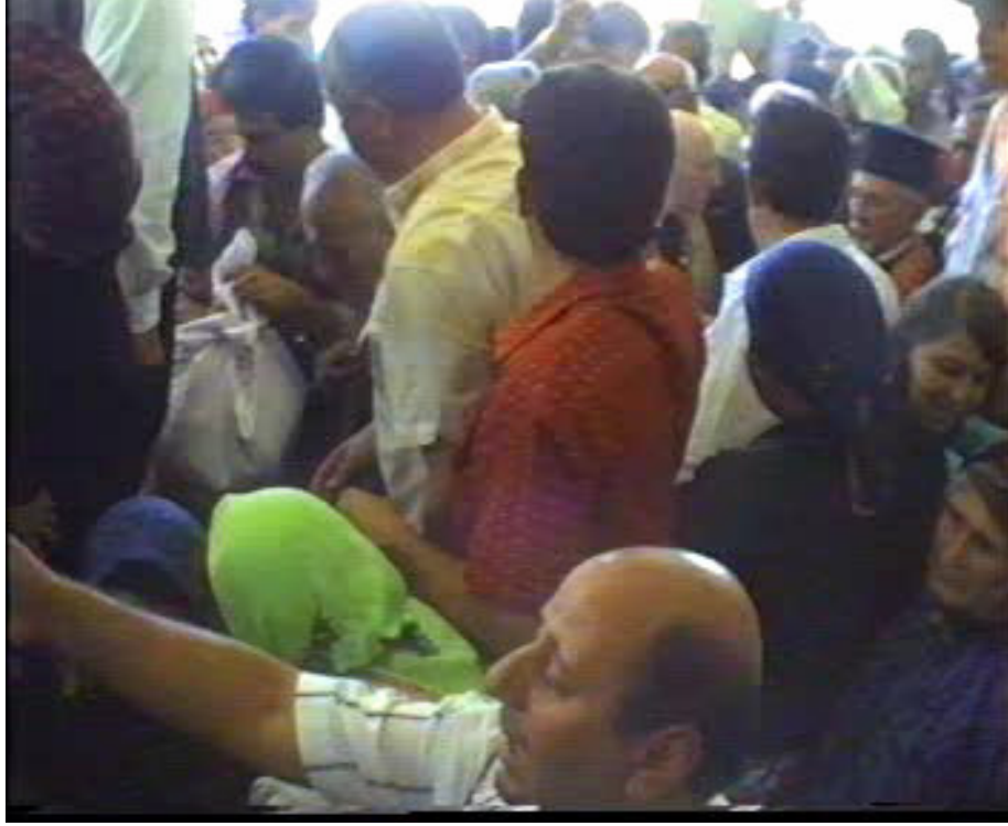
Resim 54-55. Cenazeye Katılanlar ( Altınözü)