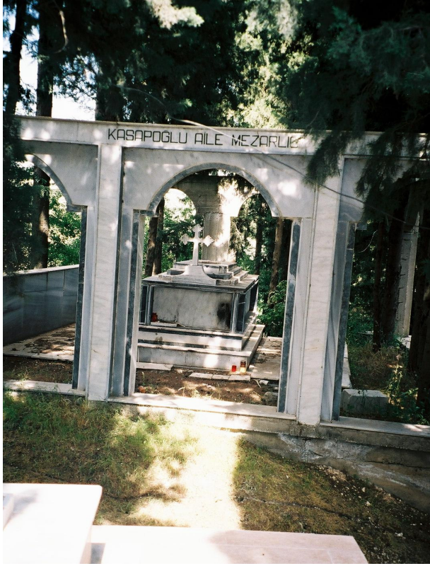
Resim 20. Üzerinde Hangi Aileye Ait Olduğu Yazılı Olan Hışğhaşı Örneği (Sarılar)