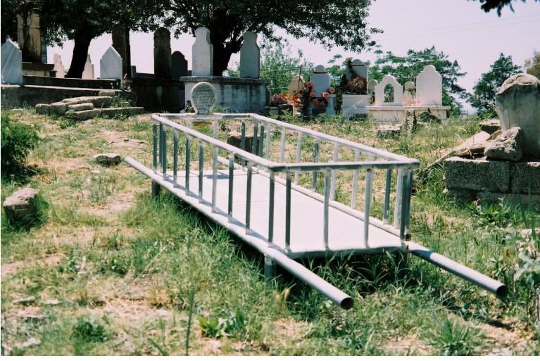
Resim 1. Arap Alevilerin Cenazelerini Taşıdıkları “SEDYE” (Samandağ)