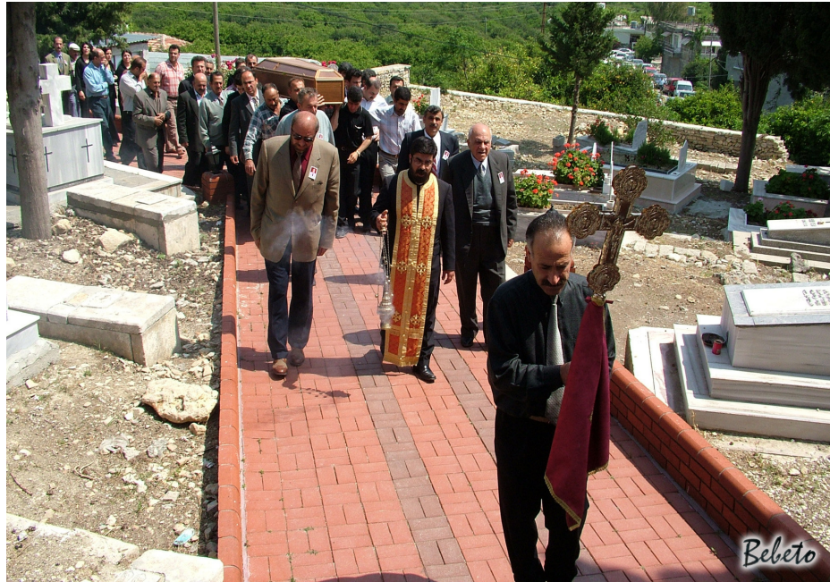
Resim 89. Haç, Papaz ve Cenaze Alayı