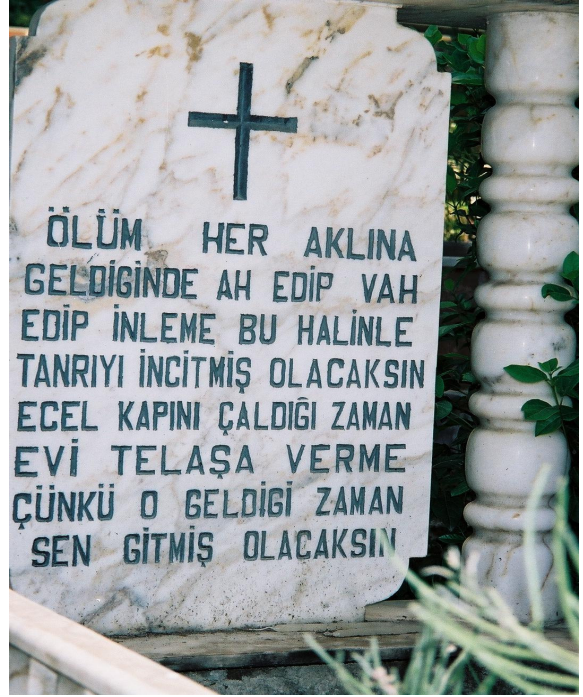
Resim 15. Mezar Taşı Örneği (Sarılar)