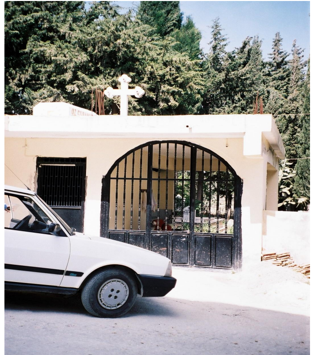
Resim 8. Altınözü (Sarılar) Hıristiyan Mezarlığı Girişi (Sarılar)