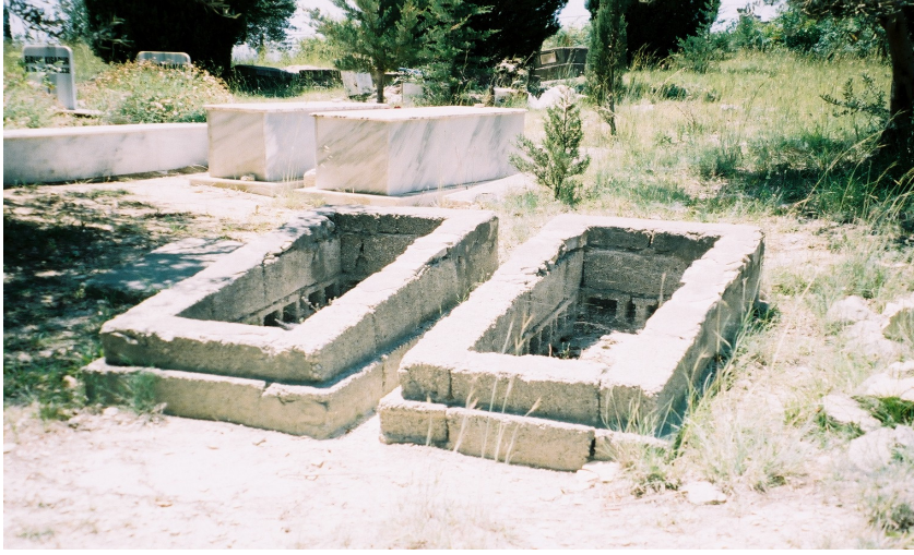
Resim 32. Ermeni Mezarlığından Farklı Bir Mezar Tipi (Vakıflı)