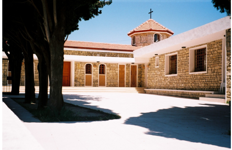
Resim 29. Vakıflı Surp Asdvadzadzin Ermeni Kilisesi