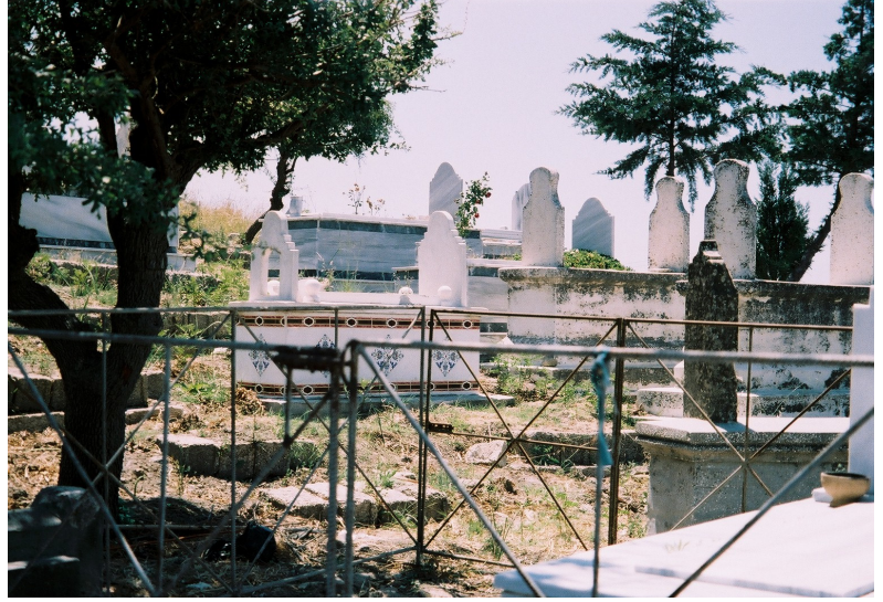
Resim 2. Arap Alevi Mezarları (Samandağ)