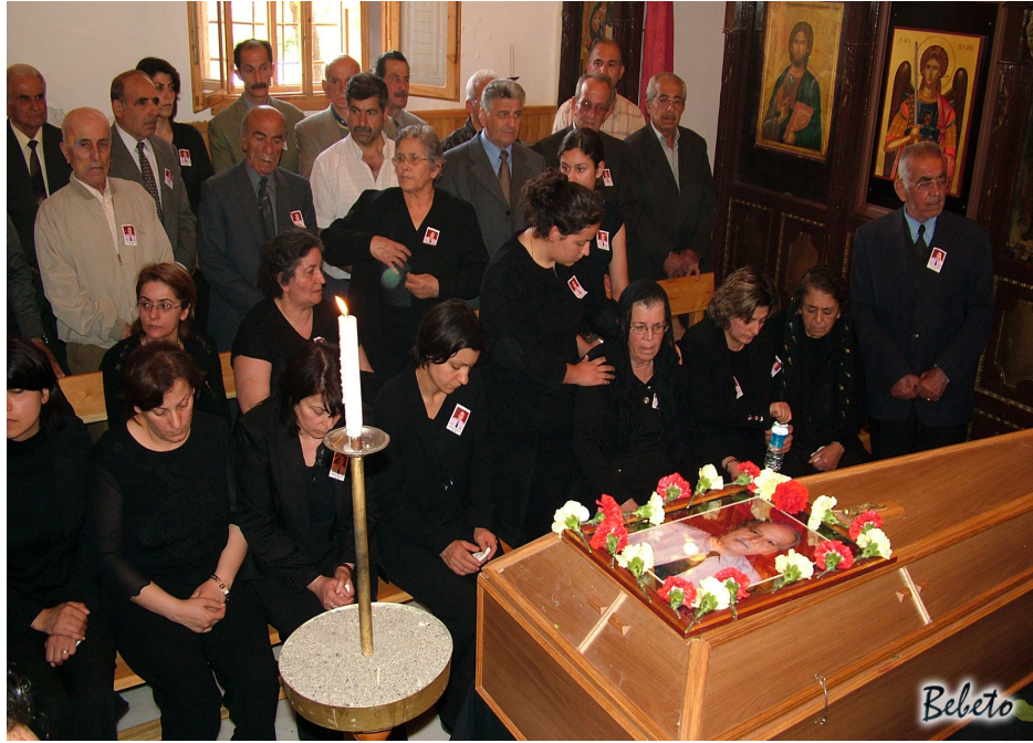
Resim 93. Kilisede Tören