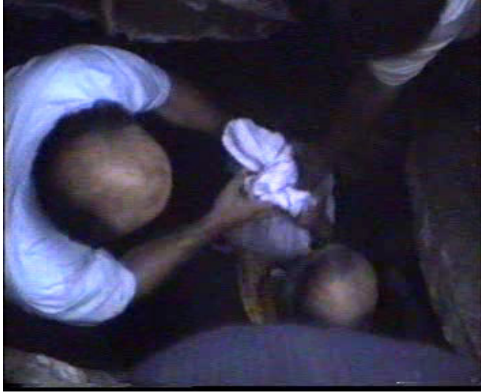
Resim 57. Bir Önceki Papazın Kemiklerinin Torba İle Cenazenin Yanına Konulması