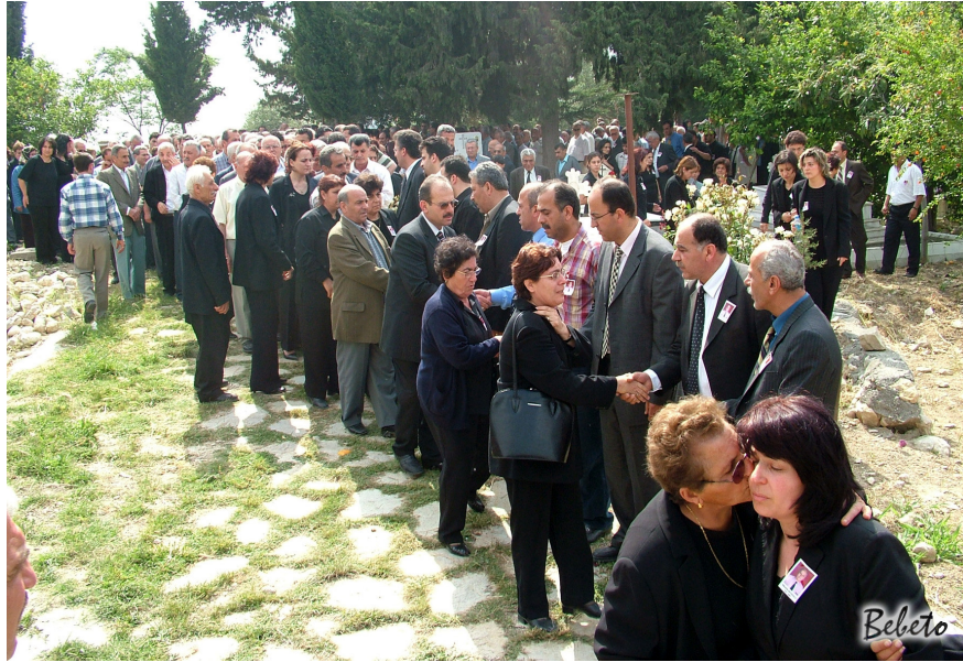
Resim 105. Taziyelerin Dile Getirilmesi