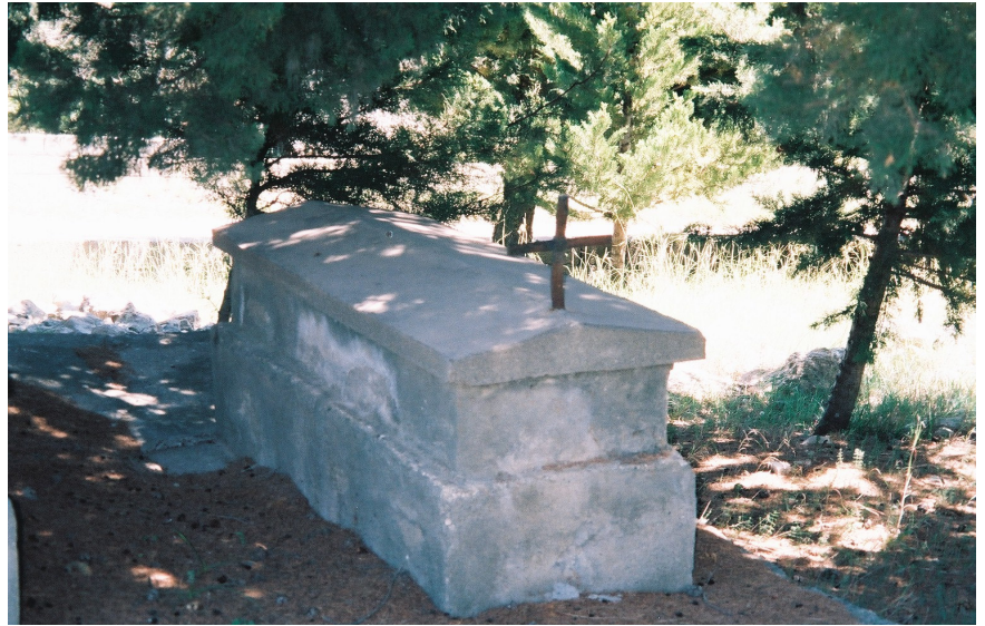
Resim 33. Ermeni Mezarlığından farklı Bir Mezar Tipi (Vakıflı)