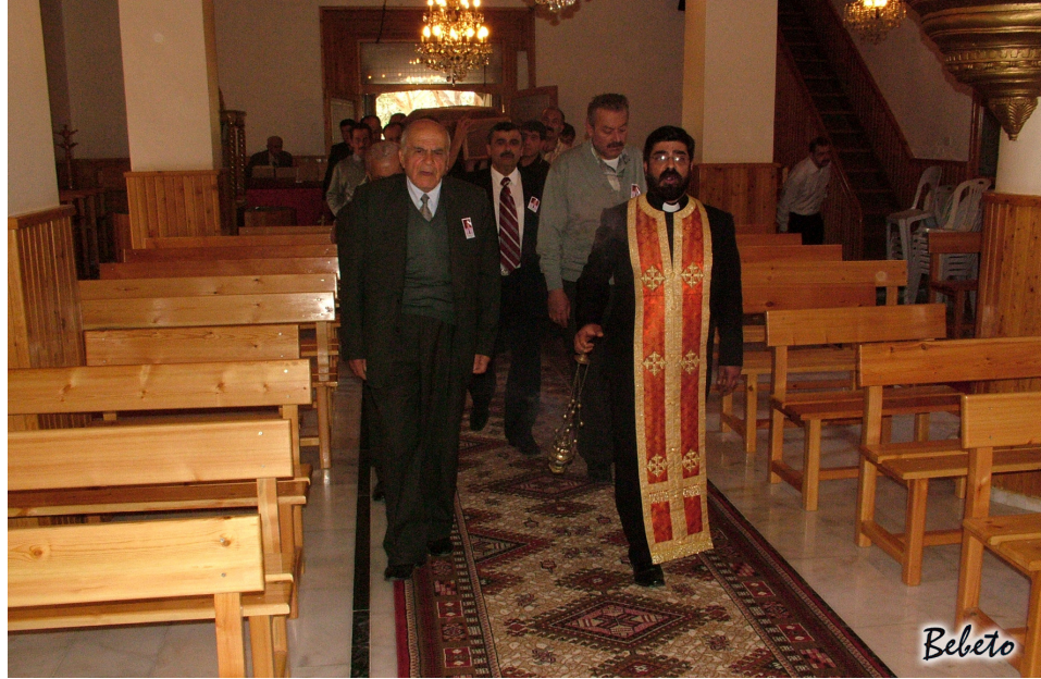
Resim 91. Kiliseye Giriş ( Samandağ )