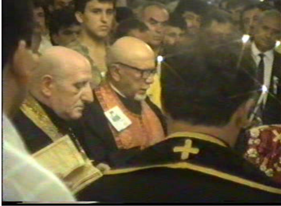
Resim 38-39. Kilisedeki Dini Tören ve Törene Katılan Papazlar ( Altınözü )