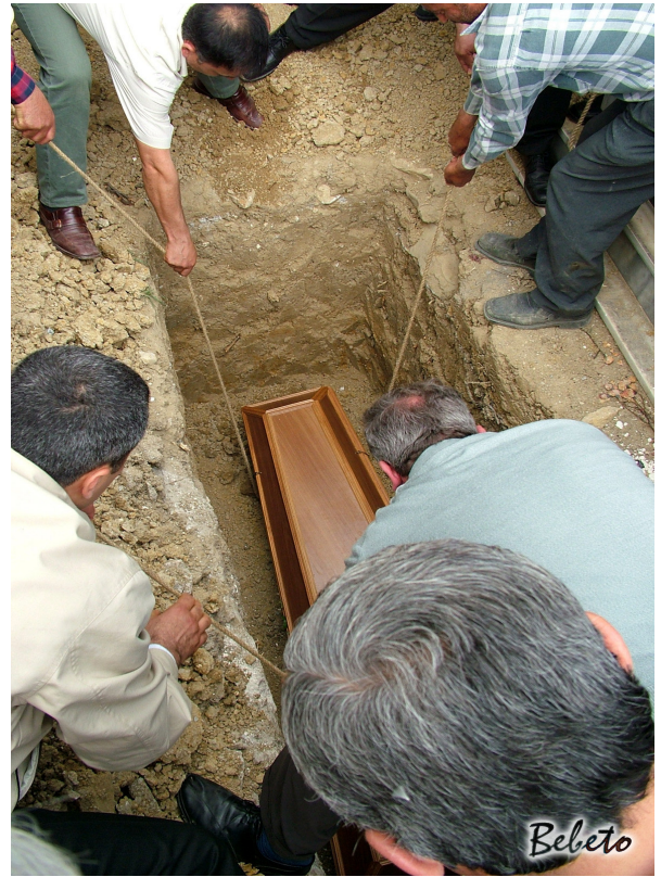
Resim 102-103. Cenazenin Tabutla Mezara İndirilmesi