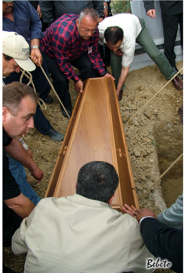
Resim 101. Tabutun Mezara İndirilmesi