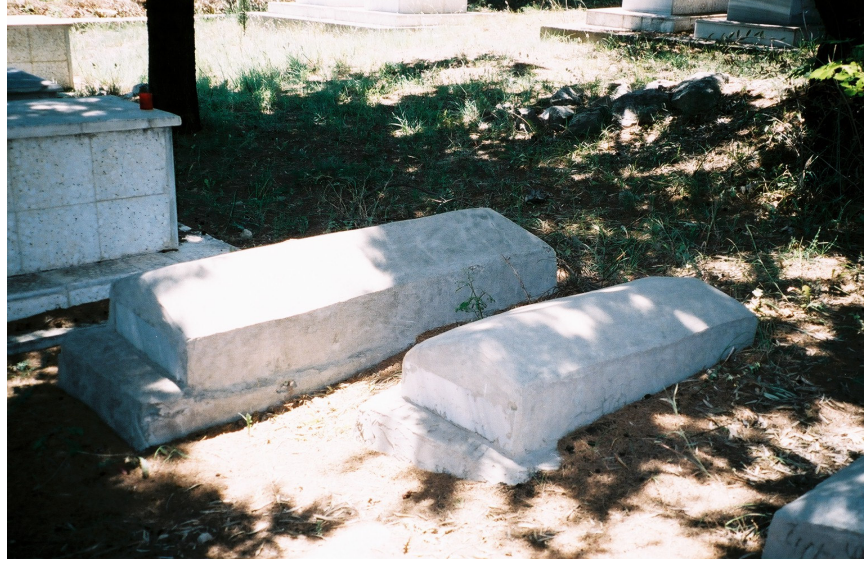
Resim 31. Üzerine Beton Dökülmüş Ermeni Mezar Tipi ( Vakıflı )