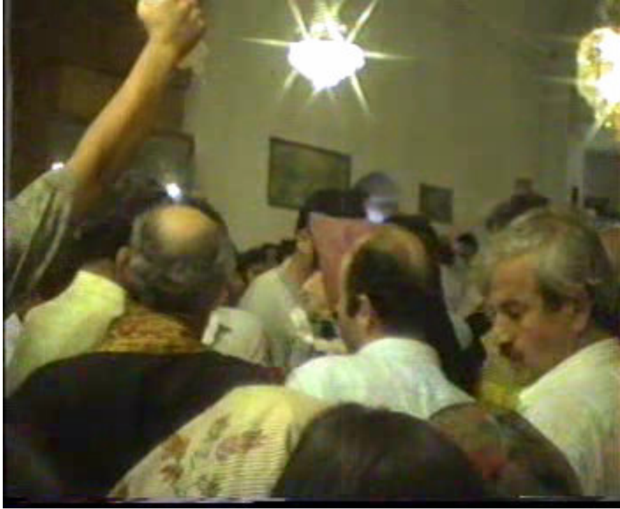
Resim 53. Gmlmeye Gtrlmesi ( Altınözü )