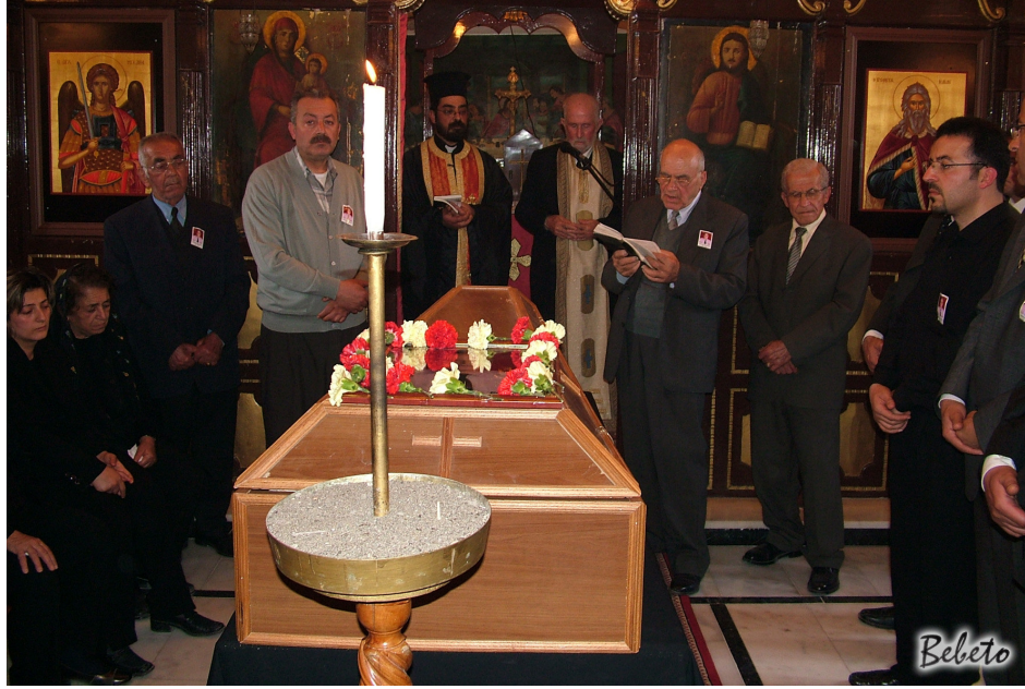
Resim 94. Tabutun Ayakları Dođu, Başıysa Batıdadır. Baş Kısmına Mum Yakılır