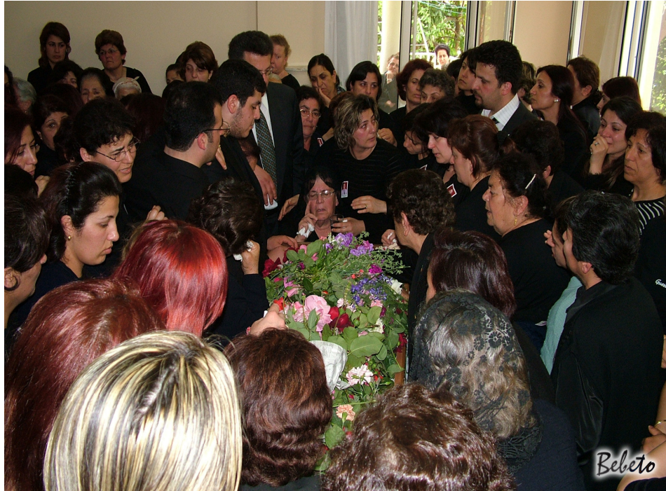
Resim 81. Evde Cenaze İle Vedalaşma ( Arap Hıristiyan / Samandağ )