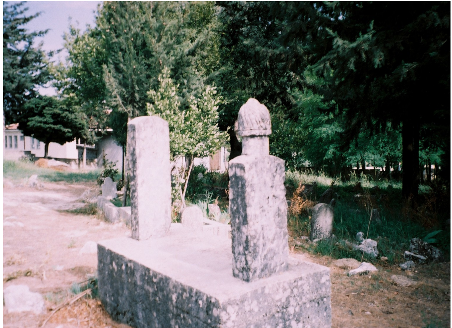
Resim 23. Eski Bir Mezar Örneği (Fatikli)