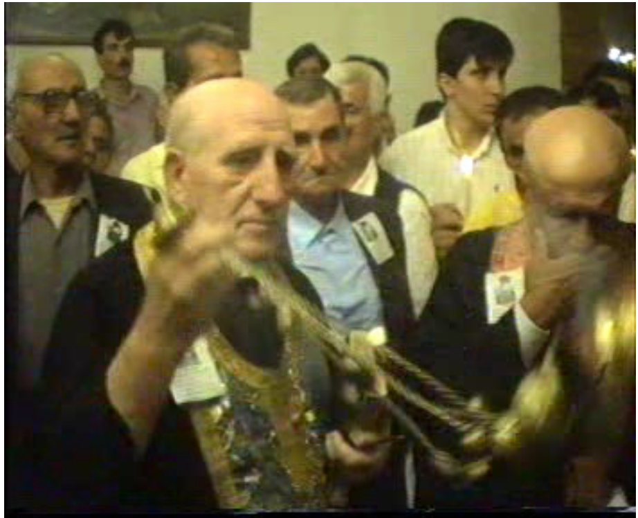
Resim 47. Buhurdanlıkla Tütsüleme İşlemi ( Altınözü )