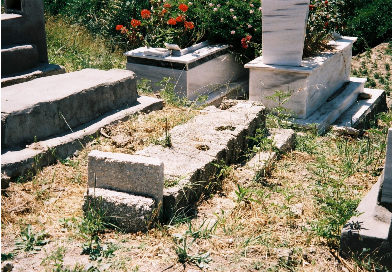
Resim 3. Dört Mezar Tipi Bir Arada ( Samandağ / Alevi )