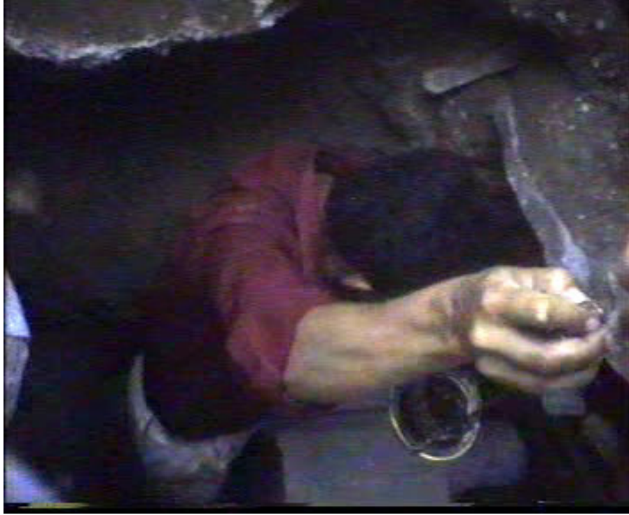
Resim 60. Yanına Konulacak Gaz Lambası