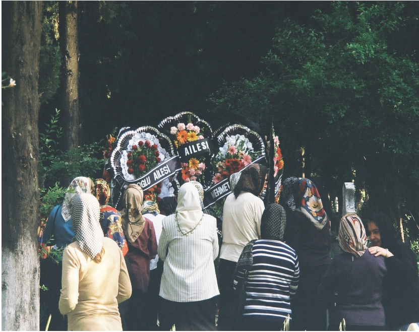
Resim 78. Erkeklerden Sonra Kadınların Mezarı Ziyareti ( Arap Alevi / Antakya )