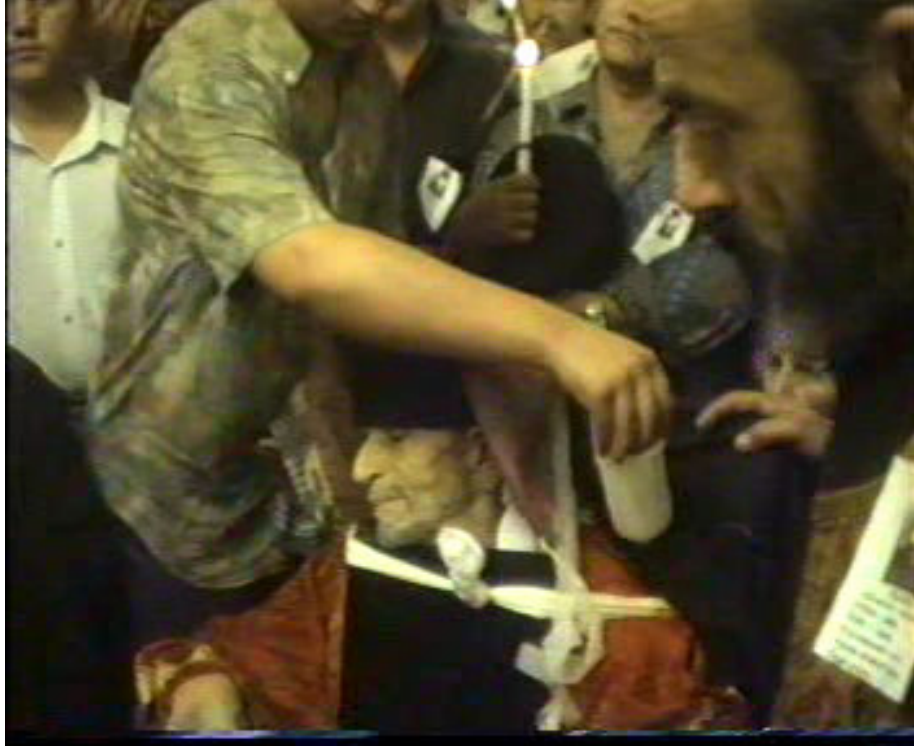
Resim 48. Papazın Üzerine Kolonya Serpilmesi ( Altınözü )