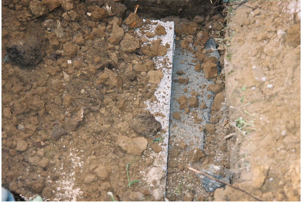
Resim 71. Taş Bloklar ( Arap Alevi /Antakya )