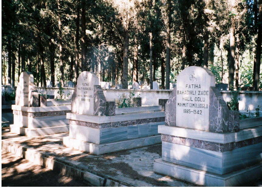
Resim 26. Genel Görünüm (Reyhanlı )