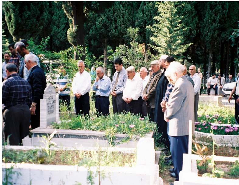
Resim 69. Alevi Cenazesinde Saf Tutarak Dua Okuyanlar ( Antakya )