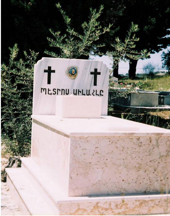
Resim 34. Üzeri Ermenice Yazılmış, Fotoğraflı Ermeni Mezarı (Vakıflı)