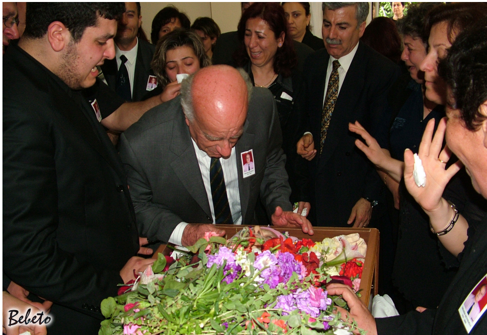
Resim 85. Vedalařma ( Samandađ )