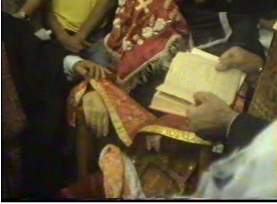
Resim 42. Papazın Sandalyede Oturur Vaziyetteki Hali ( Altınözü )