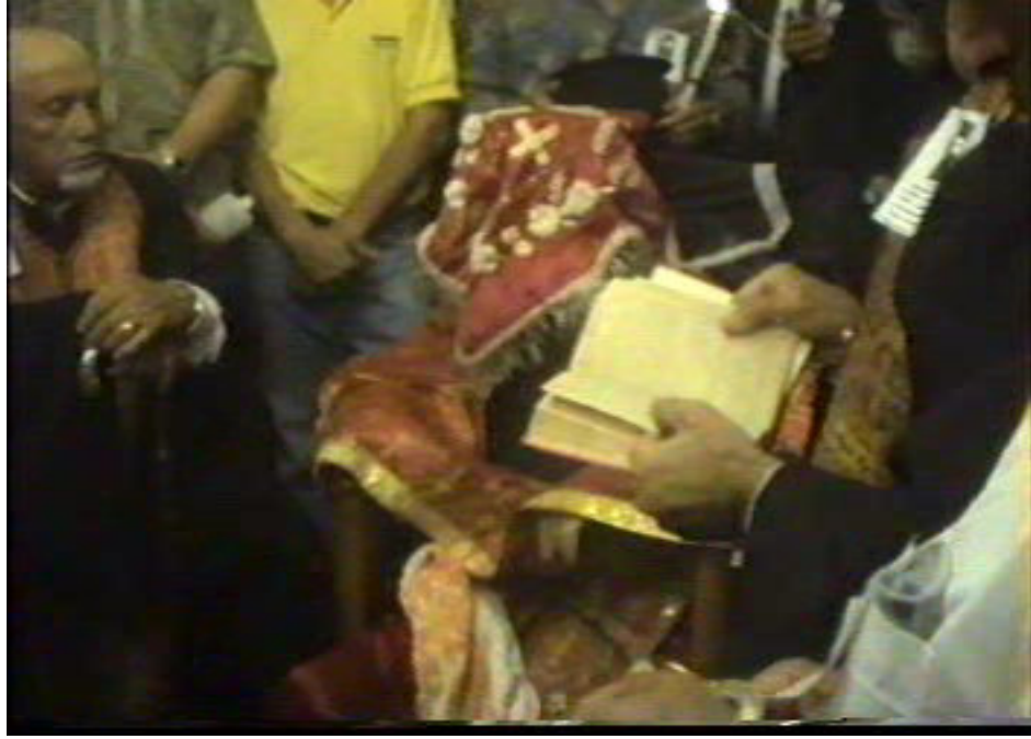
Resim 40-41. Buhurdanlıkla Tütsülenmesi ve İncil'den Ayetlerin Okunması