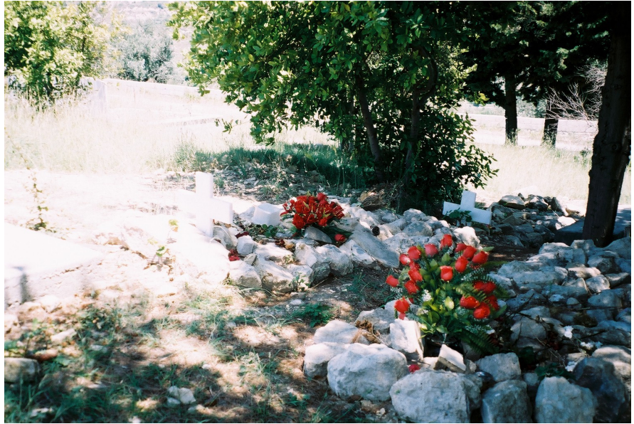
Resim 35. Kısa Süre Önce Gömülmüş Bir Cenazeye Ait Mezar. Ayaklarında ve Baş Kısımında Haçlar Var (Vakıflı)