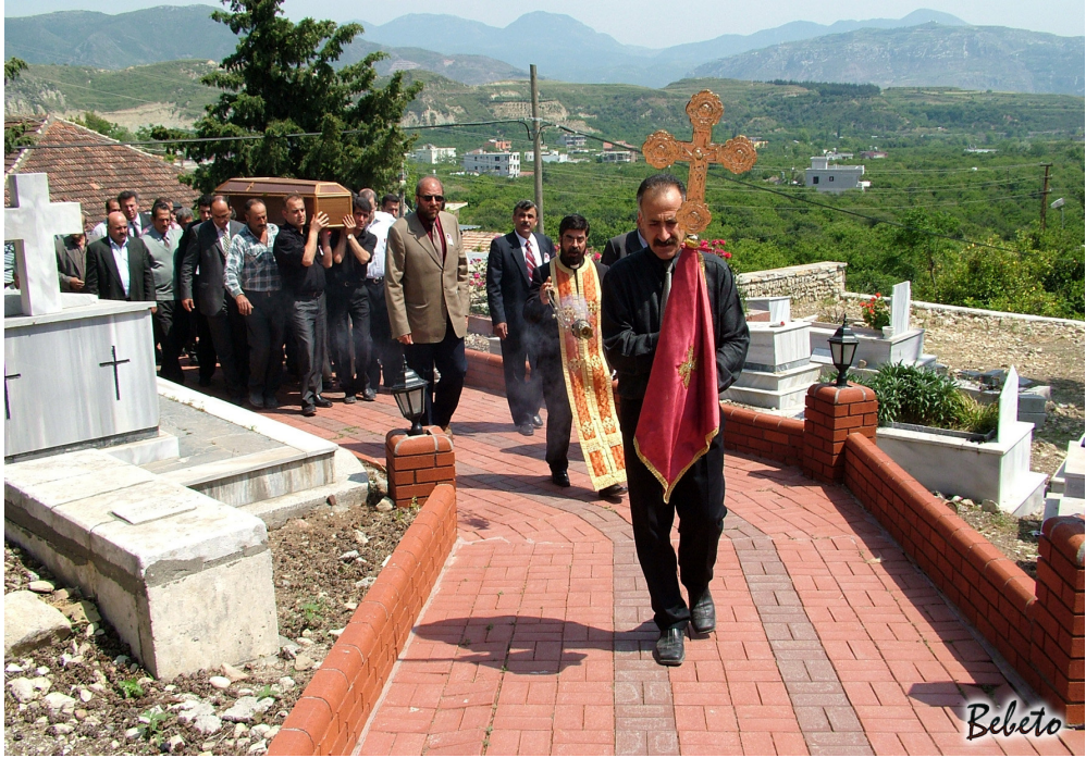
Resim 88. Cenazenin Kiliseye Götürülüşü (Samandağ)