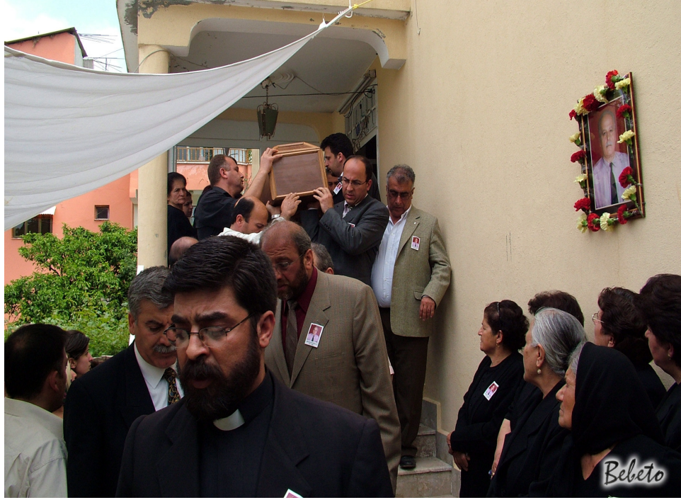
Resim 86. Cenazenin Ayakları Önde Olmak Kaydıyla Evden Çıkarılması (Samandağ)