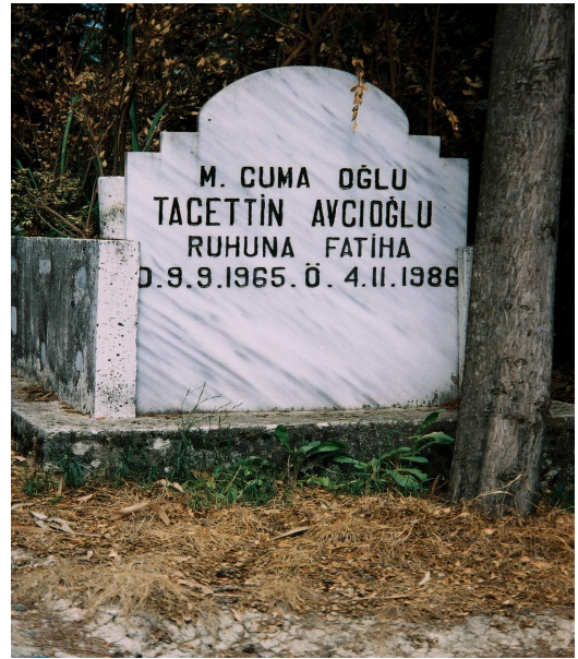
Resim 21. Mezar Taşı Örneği (Fatikli)