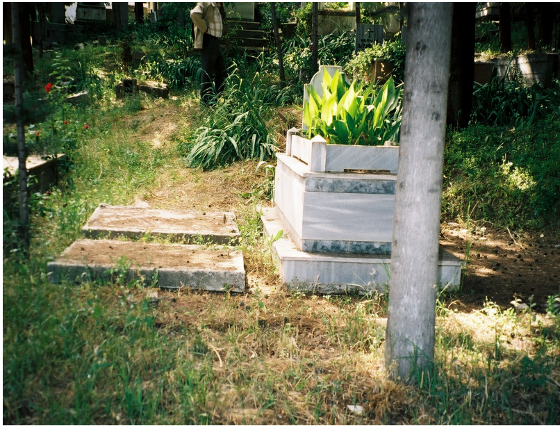
Resim 18. Girişi Toprak Üzerinde Olan Çift Girişli Hışğhaşı Örneği (Sarılar )