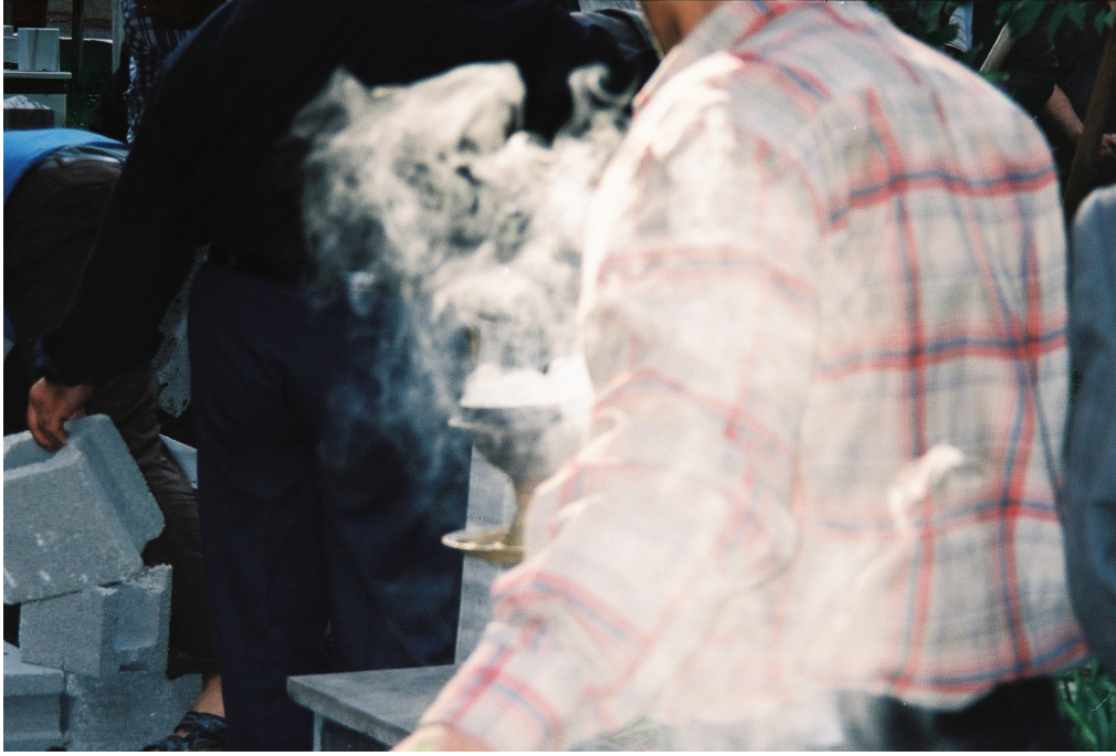
Resim 74. Buhur (Bahur / Puhur) Yakılması ( Antakya )