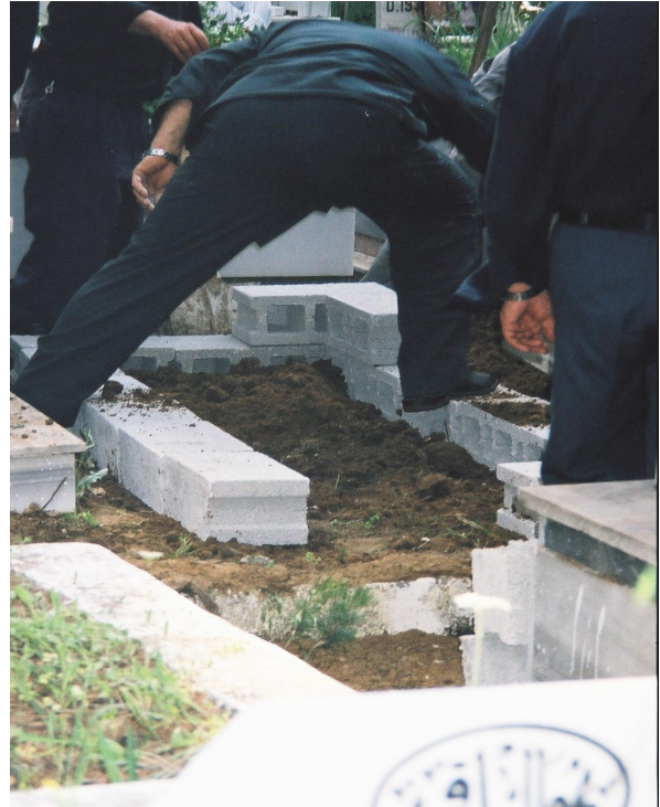
Resim 73. Briketlerle Mezar Şeklinin Verilmesi ( Arap Alevi / Antakya )