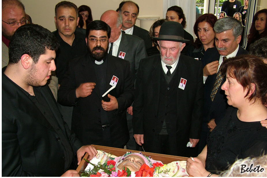
Resim 80. Kilise Töreninden Önce Evde Düzenlenen Tören (Arap Hıristiyan / Samandağ)