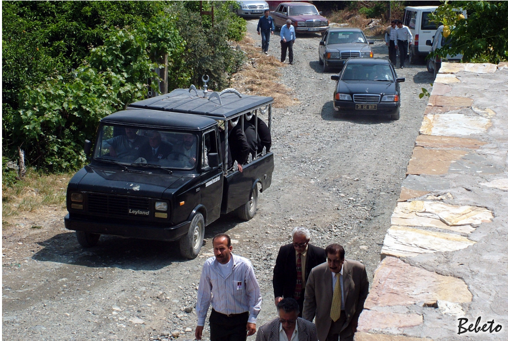
Resim 87. Cenazenin Kiliseye Getirilişi (Samandağ)