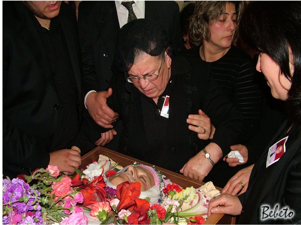
Resim 83. Mefta ile Vedalaşma ( Samandağ )