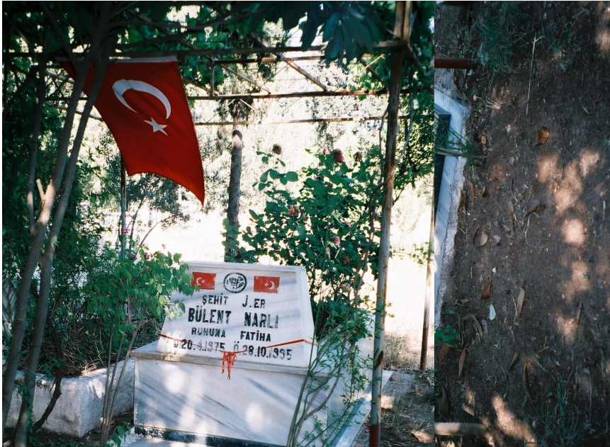
Resim 27. Bir Şehit Mezarı ( Reyhanlı )