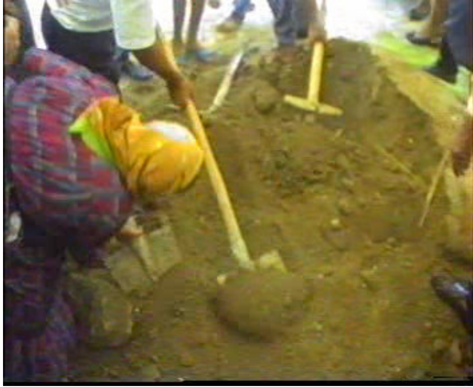
Resim 64. Mezarın Kapatılması