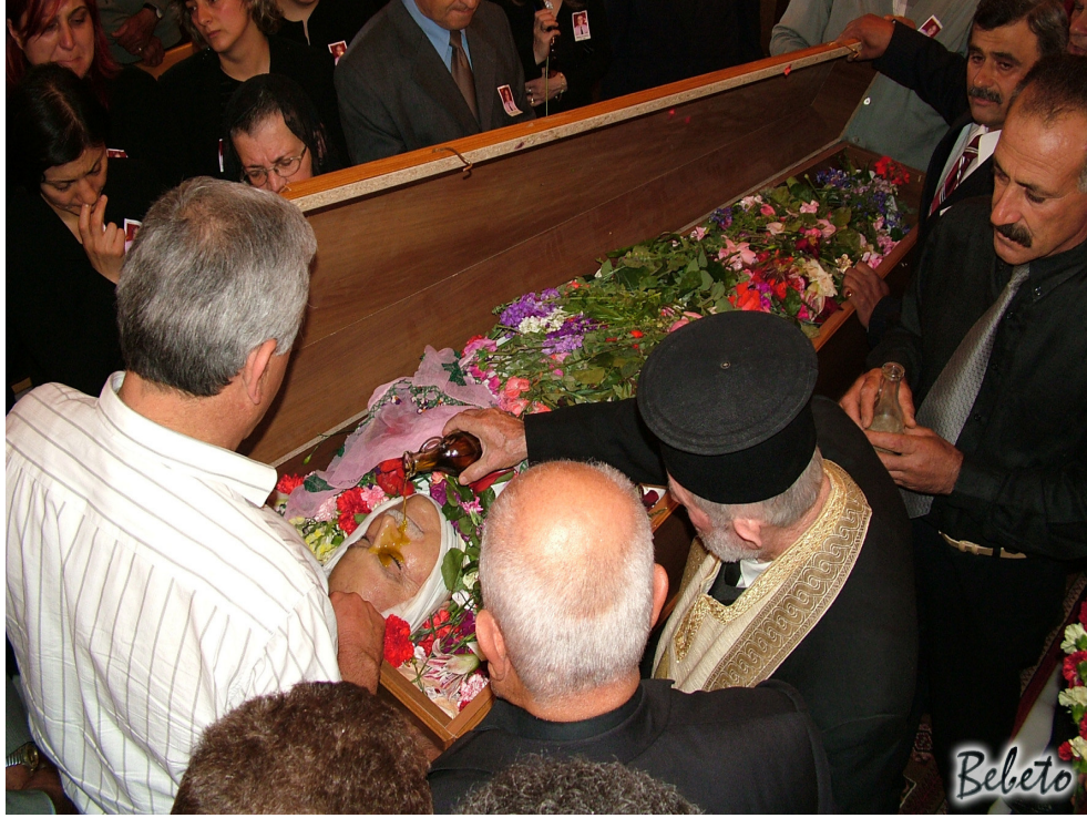
Resim 98. Cenazenin Üzerine Kutsal Yağ Dökülmesi