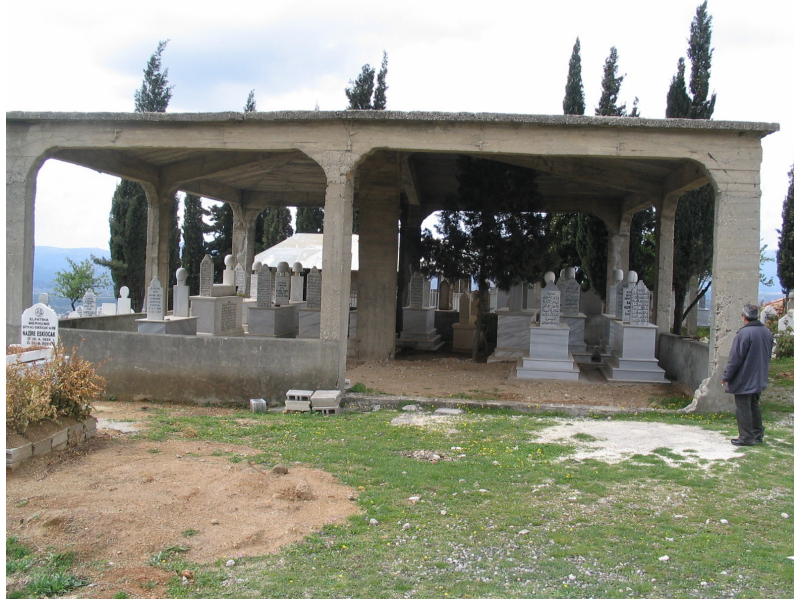
Resim 7. Halk Mezarlığı İçinde Bir Şeyh Mezarlığı (Harbiye) 1