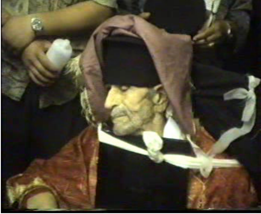
Resim 46. Papazın Göğsüne Bağlanmış İncil ( Altınözü )