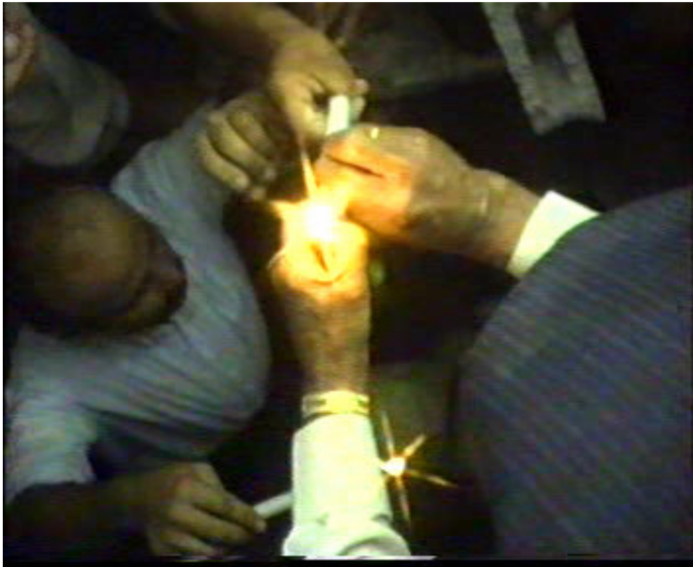
Resim 59. Yanına Yerleştirilecek Mumların Hazırlanması