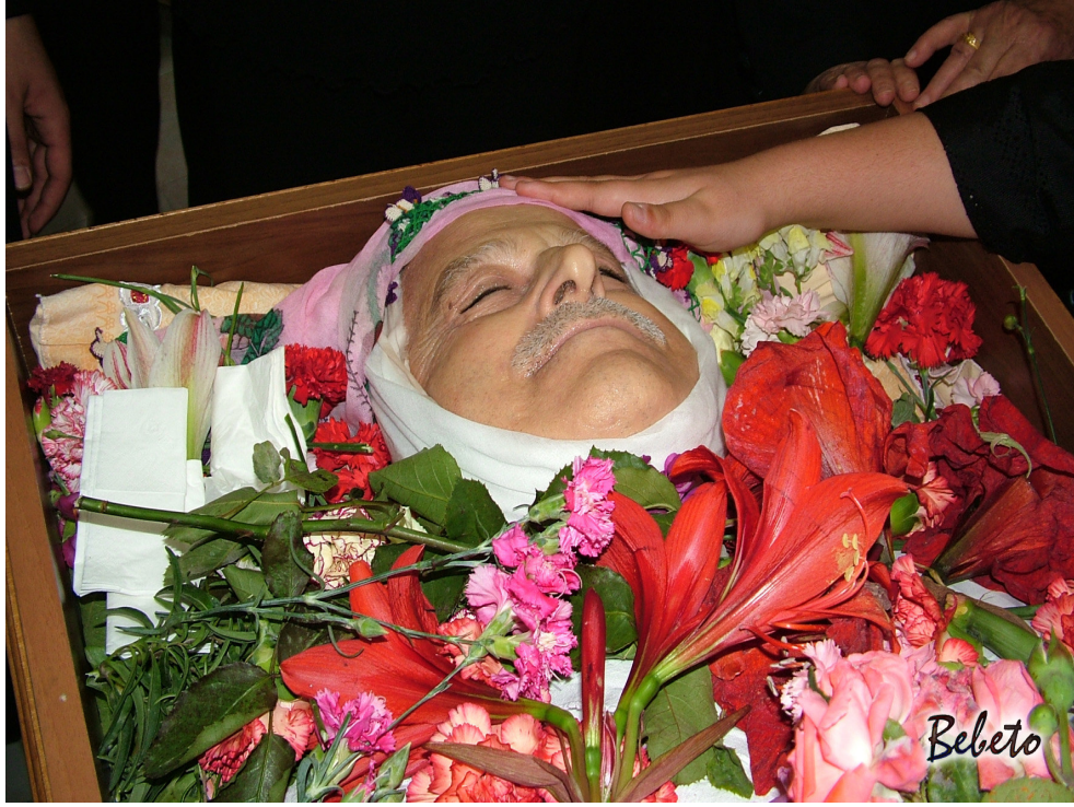
Resim 82. Ölen Kişinin Morgtan Eve Getirildikten Sonraki Hali ( Samandağ )