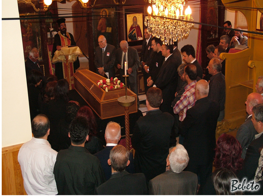
Resim 96. Kilisede Ayin