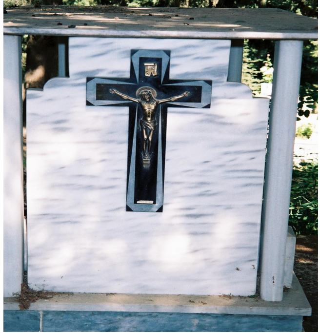
Resim 9. Haç'lı Bir Mezar Tip