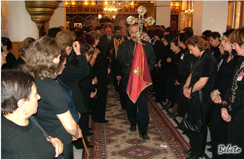
Resim 99. Cenazenin Define Götürülmesi