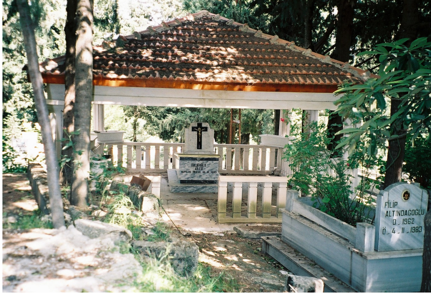
Resim 11. Hışğhaşi Mezar Tipi ( Sarılar )