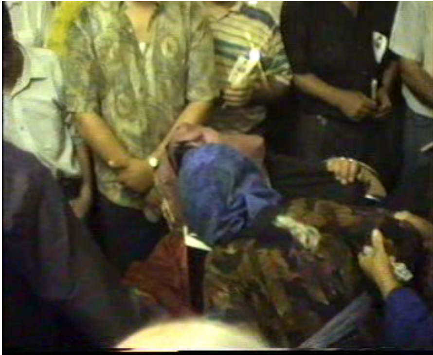
Resim 50-51. Papazla Vedalařma ( Altınözü )