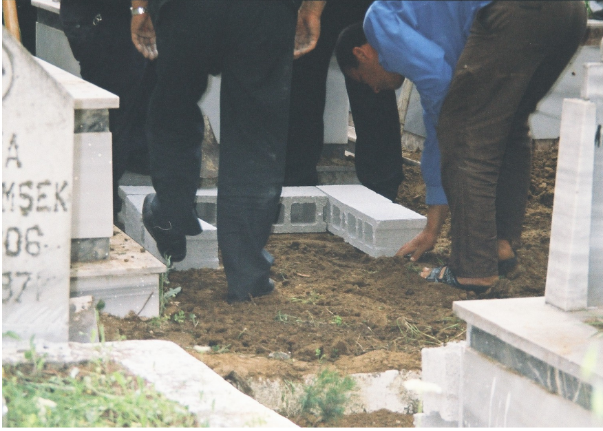
Resim 72. Mezarın Üzerinin Briketlerle Döşenmesi ( Arap Alevi/ Antakya )