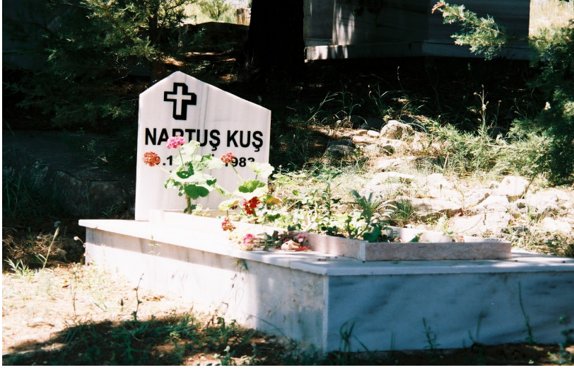
Resim 30. Bir Ermeni Mezarı ( Vakıflı )