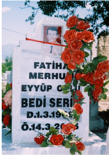
Resim 6. Genç Ölümünde Mezar Taşına Fotoğraf Konulduğunun Göstergesi Olan Bir Mezar Taşı ( Samandağ / Alevi )