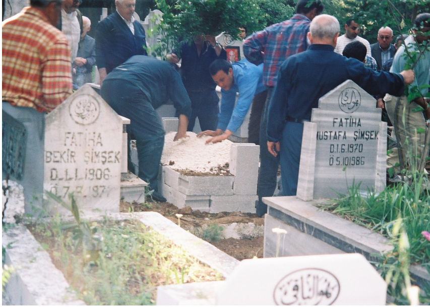
Resim 76. Mezar Görünümünün Verilmesi ( Arap Alevi / Antakya )