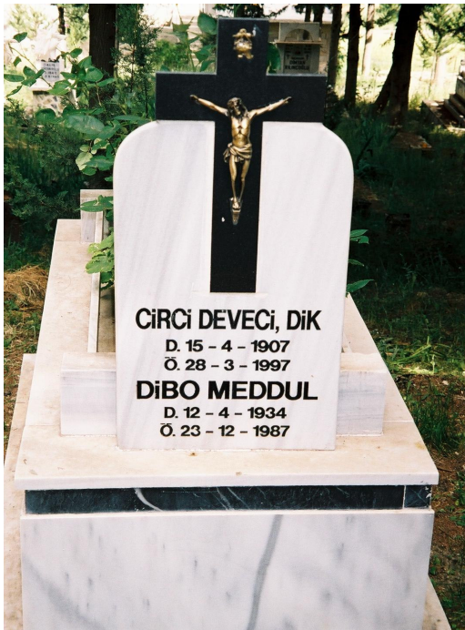
Resim 16. Çift Gömü Örneği ( Sarılar )