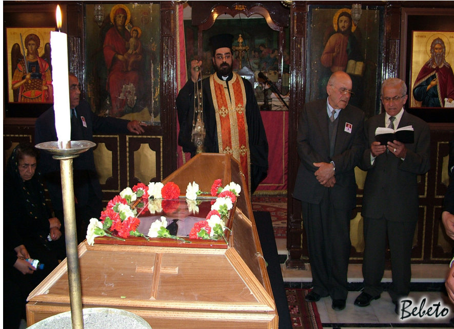
Resim 95. Kilisede Ayin (Samandağ )