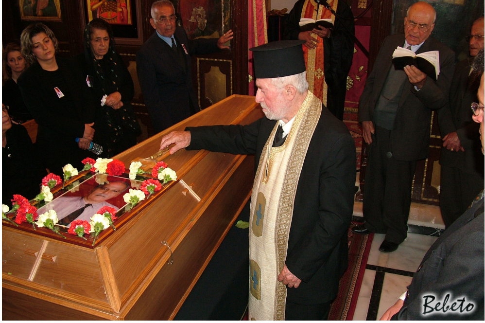
Resim 92. Papazın Tören Boyunca Tabutun Üzerinde Duracak Haç'ı Koyuşu