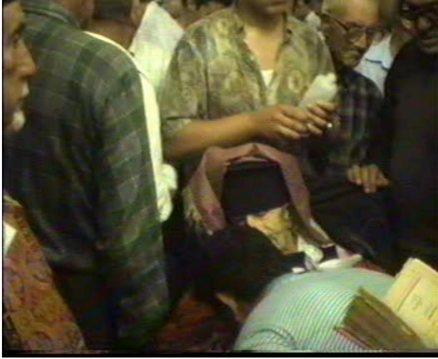
Resim 52. Vedalařma ( Altınözü )