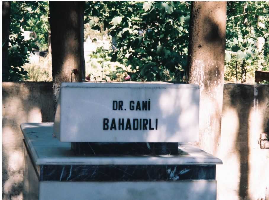
Resim 25. Bir Mezar Örneđi ( Reyhanlı )