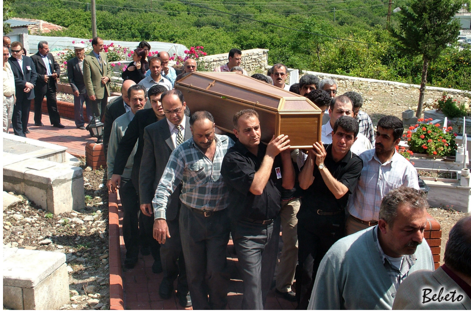
Resim 90. Tabutun Ayak Kısmı Öndedir. ( Samandağ )