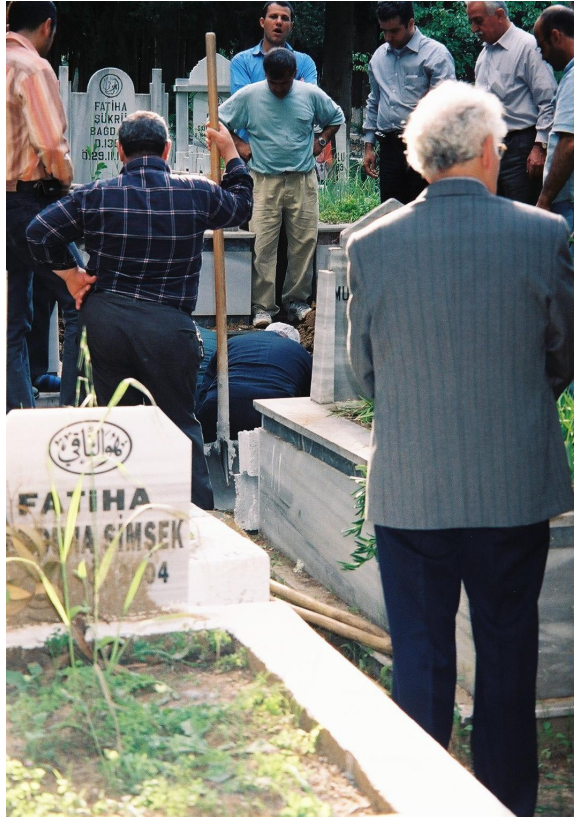
Resim 68. Arap Alevi Cenazesi ( Antakya )