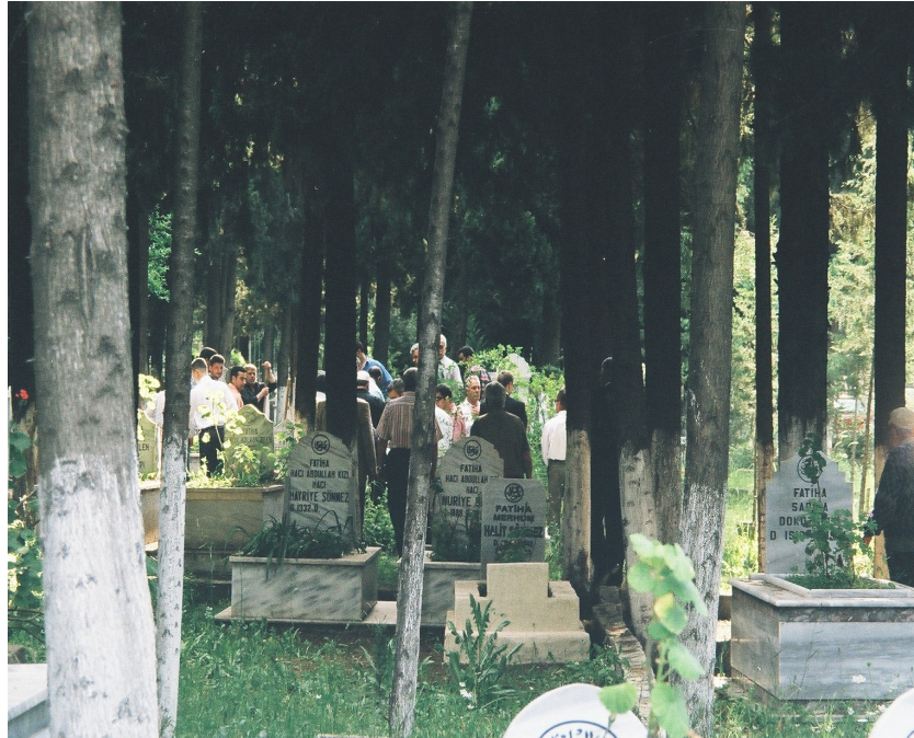
Resim 67. Cenazenin Gömülmeye Hazırlanışı (Arap Alevi Cenazesi / Antakya)