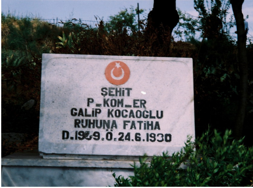
Resim 22. Bir şehit Mezarı ( Fatikli )