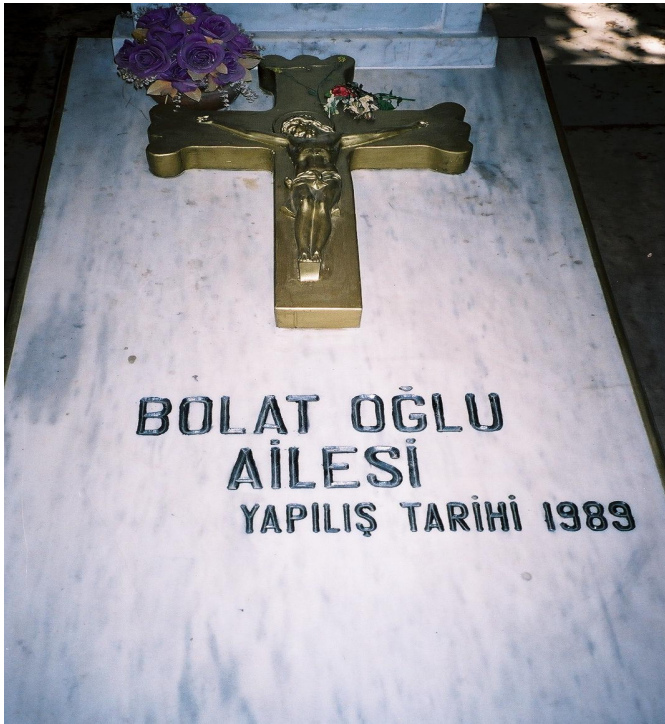
Resim 10. Üzeri Mermerle Kapatılmış Mezar Tipi ( Sarılar )