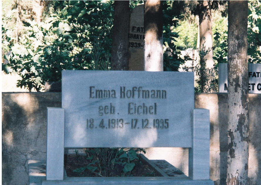
Resim 24. Bir Mezar Örneđi ( Reyhanlı )