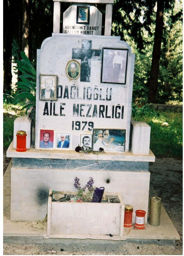
Resim 19. Üzerinde Ölenlerin Fotoğraflarının Olduğu Aile Mezarı Örneği (Sarılar)