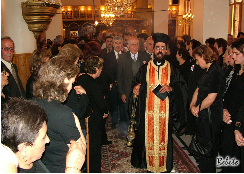
Resim 100. Cenazenin Define Götürülmesi