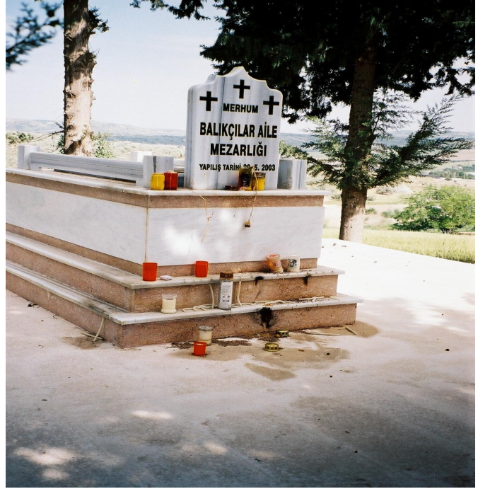
Resim 13. Mezarlara Bırakılan Mumlar ( Sarılar )