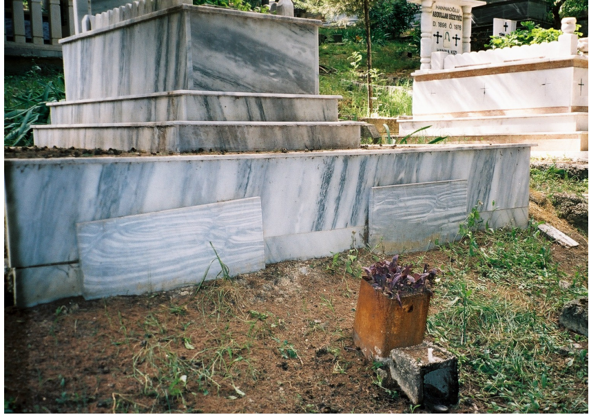
Resim 17. Girişi Toprak Altında Olan Çift Kapılı Hışğhaşı Örneği (Sarılar)