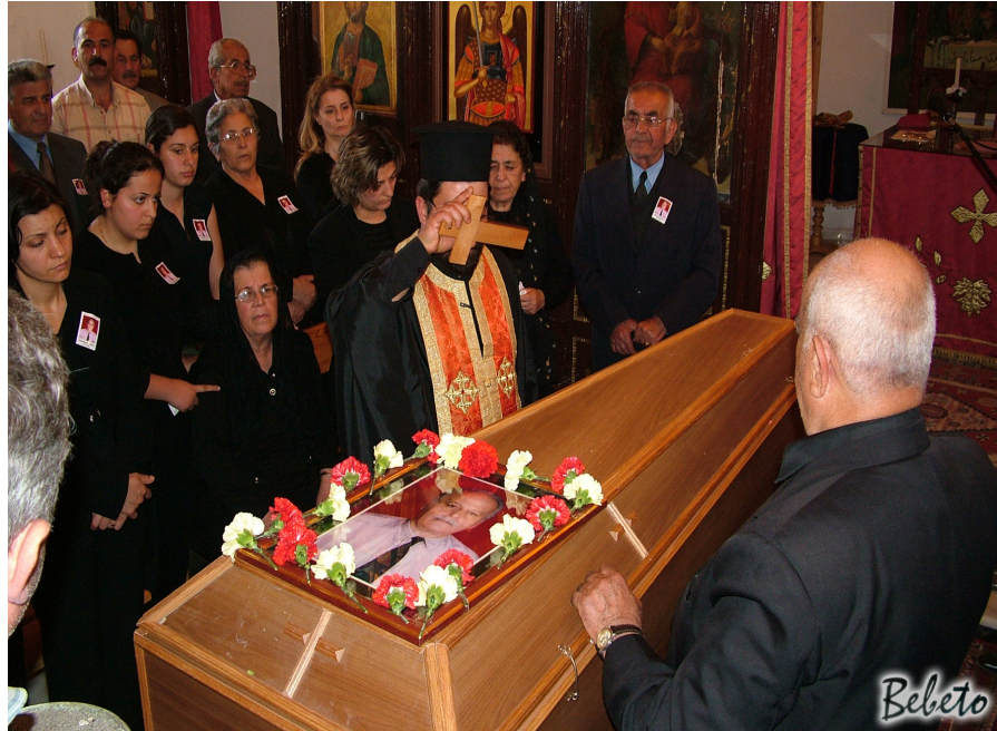
Resim 97. Haç Öpme