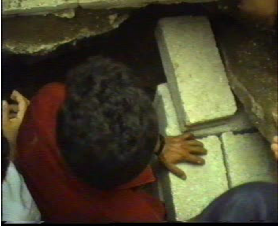
Resim 62. Mezarın Önünün Duvar Örülmektedir