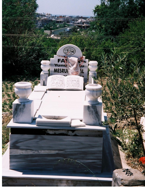
Resim 5. Dört Köşesinde Bahur'luk Bulunan Üzerinde Mermerden Kur'an-ı Kerim Olan Mezar ( Samandağ / Alevi )