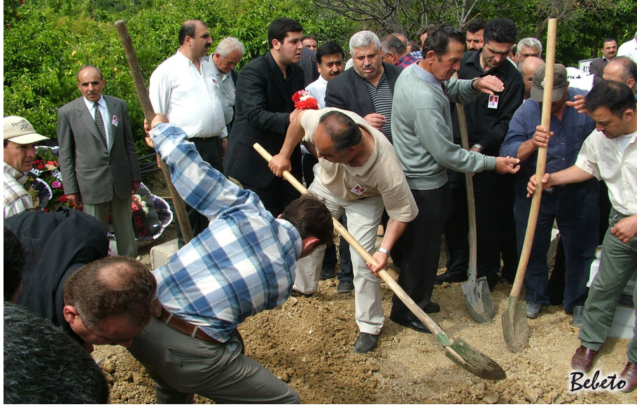
Resim 104. Tabutun Üzerine Toprak Atılması