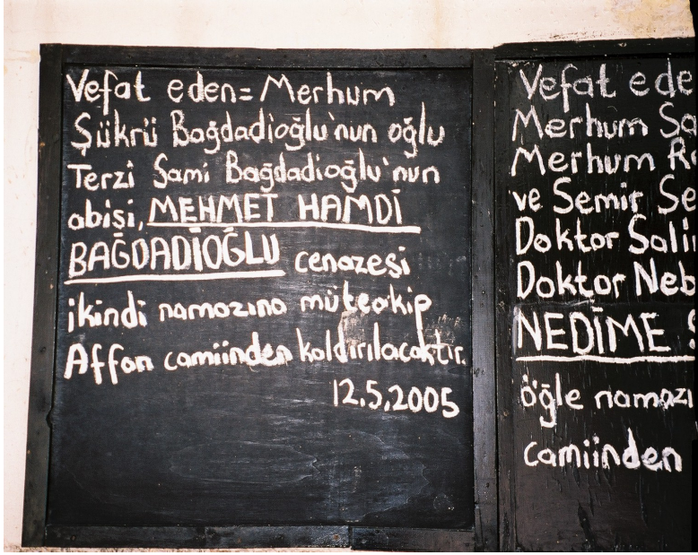
Resim 66. Affan Camiinde Cenazenin Duyurulması (Arap Alevi Cenazesi / Antakya)