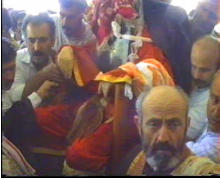
Resim 56. Papazın Taşınması ve Sandalyedeki Konumu