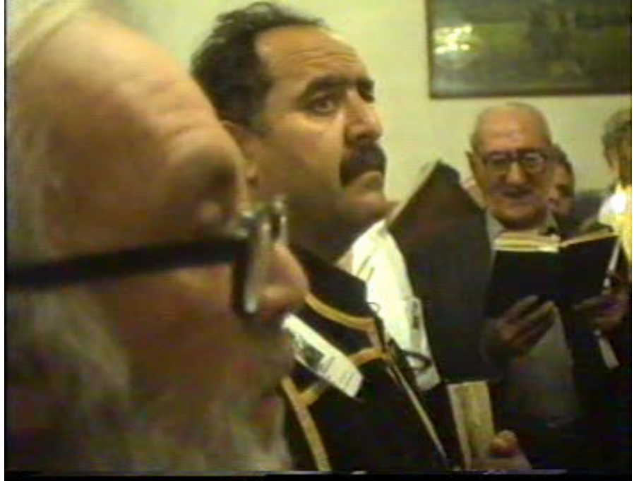
Resim 43. Törene Katılan Papazlar ( Altınözü )