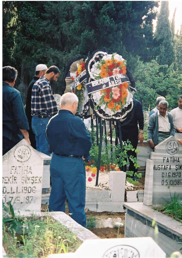
Resim 77. Cenazenin Son Duasının Okunuşu (Arap Alevi/Antakya)