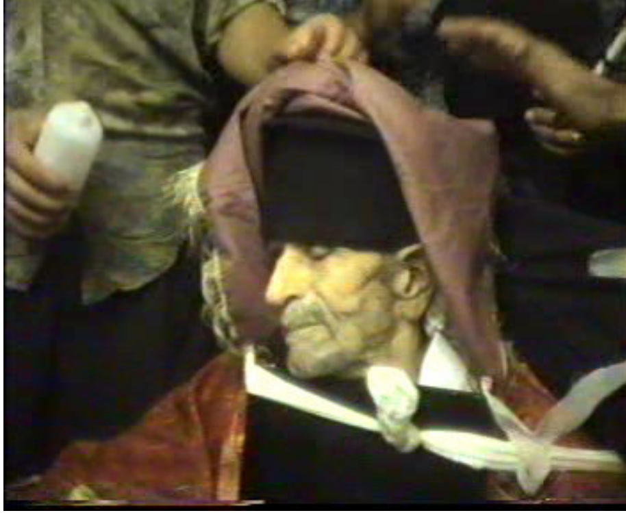
Resim 44. Papazın Sandalyeye Bağlanış Şekli ( Altınözü )