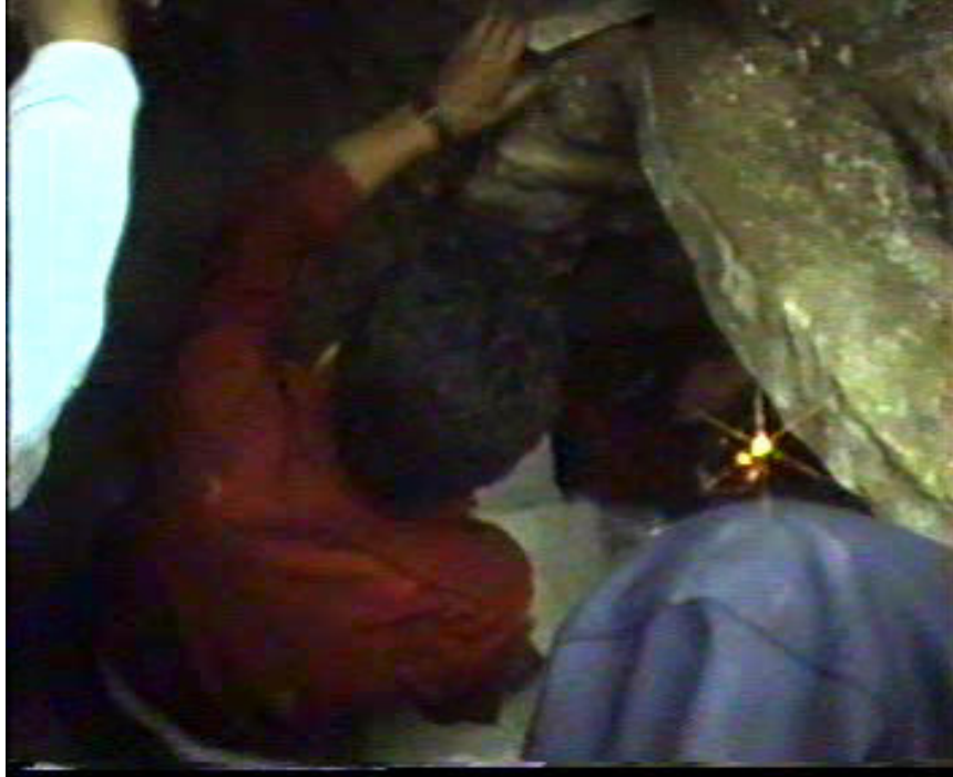
Resim 61. Mumların Yerleştirilmesi