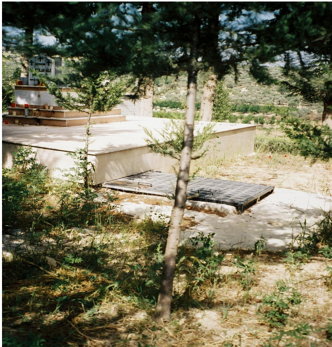
Resim 12. Kapağı Toprak Üzerinde Olan Bir Hışğhaşi Örneği (Sarılar)