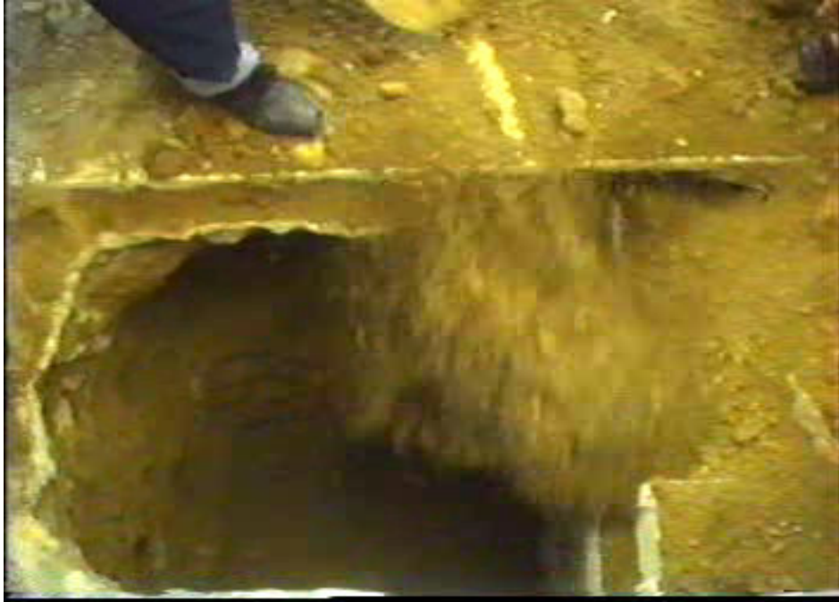
Resim 63. Mezarın Kapatılması