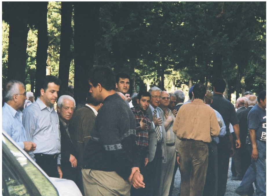
Resim 79. Cenaze Sahiplerinin Taziyeleeri Kabul Etmesi ve Selamlama (Arap Alevi/Antakya)