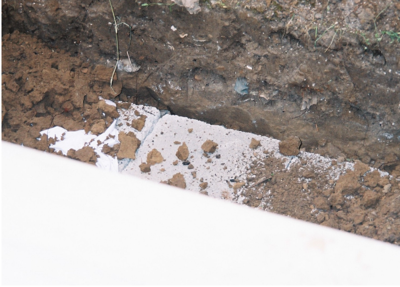
Resim 70. Cenazenin Üzerinin Kapatıldığı Taş Bloklar ( Arap Alevi /Antakya )