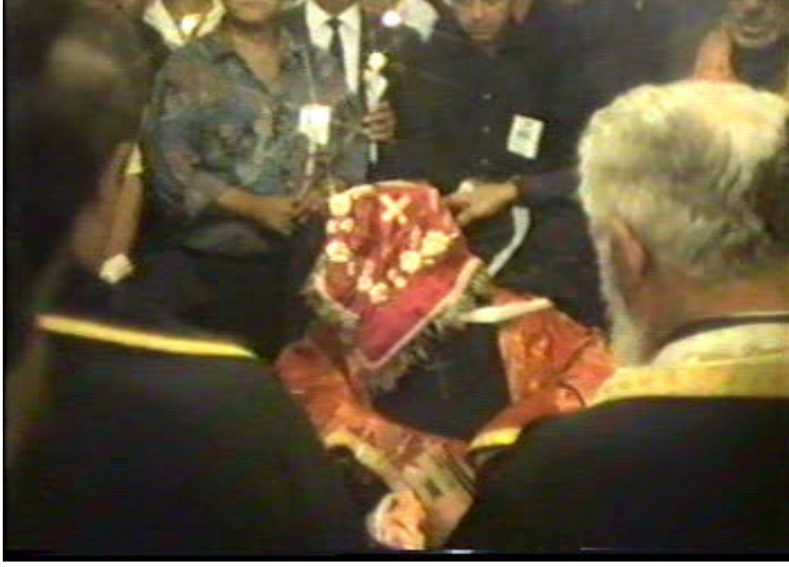
Resim 36. Kilisedeki Papaz Cenazesi ( Arap Hristiyan /Altınözü )