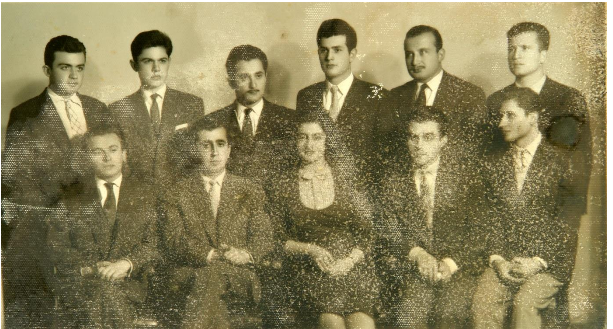
Siyasal Bilgiler Talebe Cemiyeti seçim sonrası başkanlığı döneminden (20 Nisan 1959)