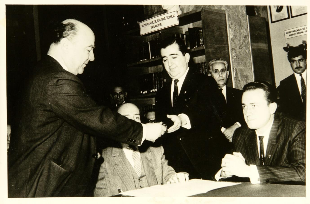
37. Dönem kaymakamlık kursunda İçişleri Bakanı Hıfzı Oğuz Bekata'dan ikincilik ödülünü alırken (31 Aralık 1962)