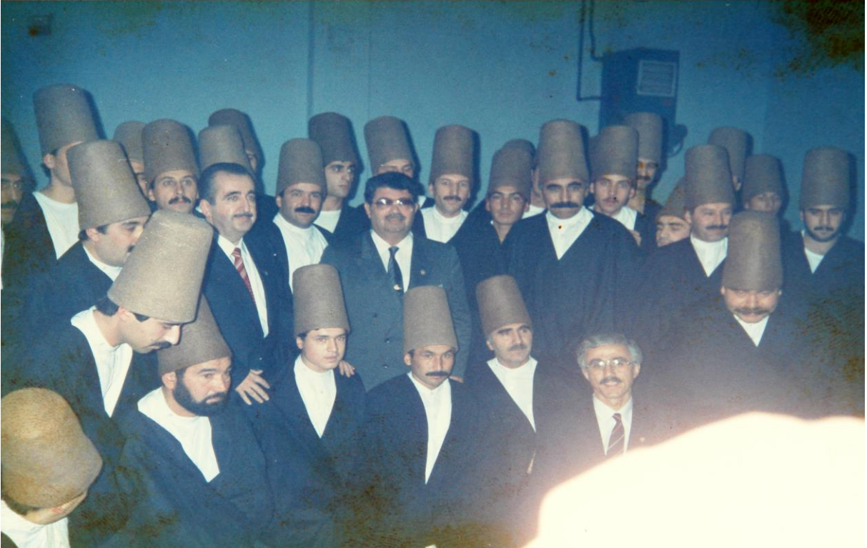
Konya Valiliği döneminde Turgut Özal ile birlikte Şeb-i Aruz gecesi