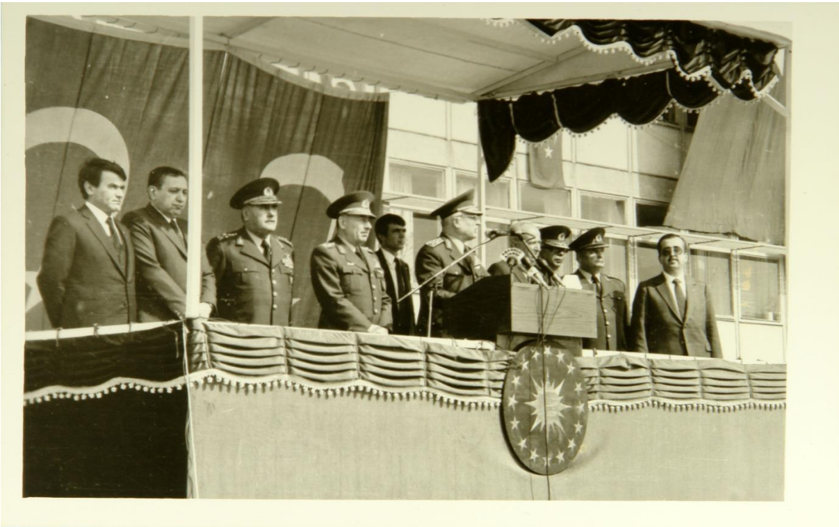
Kenan Evren ve konsey üyeleri ile Başbakan Bülent Ulusu'nun Adıyaman ziyareti (Mart 1983)