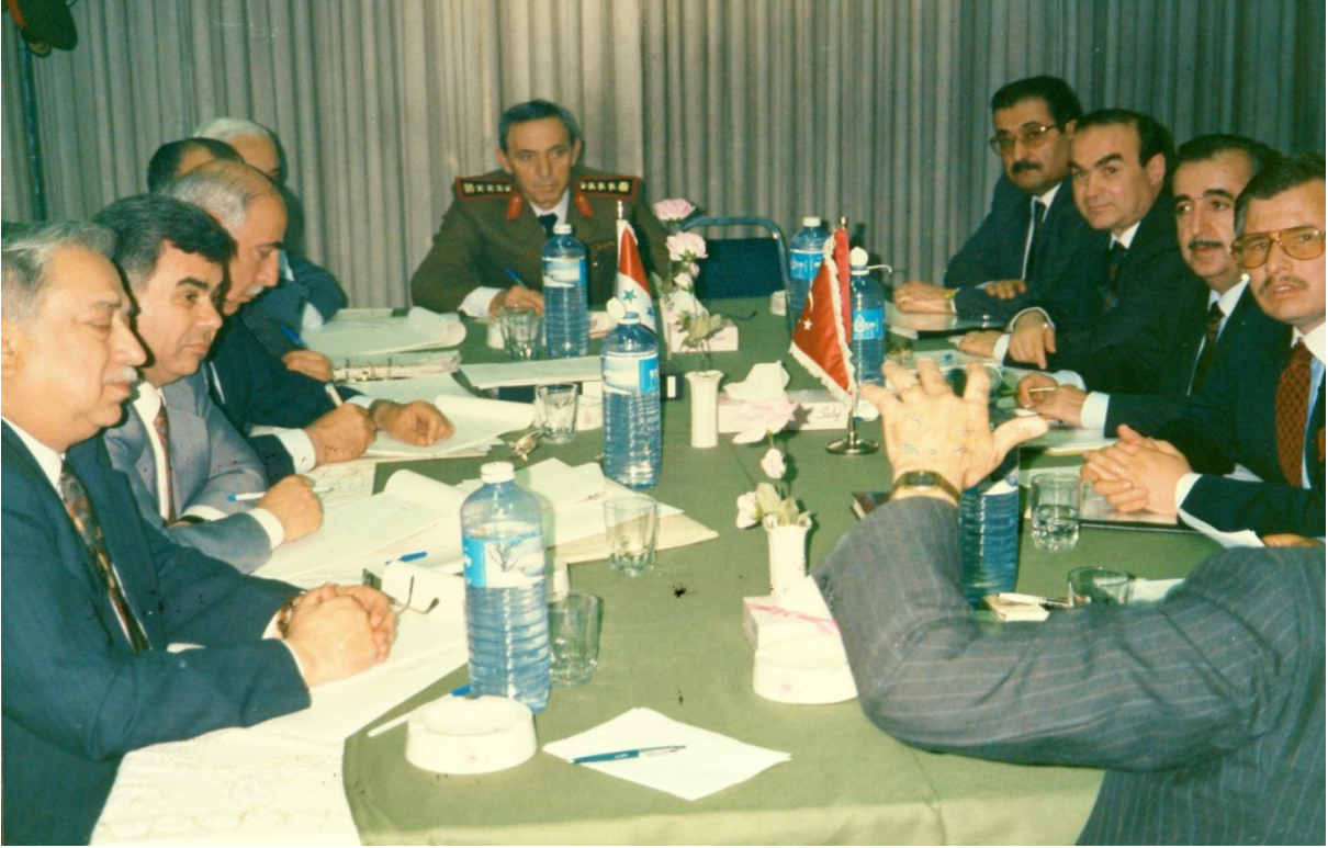
Suriye görüşmeleri alt komisyon toplantısı