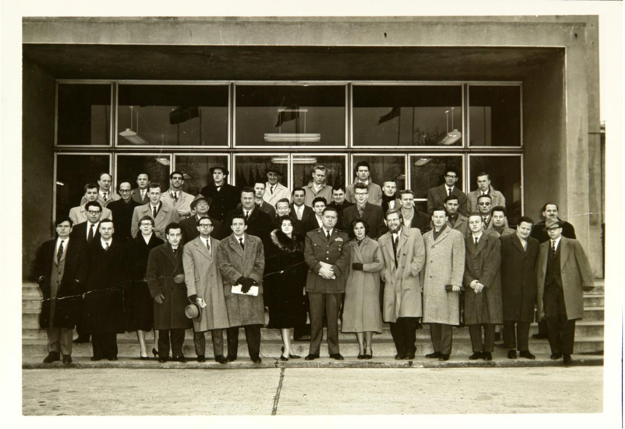
Nato Gençlik Liderleri Semineri (1 Aralık 1959)