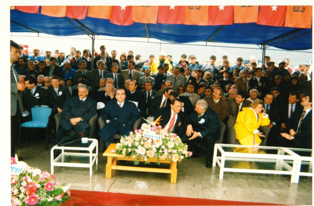
Dönemin başbakanı Mesut Yılmaz ile Payas Otoyolu açılışı (20 Nisan 1996)