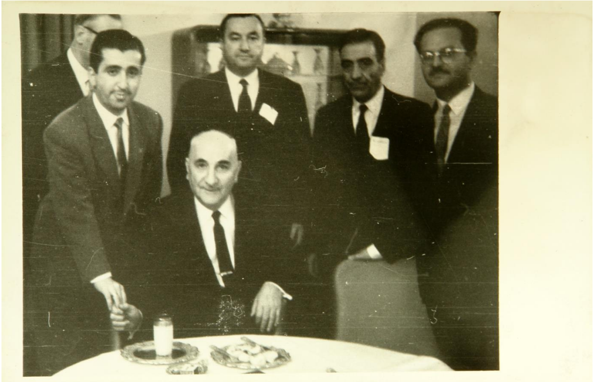
Utku Acun kaymakam adayı olduğu dönemde Bolu Türk Derneği Başkanı olarak Cumhurbaşkanı Cemal Gürsel ile Çankaya Köşkü'nde (Nisan 1961)