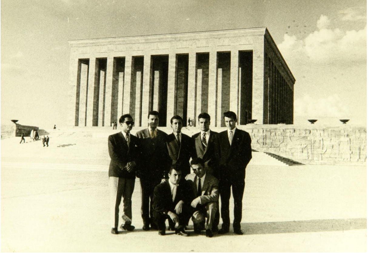
Siyasal Bilgiler Derbeği Heyeti 'nden bir grupta Anıtkabir ziyareti (21 Mayıs 1957)