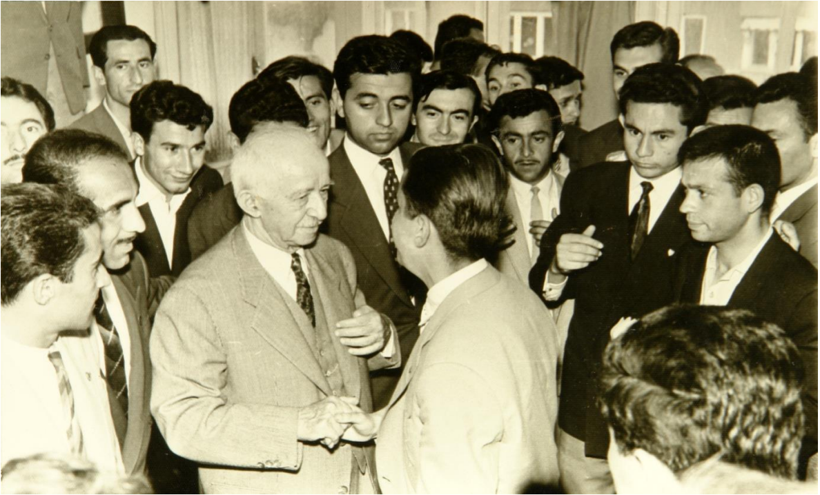
Utku Acun İsmet İnönü ile Siyasal Bilgiler Fakültesi Talebe Cemiyeti Başkanı olarak (27 Nisan 1960)