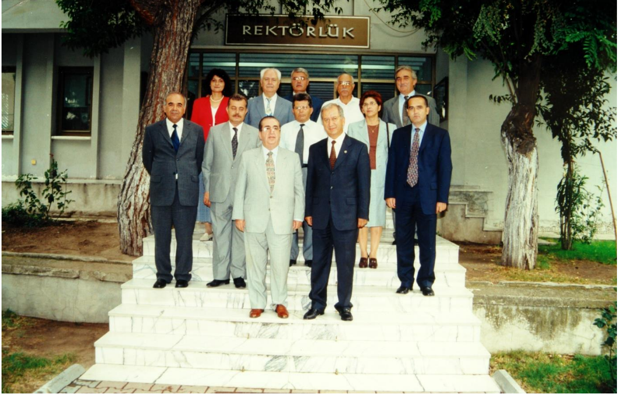
Mustafa Kemal Üniversitesi Rektörlüğü'ne iade-i ziyaret (12 Ekim 2000)