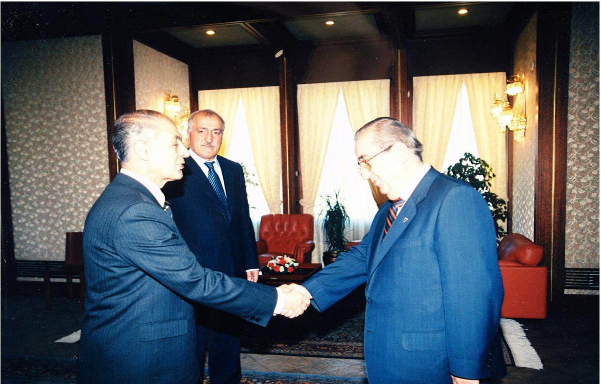
Balıkesir valisi olarak atanması münasebetiyle Utku Acun'un Cumhurbaşkanı Ahmet Necdet Sezer'i ziyareti (Ağustos 2000)