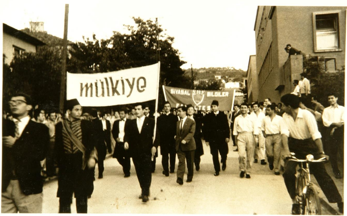
19 Mayıs Stadı'ndaki törene giderken (8 Haziran 1960)