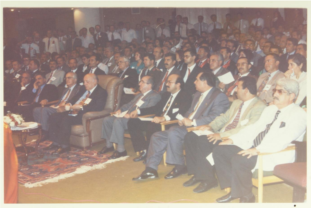
Hatay Mustafa Kemal Üniversitesi açılış töreni (7 Ekim 1994)