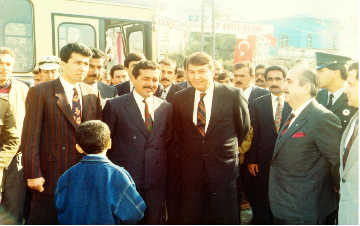
CHP Genel Başkanı Deniz Baykal ile Erzin ziyareti (1993)