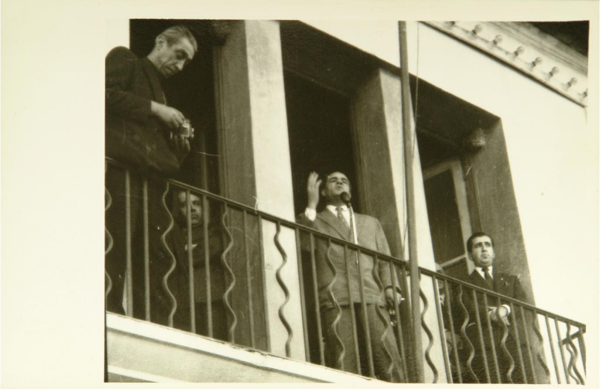
Ünlü Şair Behçet Kemal Çağlar ile Bolu'da (27 Mayıs 1961)