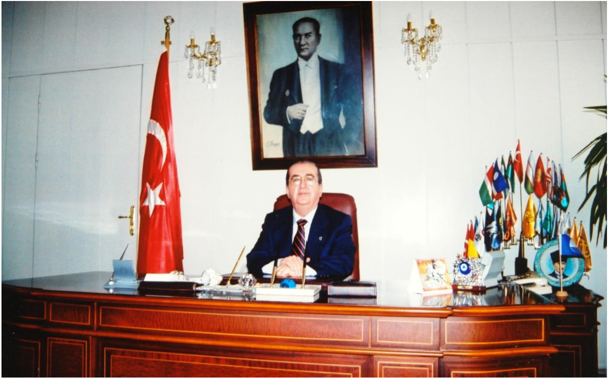
Hatay valiliği yıllarından (1996)