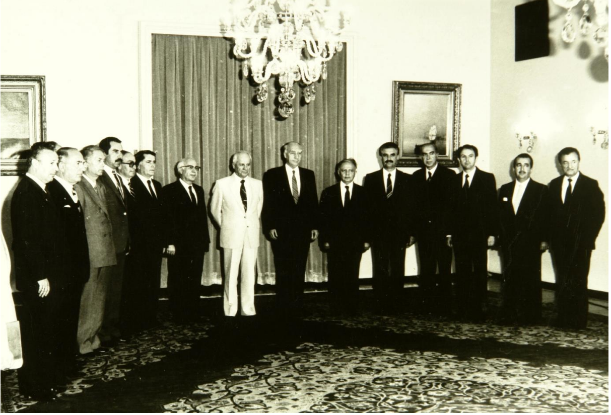
Ankara'da Cumhurbaşkanı Kenan Evren'le (Ağustos 1983)