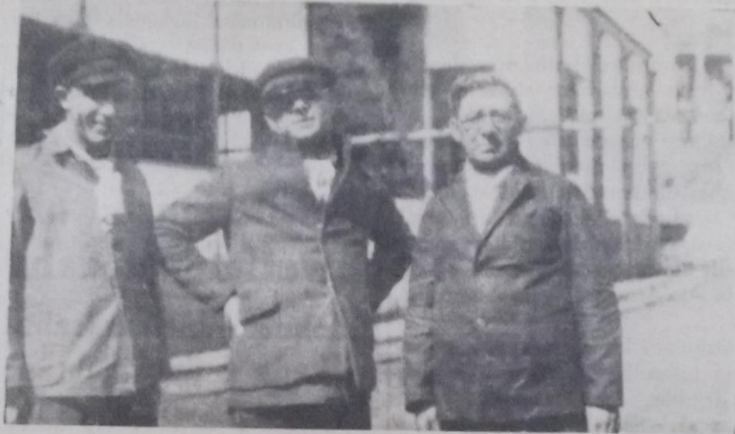
Vekillerin tetkik seyahatine aid bir hatıra: İktisad ve Maliye Vekillerimiz Zonguldakta maden kuyularını tetkikten sonra

Bu yüzden ihrac mallarımızın haftalarca mavnalar içinde beklediği oluyor