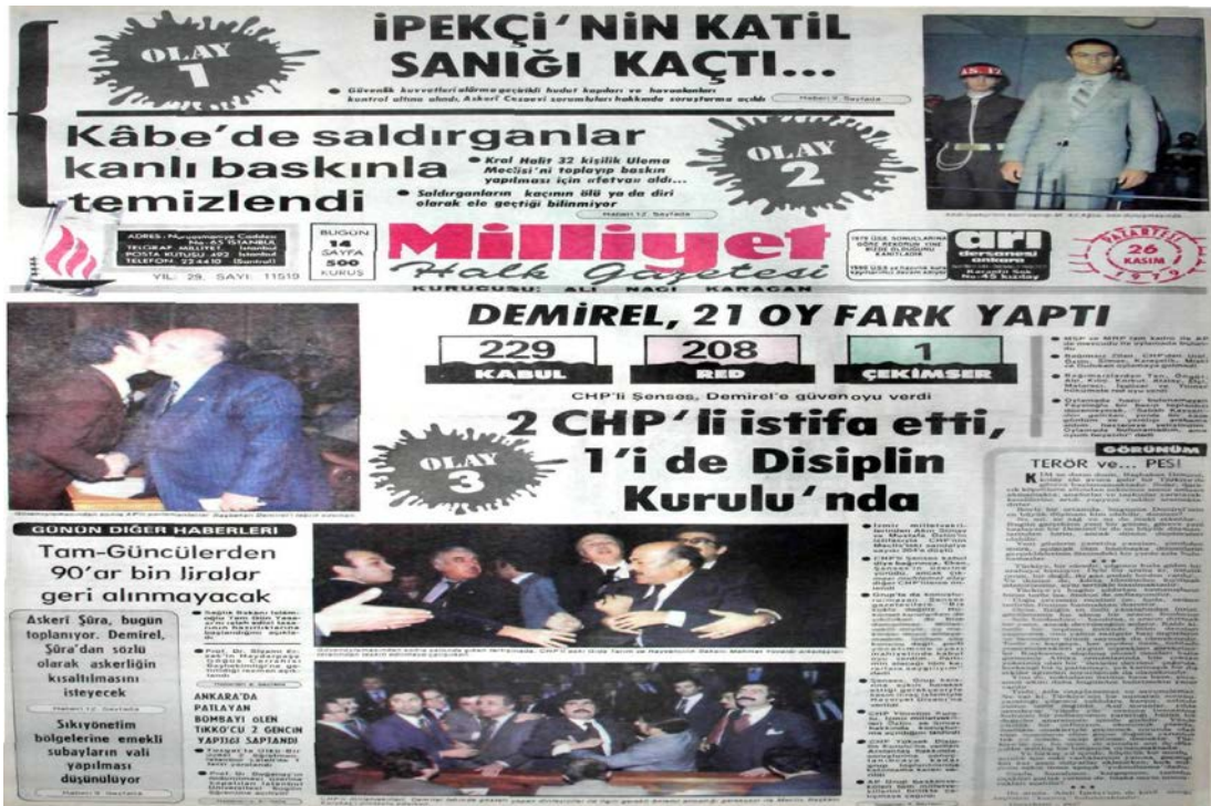
Ek 15 -Üçüncü Müdahale 12 Eylül 1980-