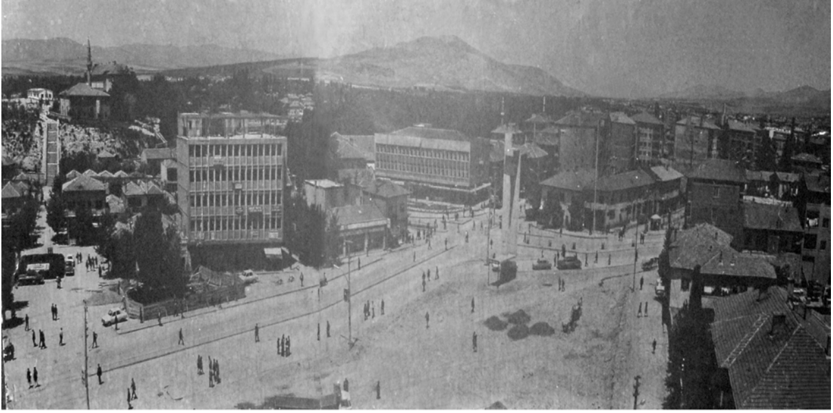
Ek 22-Kırşehir Eğitim Enstitüsü'nün yer aldığı ve 1980 Olaylarının birçoğunun yaşandığı o dönemin Terme Caddesi'nden bir fotoğraf.