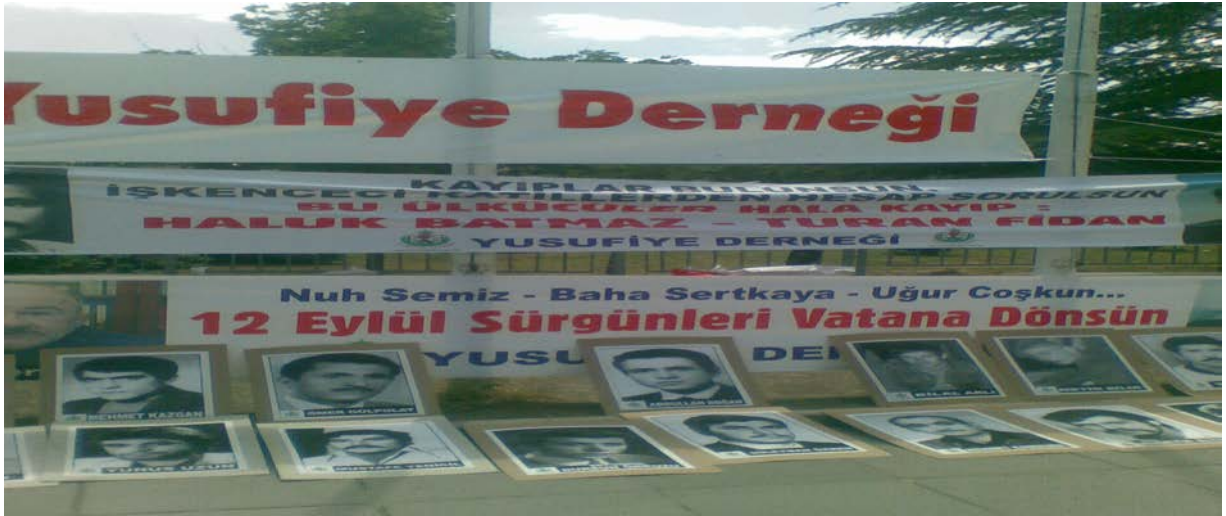
Ek 53-12 Eylül Duruşması, Adliye Sarayı Önü, Sıhhiye-Ankara,29.06.2012-