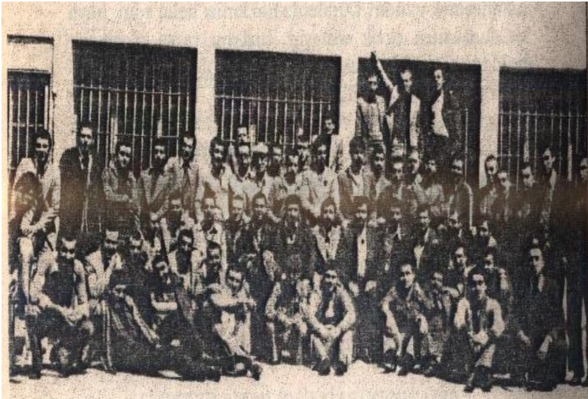
Koşuşu Paşakapı Cezaevi 1978