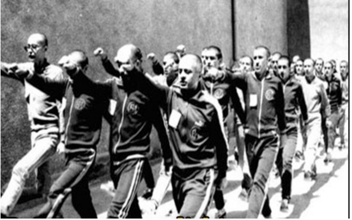
Ek 41 -Ulucanlar Cezaevi