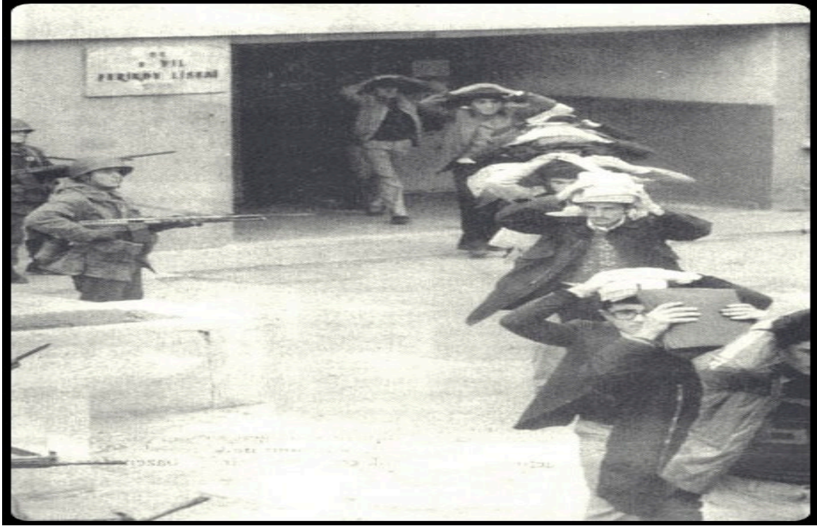
Ek 39 – Sağmalcılar (Bayrampaşa Cezaevi'nin Eski Adı) 13 Nisan 1978 f-2 101