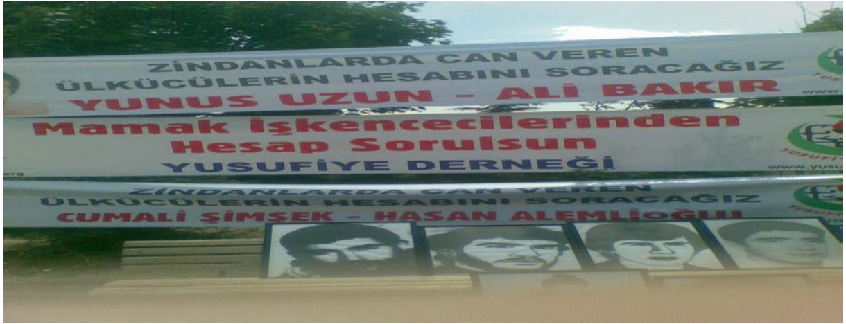
Ek 52-12 Eylül Duruşması, Adliye Sarayı Önü, Sıhhiye-Ankara,29.06.2012-