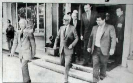
Başbakan Bülent Ulusu, Ankara Ordularlığı'nda, silahsız askerlerle birlikte konuşuyor. (Eğilimler) Başbakan Bülent Ulusu, saat 14.00'te Ordularlığı'na geldi. Başbakan ve Genelkurmay Başkanı...