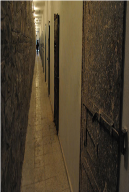
Ek 42 -Ulucanlar Cezaevi