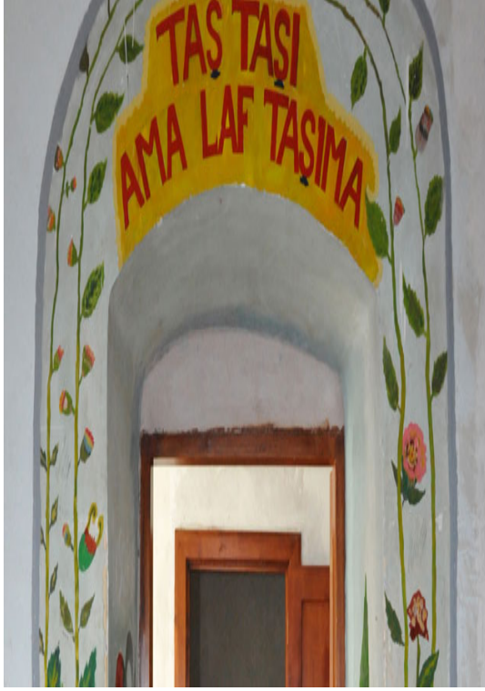
Ek 43 -Ulucanlar Cezaevi