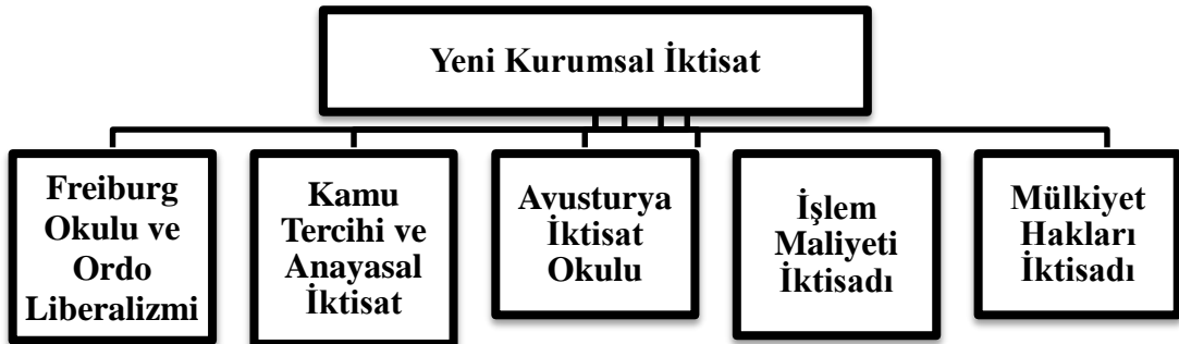
Şekil.3: Yeni Kurumsal İktisat Kapsamına Giren İktisat Okulları

Aktan ve Vural'a (2008: 182) göre ise Yeni Kurumsal İktisat kapsamına giren başlıca iktisat okulları şöyle sıralanabilir: