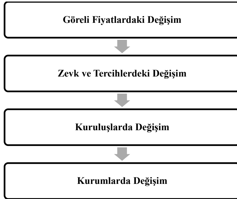
Şekil.1 Kurumsal Değişim

Günümüz kurumsal iktisatçılarından North'a göre ( 2010: 108-112) kurumsal değişimin kaynağı “ görelî fiyatlar ve tercihler ” dir. Bu bağlamda kurumsal değişimin öznesi konumunda kurumsal çerçevede var olan teşvik unsurlarına göre davranan bireysel girişimci yer almaktadır. Değişim süreci ise tedrici bir süreç olup zamana yayılmaktadır. North bu süreci “ Kurumlar değişir ve görelî fiyatlardaki temel değişimler, bu değişimin temel kaynağıdır. İktisatçı olmayanlar için (bazı iktisatçılar içinde) değişen görelî fiyatlara bu kadar ağırlık vermek anlaşılabilir. Ancak görelî fiyat değişimleri insan etkileşiminde bireylerin teşviklerini değiştirir, bu tür değişimin bir diğer kaynağı da zevklerdeki değişimlerdir ” biçiminde ifade eder. Bütün kurumsal değişimin gerisinde görelî fiyatlardaki değişimler yatmaktadır. Görelî fiyatlarda yaşanan değişimler aynı zamanda zevk ve tercihlerdeki değişimleri de etkileyecektir. Yani görelî fiyatlardaki değişimler zaman içinde insanların tüketim alışkanlıklarını, davranış biçimlerini ve rasyonalizasyon (tercih sebepleri) standartlarını değiştirecektir (North, 2010: 110). Bu bağlamda kurumsal değişim şöyle açıklanabilir: