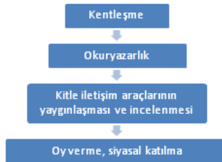
Tablo 4: Lerner'in Klasik Siyasal Katılma Modeli

Yukarıdaki tabloda görünen klasik siyasal katılmanın son dönem değişimlerle yetersiz kalmaktadır. Bu bağlamda aşağıdaki tabloda siyasal katılım sürecine eklenen unsurlar koyu renkte ifade edilmiştir. Katılımı kentleşme ile başlatmanın yanlış olacağı düşüncesi ile “Kentleşme”den önce “Toplumsal Yaşama Geçiş” eklenmiştir. Aynı şekilde “oy verme” ve “siyasal katılım” in yanına Siyasallaşma eklenmiştir. Son dönemde hızlı bir şekilde gelişen teknoloji ile birlikte ortaya çıkan yeni durum katılım sürecinde artık yeni bir kademe olarak ifade edilmesi gerekmektedir. Bu yüzden “Elektronik Katılım”, “Mobil Siyasallaşma” ve “Mobil Katılım” dan müteşekkil yeni bir kademe oluşturma yoluna gidilmiştir.