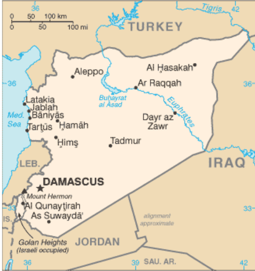
Şekil 2: Suriye Haritası 6