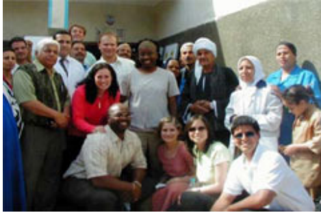
Minya'da aile planlaması kliniğini ziyaret eden bir grup USAİD çalışanı ve klinik çalışanları