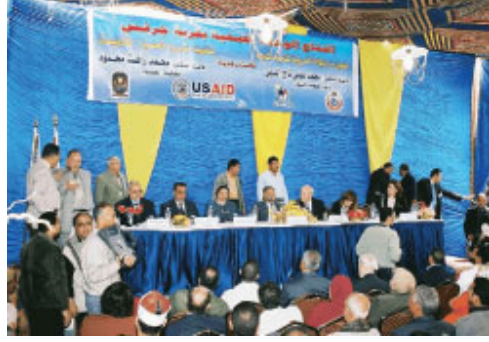
USAİD'in düzenlediđi halk sađliđi toplantısı