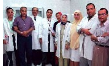
Aile planlaması kliniğinde çalışan doktorlar.