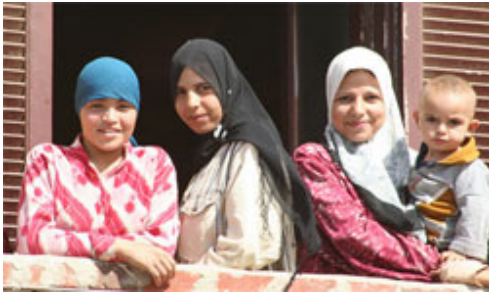
Mısır'da genç kadınlar