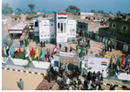
Minya kırsalında bir aile planlaması kliniđinin açılışı