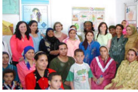
Bir aile planlaması kliniğinde kadınlar