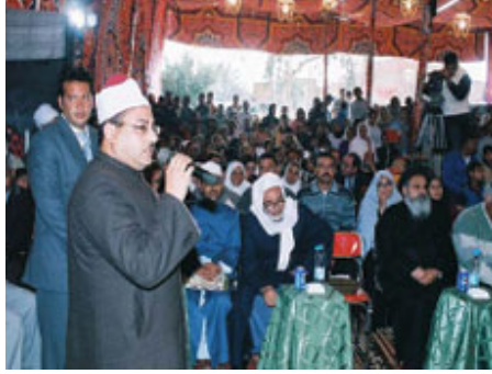
Beni Suef’de bir din lideri halka aile planlamasını anlatıyor.