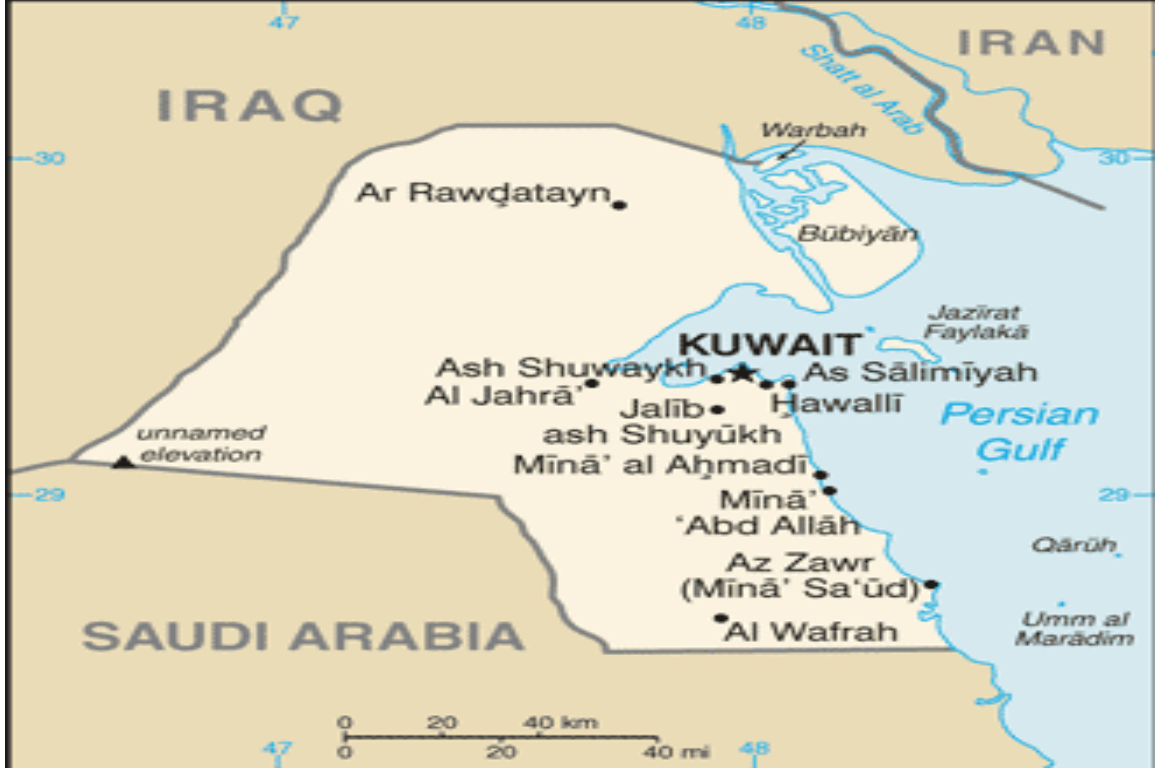
Harita 4 Kuweyt

Basra Körfezi'nin batısında bulunan Anayasal monarşi ile idare edilen Kuveyt, Basra Körfezi'nin kuzey kıyısında 3 milyon nüfuslu Körfez Ekonomik İşbirliği Konseyi üyelerinden biridir. Dünya petrol rezervlerinin yaklaşık % 9'una sahip olan Kuveyt'in ekonomisi de petrol üretimine ve petrole dayalı sanayi üzerine kurulmuştur. Bu açıdan bu bölümde Kuveyt'in tarihi gelişimi, ülkenin ekonomik yapısı, ardından sektörlere göre ülke ekonomisinin durumu ve dış ticareti incelenecektir. Ülkenin künyesi aşağıdaki gibidir. 76