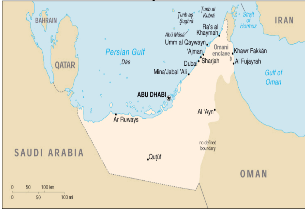
Harita 3 Birleşik Arap Emirlikleri

Ortadoğu’da Umman Körfezi ve Basra Körfezi kıyısında Umman ve Suudi Arabistan arasında yer alan ve yedi emirlikten oluşan Birleşik Arap Emirlikleri, Türkiye açısından önemli potansiyel barındıran ülkelerden biridir. Bu açıdan öncelikli olarak BAE’nin tarihi gelişimi, ülkenin ekonomik yapısı, ardından sektörlere göre ülke ekonomisinin durumu ve dış ticareti incelenecektir. Ülkenin künyesi aşağıdaki gibidir. 57