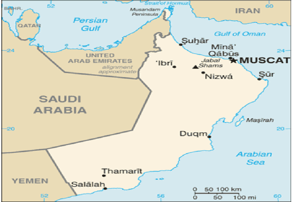
Harita 7 Umman

Türkiye'nin dış ticaret ilişkisinde olduğu diğer bir üye ülke de Umman'dır ve bu bölümde kısaca Umman hakkında genel bilgilere ve ekonomisine yer verilecektir.ülke künyesi aşağıdaki gibidir. 115