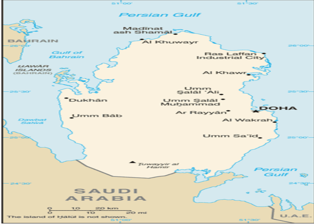
Harita 5 Katar

Bu kısımda Körfez Ekonomik İşbirliği Konseyi'nin bir diğer üyesi olan Katar'ın tarihi gelişimi, ekonomik yapısı, ardından sektörlere göre ülke ekonomisinin durumu ve dış ticareti incelenecektir. Ülkenin künyesi aşağıdaki gibidir. 93