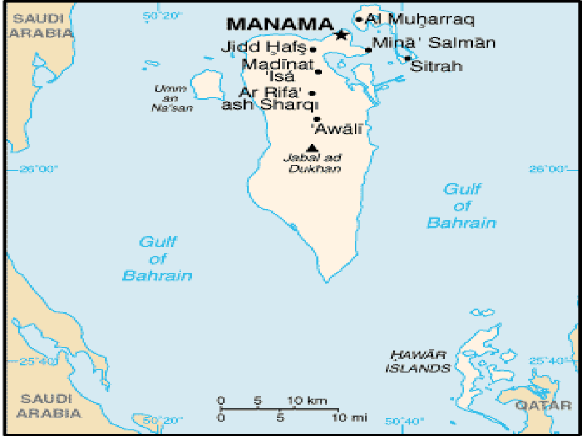
Harita 6 Bahreyn

Bir ada ülkesi olan Bahreyn modern yaşam tarzıyla diğer Körfez ülkelerinden ayrılmaktadır. Bu kısımda da Bahreyn'in tarihi gelişimi, ekonomik yapısı, ardından sektörlere göre ülke ekonomisinin potansiyeli ve dış ticareti incelenecektir. Ülkenin künyesi aşağıdaki gibidir. 101