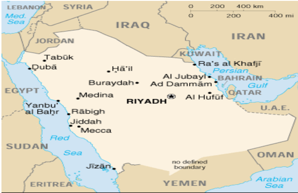
Harita 2 Suudi Arabistan

1930'lu yıllarda petrol bulunması ile birlikte bölgenin önemi artmış ve özellikle Petrol İhraç Eden Ülkeler Örgütü'nde ki rolü ile bölge ve dünya ekonomisinde belirleyici ülkelerden biri olmuştur. Bu kısımda öncelikli olarak Suudi Arabistan ile ilgili genel bilgileri; ardından ülkenin tarihi geçmişi, siyasi yapısı, ekonomik yapısı, beşeri özellikleri, tarım, hayvancılık, enerji sektörleri ve dış ticareti incelenmiştir. Ülkenin künyesi aşağıdaki gibidir. 36