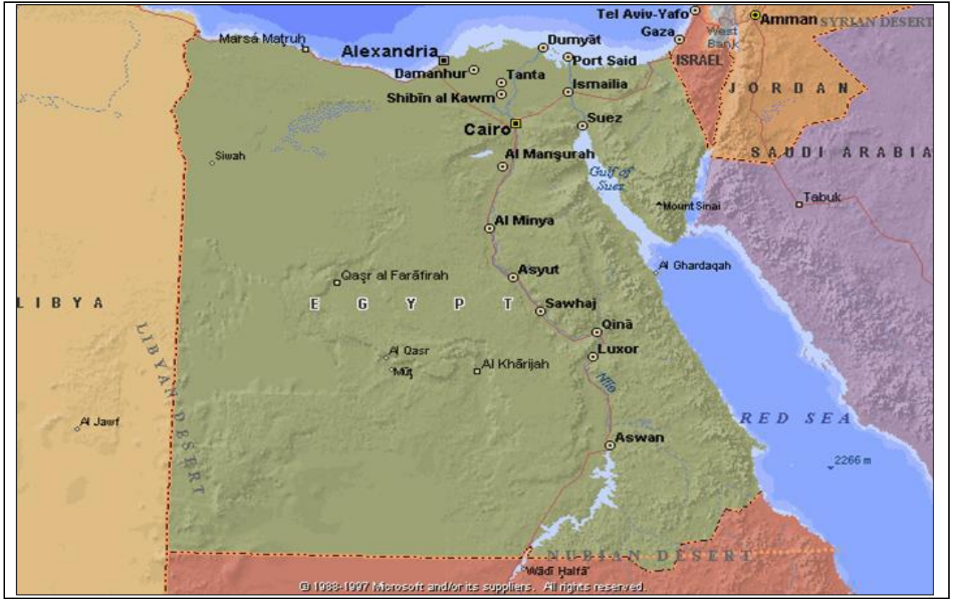
Şekil 1 Mısır Arap Cumhuriyeti

Kaynak: Daşdemir Cengiz, Mısır'ın Bölge Ülkeleri ve Türkiye'ye Yönelik Stratejik Yaklaşımı, Yayınlanmamış Yüksek Lisans Tezi, Gebze İleri teknoloji Enstitüsü, Sosyal Bilimler Enstitüsü, Gebze, 2006, s.65.