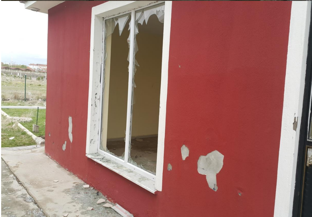
Şekil 4. Çay ilçesi harabe spor tesisleri