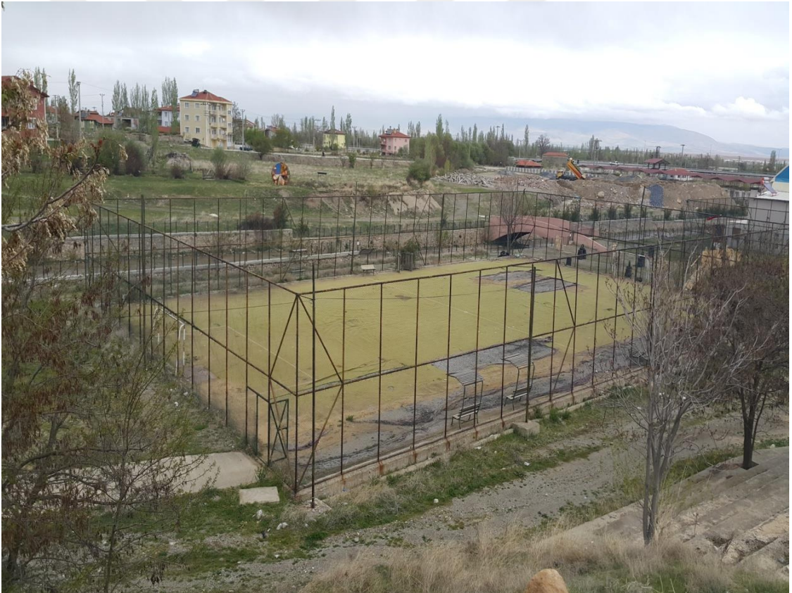
Şekil 5. Çay ilçesi harabe spor tesisleri