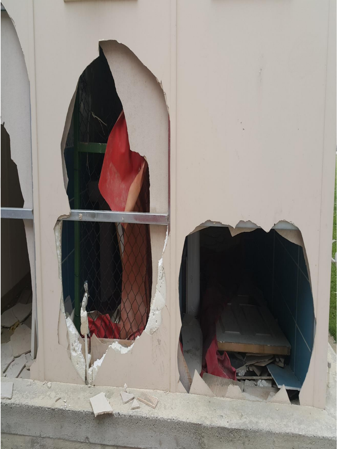
Şekil 2. Çay ilçesindeki harabe spor tesisleri