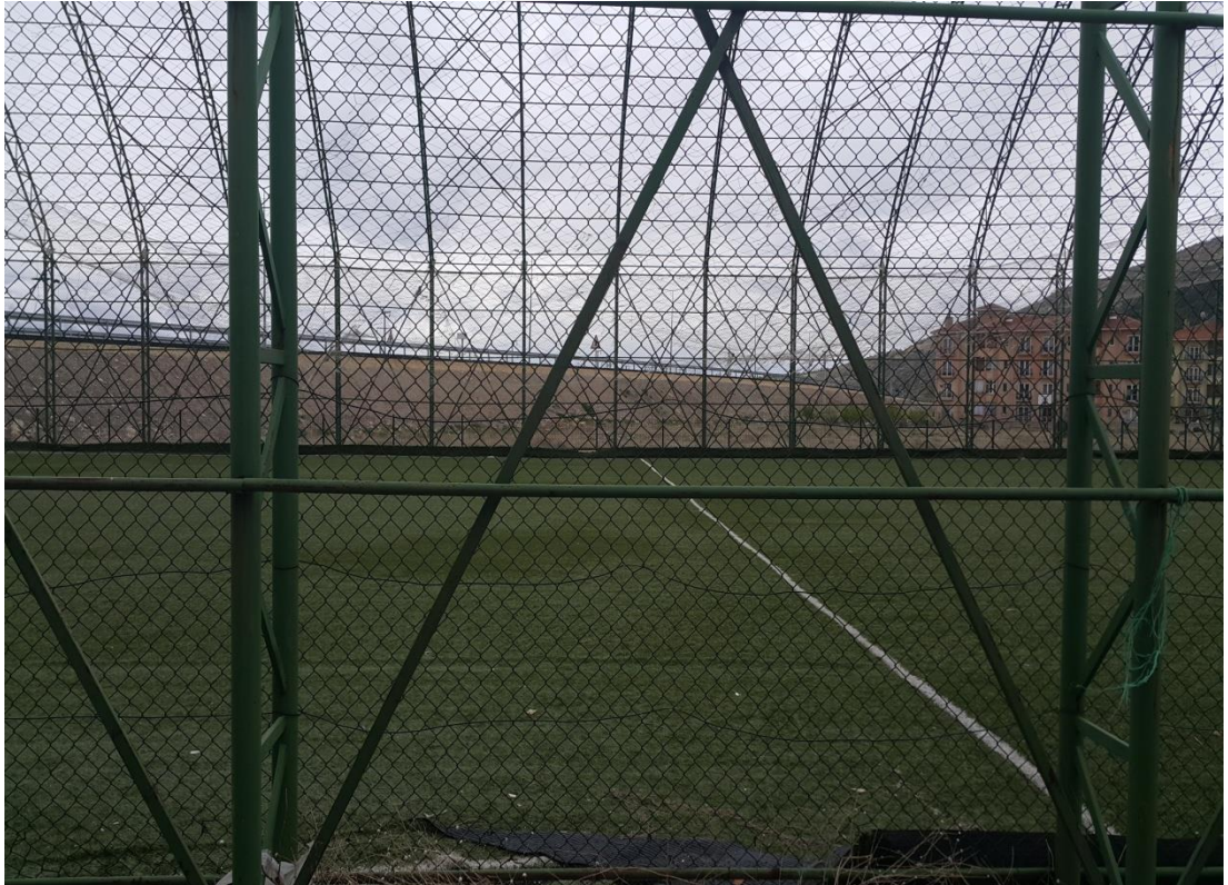
Şekil 3. Çay ilçesi harabe spor tesisleri