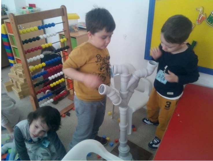
Şekil 1. Yardımlaşmak Mutlu Eder etkinliğine ilişkin fotoğraf

Uygulama aşaması: Uygulamanın 1. Günü güne başlama zamanı 'yardımlaşmanın önemi' sohbeti ile başlamış ve arkasından serbest oyun saatine geçilmiştir. Yaklaşık bir saat süren serbest oyun saatinde çocukların (daha çok reddedilen veya dışlanan sosyal konumunda olan) kendi aralarındaki iletişimleri ve davranışları öğretmen