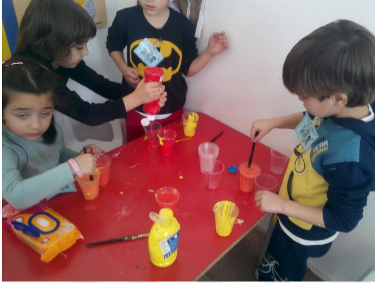
Şekil 3. Turuncu Tokalaşma etkinliğine ilişkin fotoğraf

Uygulama aşaması: ‘Turuncu tokalaşma’ etkinliği öncesinde çocuklarla ana ve ara renkler konusunda sohbet edilir. Öğretmen tarafından kırmızı ve sarı boyaları kullanarak bir oyun oynayacakları açıklanır. Çocuklar ve sınıf (ortaya bir çizgi çizilerek) iki gruba ayrılır. Bir gruptaki çocuklar sağ ellerine kırmızı diğer gruptaki çocuklar ise sarı parmak boyası ile boyarlar. Müzik eşliğinde herkes istediği arkadaşı ile tokalaşır. Ve eller incelenir. Çocuklar birbirlerinin ellerine bakarlar ve turuncu rengi görürler. Etkinlik çocukların istekleri doğrultusunda uygulanmaya devam eder. Sosyal konumu geliştirme programının uygulanmasına ilişkin dokuzuncu gün etkinlikleri aşağıdaki gibidir: