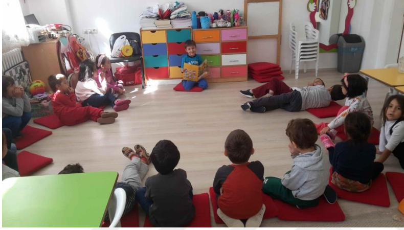
Şekil 2. Uyku Hikayem etkinliğine ilişkin fotoğraf

Uygulama Aşaması: Öğretmen hafta sonu tatilinden önce çocuklara iki gün aradan sonra ‘uyku hikayem’ adlı etkinliği yapacaklarını ve bunun için tatilde hazırlık yapmaları gerektiğini çocuklara anlatır. Evde ebeveynlerinin onlara okuduğu bir hikayeyi sınıfta arkadaşları ile paylaşacaklarını ve hikayelerini kendilerinin anlatması gerektiği konusunda öğretmen açıklar. Etkinlik gününde çocuklar hikaye saati için minderlerini alarak yarım daire şeklinde otururlar. Çocuklardan (dışlanan veya reddedilen sosyal konumuna sahip) bir tanesi hikayesini anlatması için seçilir. Seçilen çocuk hikayesini anlatır. Hikaye hakkında arkadaşlarına sorular sorar ve onların sorularını cevaplar. Diğer çocuklar da sıra ile hikayelerini anlatırlar. Bu biraz zaman alıcı bir etkinlik olduğu için etkinlik dört günlük bir sürece yayılarak öğretmenin rutin etkinlikleri arasına alınır. Sosyal konumu geliştirme programının uygulanmasına ilişkin yedinci gün etkinlikleri aşağıdaki gibidir: