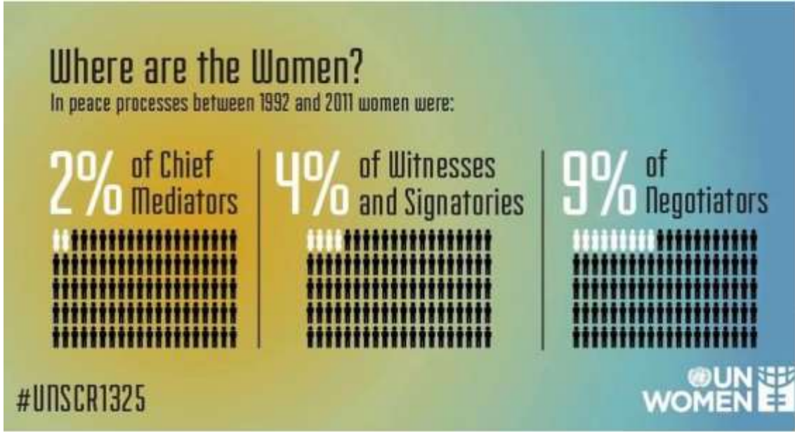
Resim 1.4: Barış Süreci 335

“Araştırmalar gösteriyor ki, kadınlar barış anlaşmalarına katıldıklarında barış daha uzun sürmektedir. Peki barış sürecine daha fazla kadın katmak için ne bekliyoruz? 1992 ve 2011 yılları arasındaki barış süreçlerinde: Baş arabulucuların %2’si, tanıklar ve imzalayanların %4’ü ve arabulucuların %9’u kadındı.”