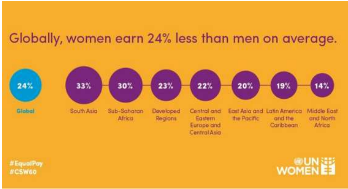
Resim 1.3: Eşit Ödeme 309

“Dünyanın hemen hemen her yerinde, kadınlar erkeklerden daha az maaş almaktadır. Dünya çapında ortalama olarak kadınlar %24 daha az kazanmaktadır. Kadınlar Güney Asya’da %33, Sahra Altı Afrika’da %30, Gelişmiş Bölgeler’de %23, Orta ve Doğu Avrupa’da ve Orta Asya’da %22, Doğu Asya ve Pasifik’te %20, Latin Amerika ve Karayipler’de %19, Orta Doğu ve Kuzey Afrika’da %14 oranında daha az kazanmaktadır.”