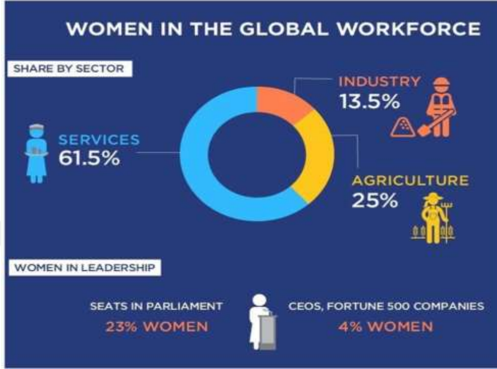
Resim 1.2: Küresel İş Gücünde Kadınlar 294