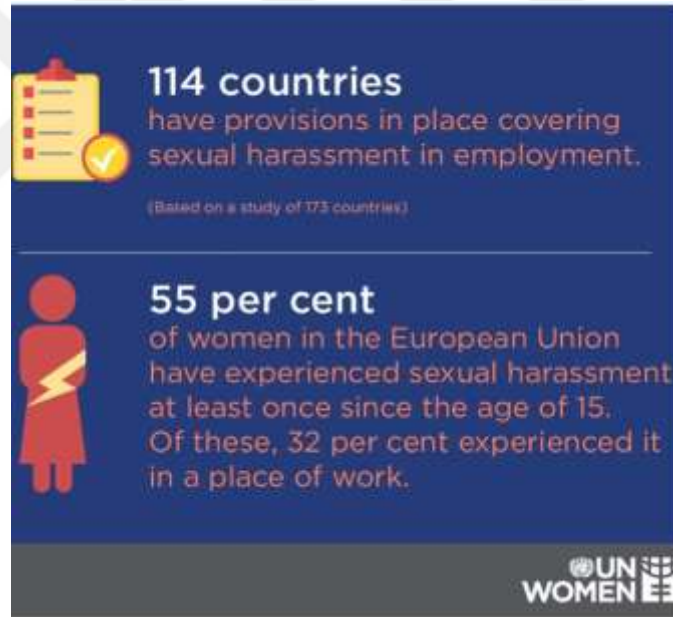
Resim 1.1: Dünya İş Sağlığı ve Güvenliği Günü 272

“27 Nisan, İş Dünyası Güvenlik ve Sağlık Günü’dür. İşyerindeki cinsel taciz, kadınların güvenliği için büyük bir tehdit oluşturmaktadır. Ancak sadece 114 ülkede cinsel tacize karşı yasal bir koruma vardır. Tüm ülkelerde iyi yasalara ihtiyacımız var. Kadınları korumak için yasaların etkili bir şekilde uygulamaya konulmasını sağlamalıyız. AB’deki kadınların %55’i 15 yaşından itibaren hayatlarında en az bir defa cinsel tacize uğramaktadır. Bunların %32’si de bu tacizi iş yerinde yaşamaktadır.”