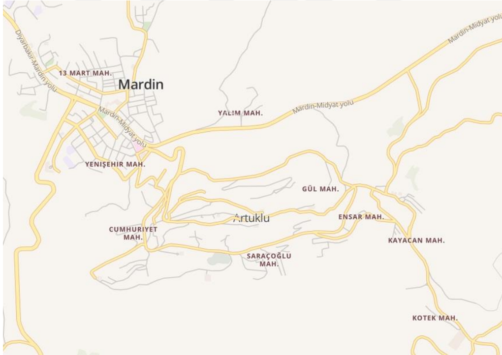
Şekil 1: Mardin’in Genel Haritası ve Bahsi Geçen Mahallelerin Konumları

Mardin’de genel imgesel görüşlerden yoksun, Mardin kalesinden Mezopotamya ovasına doğru uzanan kısımdaki kenar mahallelerden biri olan Kayacan Mahallesi, Eski Mardin dışına taşan, düzenli bir yapılaşmayı barındıran, Mardinliler için zamanında zengin insanların ikamet edebileceği, hatta söylemsel olarak çoğu insanın dilinde 80’li yıllarda " Mardin'in Dallas'ı " 13 olarak tanımlanan mahalledir. Kayacan Mahallesi, her ne kadar zamanında buraya yerleşen Arap ileri gelenlerin yeni şehre taşınmalarıyla Kürtlerin sayısının artış gösterdiği bir mahalle olsa da, zamanında burada ikamet edenlerin, polislerin ve askerlerin yerleştiği mahalle olma dolayısıyla bir gecekondu mahallesi olarak düşünülmemektedir. Diğer mahallelerden Ensar, Evren, Gül, Cumhuriyet ve Saraçoğlu mahallesi sakinleri, uzun bir zamandan süregelen Türkiye’de "Kürt sorunu" olarak konuşulan bir durumun değişik sorunsallarıyla karşılaşan insanların çoğunluğundan meydana gelmektedir (Şekil 1).