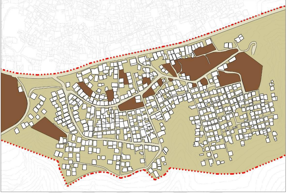
Şekil 4: Saraçoğlu Mahallesindeki Mezarlıkların Haritada Gösterimi

Mezarlıklar üzerine kurulan mahallede, mezarlıklar konutların dışında çitlerle, korkuluklarla ayrılmış mekânlar değildir. (Şekil 3) Mezarlıklar diğer mahallelerdeki insanlarla ilişki kurdukları, etkileştikleri mekânlara dönüşmüştür. Bunun nedeni ise sadece mezar sahiplerinin tanıdık ve akrabalarının mezarı ziyaret etmek için mahalleye gelmeleri değildir. Mahalledeki mezarlıklar yaşamlarıyla iç içe geçmiştir. (Fotoğraf 12) Çoğunun evinin yanında, bahçesinin içinde olan mezarlar, ziyaret edileceği zaman, ziyaret edecek kişiler tarafından ev sahiplerinin aranması ve müsaitlik durumlarının sorulması ile tanışma, görüşme, diyalog kurma imkanlarını yaratır. Mekânlar insanlar tarafından kendi anlamları dışında yeniden anlamlandırılıp üretilirler. Bu üretim, mahalledeki mezarlıklarda olduğu gibi insanlar arasındaki ilişkileri de şekillendirmektedir.