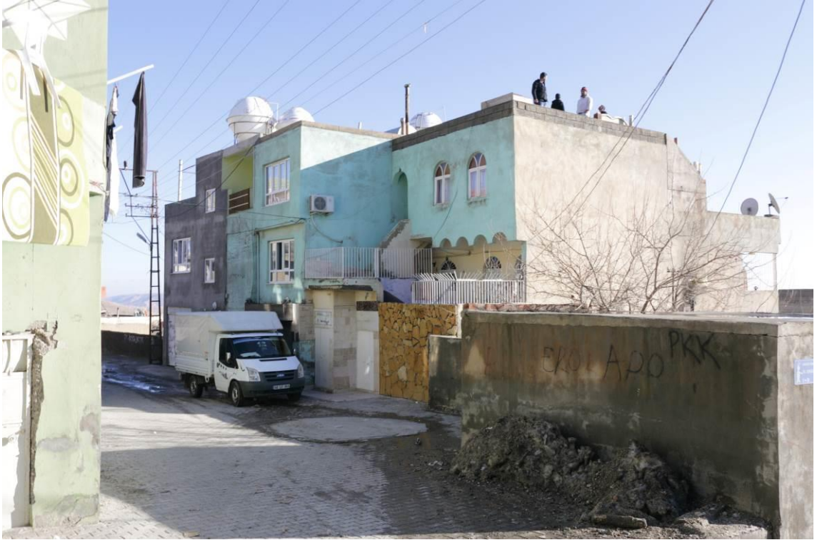
Fotoğraf 15: Taş ve Betonarmenin Bir arada Kullanımı