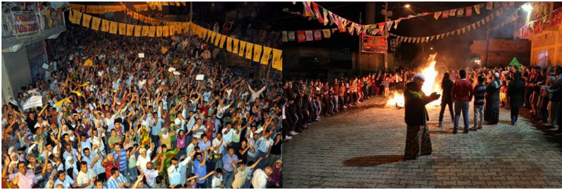
Fotoğraf 4: Mobese Kamerasının Bulunduğu Sokakta Yapılan Eylem ve Mitingler

kaçamak gizli biçimlerini toprağın altından çekip çıkarmaktır. 79 Toplumsal denetim mekanizması, toplumsal pratikleri sınırlamak yerine onlara yeni mekânlar yaratır. Mekân, bir çekişme alanıdır, politiktir; çünkü toplumdaki eşitsiz güç ilişkilerinin bir aracı ve örtülü bir ifadesi, çelişkilerin normalleştirilip sıradanlaştırıldığı, gündelik yaşamın içinde eritildiği alandır. Sokak, gözetlenmesine rağmen kullanıma devam etmekte ve başka argümanları üretmektedir. Bu argümanlar yeni bir merkez ve iktidar odağı yaratmaya da dönüşebilir. Çünkü özellikle politik olayların vuku bulduğu gergin zamanlarda yapılan eylemlerle sokak, hem bir direniş hem de kendi erkini ispatlama mekânına dönüşebilir.