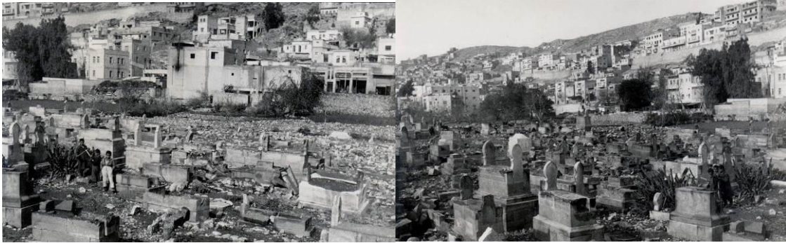
Fotoğraf 1: Saraçoğlu Mahallesinin Eski Fotoğrafları (Fotoğraflarda görüldüğü gibi büyük bir kısım mezarlıklardan oluşmakta, arka kısmında ise "Eski Mardin" in tarihi, taş yapıları görülmektedir.)

Mekânların toplumsal özellikleri ve bu mekânları paylaşan bireylerin kimliksel özellikleri, mekânların nasıl tanımlandığını belirleyen en önemli unsurlardır. Saraçoğlu mahallesi Kürtlerin Mardin merkeze (Mardin'in Büyükşehir olmasından sonra merkez bölge ismi Artuklu olarak değiştirildi) ilk olarak taşındıkları mekândır. "Eski Mardin" in güney eteklerinde bulunan, Yeni yol caddesiyle "Eski Mardin" den ayrılan ve öncesinde Süryani ve Ermenilerin mezarlarının bulunduğu mahalleye (fotoğraf 1), büyük bir çoğunluğu Müslüman olan nüfus yerleşmiştir. 14