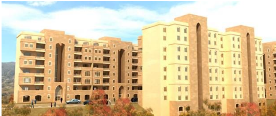
Fotoğraf 2:Gazete kaynaklarında yayımlanan, Mardin'de kentsel dönüşüm sonucunda yapılması düşünülen TOKİ konutları

Mardin'de tarihi yerleşimin altında yer alan Saraçoğlu Mahallesi bir yandan da ekonomik çıkarlar doğrultusunda yıkıma uğratılmakta. Çünkü turizm kentine dönüştürülecek bir kent olan Mardin kentini kurgulamak, düzenlemek belli kesimlerin himayesinde gerçekleşmekte. Devlet ve siyaset sistemine bakıldığında, kapitalizmin siyaseti, artı sermayenin üretilmesi ve soğrulması için sürekli karlı sahalar bulma ihtiyacı tarafından belirlenmektedir. İktidar kentin her alanından sürekli bir kar amacı gütmek üzere çeşitli denetimler, düzenlemeler ve uygulamalar sistematize etmektedir. 39 Mardin Valisi Turhan Ayaz, Kudüs ve Venedik'ten sonra dünyanın üçüncü sit alanı olan Mardin'in taş yapılarına yeniden kavuşturulması gerekliliğini dillendirmiştir (Fotoğraf 2). 40 Saraçoğlu mahallesi, tarihi silüetle uyuşmayan sağlıksız, çarpık ve güvensiz yapılar olarak tanımlanarak dönüşüm gerekçeleri üretilip pazarlanmaktadır. Smith'e 41 göre kent merkezlerinde asıl şekillendirici olan artan arazi değerleri ile eskiyen konutların düşen değerleri arasındaki rant aralığıdır. Kentsel dönüşüm projeleri bu rant aralığının kazanım esaslarını hazırlamakta, önerilen dönüşüm modelleri de aslında kimin ne kadar rant alacağına sınırlarını çizmektedir.