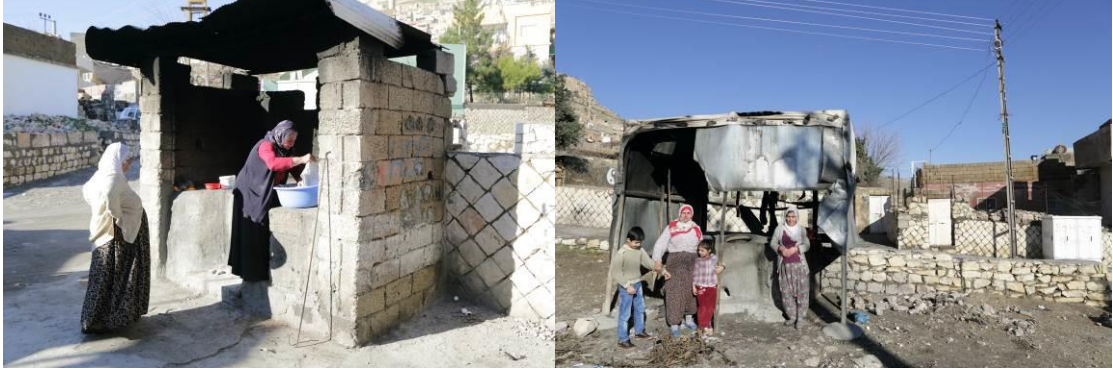
Fotoğraf 10: Sokak kenarlarındaki Tandır