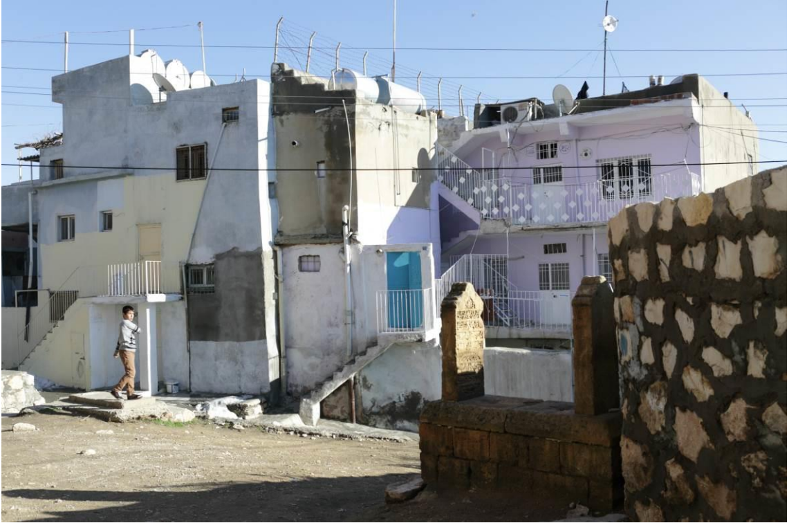
Fotoğraf 12: Mahalledeki Mezarlar ve Yaşam alanlarının iç içe olması

Bahçelerin ve mezarlıkların iç içe geçme durumu bir tür bir arada oluşur. Fakat bu oluş bir temsilden ya da optik bir artefaktan (yapay etki) farklı bir şeydir. Bu şekil bir kent plancısının ya da bir haritacının, bir tür mesafeleme projeksiyonu ile ürettikleri bir şey değil, hiyerarşik olmayan rizom ağlarıyla açıklanabilecek yeni haritalamadır. Bu haritalamada kuramsal görüntüler , merkezi güç, iktidar odaklarının oluşturdukları sınır çizgileri bulunmamaktadır. Yaratılan sınır çizgilerinin dışına çıkarak, karmaşık ağlar, karşılaşmalar ile ve bu ağlar arasındaki akışlar, biraradalıklar oluşturan rizom ağları ile düşünüldüğünde mahalle sadece konutlar, yollar, mezarlıklardan oluşan bir plan düzeni oluşturmamaktadır. Çünkü erksel gözün oluşturduğu toparlayıcı bütünleştirici