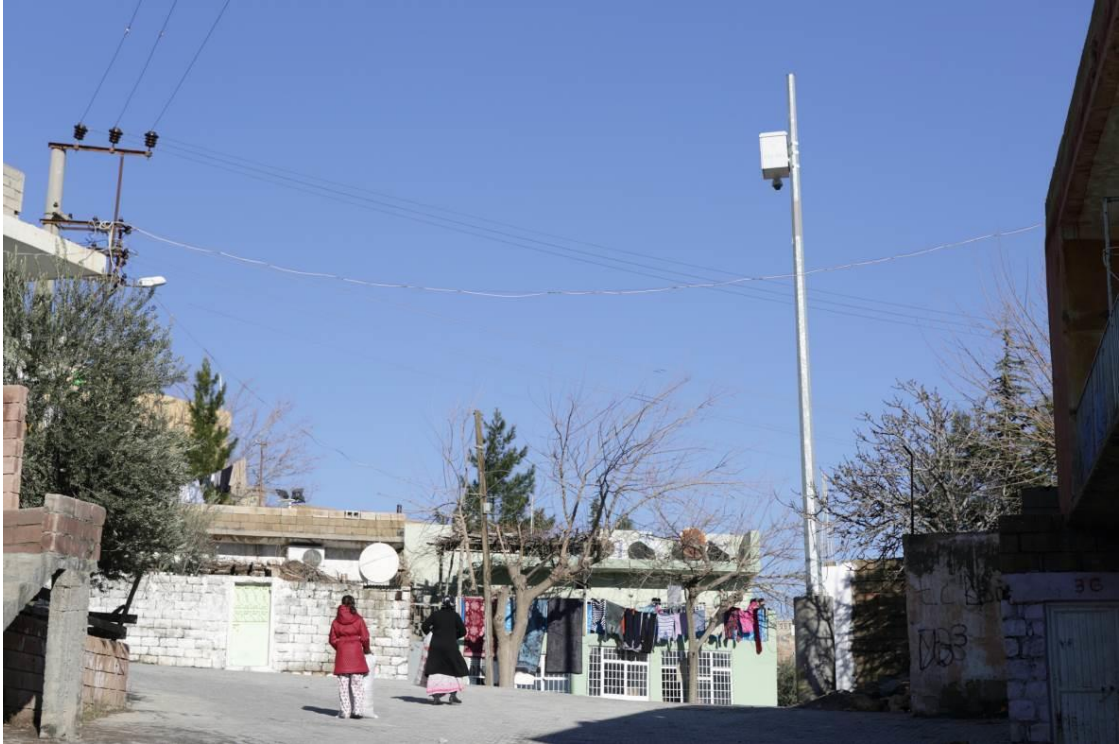
Fotoğraf 3: Mahallenin Ortasında Bulunan Mobese Kamerası

diğer yandan da kendisi bir denetleme aracına dönüşür ve iktidarını dayatabilir. Saraçoğlu Mahallesi'nin merkezinde bulunan mobese kamerasının bulunduğu sokak (Fotoğraf 3), en aktif kullanımların olduğu sokaktır. İnsanların gündelik hayatlarını sürdürdükleri kamusal mekân olmasının yanında, birçok miting ve toplanmalara da ev sahipliği yapmaktadır (Fotoğraf 4). Bu mitingler olağan bir durum olarak algılanmakta, hatta eylemlerin sonunda polisin müdahale etmesi (gaz bombası, tutuklamalar) bile halk arasında “normal”, olması her zaman muhtemel bir durum olarak kabul edilmektedir.