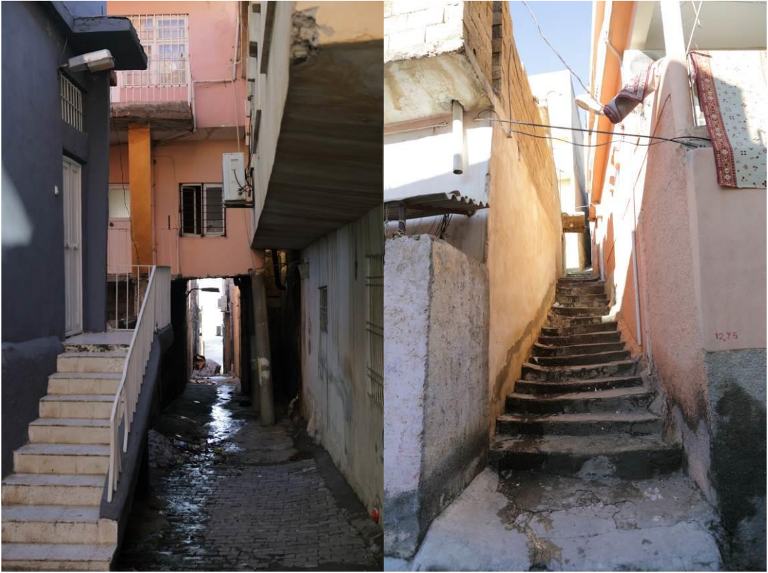
Fotoğraf 14: “Tarihi Mardin” dokusuna benzer, Dar Sokaklar, Abbaralar

Mahalledeki yapılara bakıldığında, yapı malzemesi olarak öngörülen, piyasada satılan, kullanım reçeteleri belli olan malzemeleri farklı şekillerde kullandıkları görülür.(Fotoğraf 15) Farklı malzeme kullanım biçimlerinin denenmesi ve dönüştürülmesi durumu, Saraçoğlu Mahallesiindeki ekonomik imkansızlıklarla ilişkili olduğu söylenebilir. Mahallenin fiziksel özelliklerinin oluşumunda, maddi imkanlar