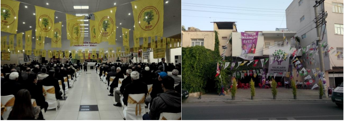
Fotoğraf 7: Şimal Düğün Salonu ve Kiraathaneler