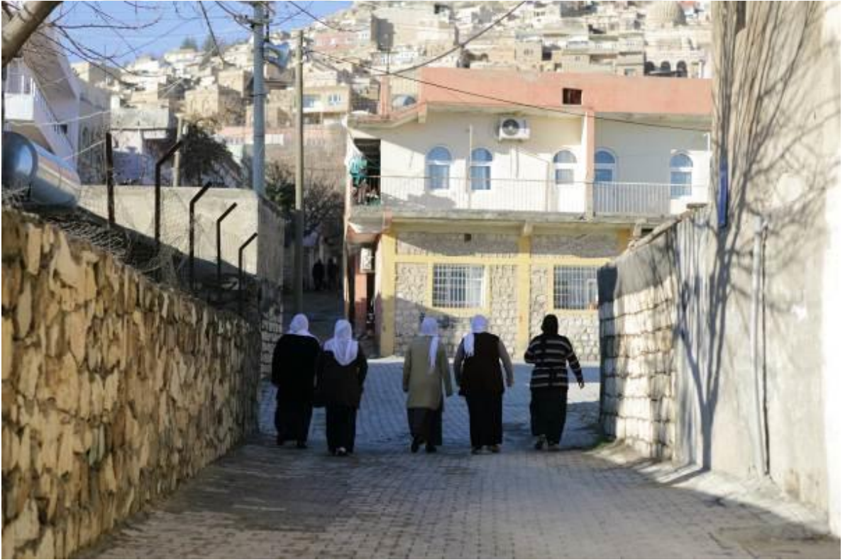
Fotoğraf 11: Oyun oynama, Karşılaşma Mekânları; Sokaklar