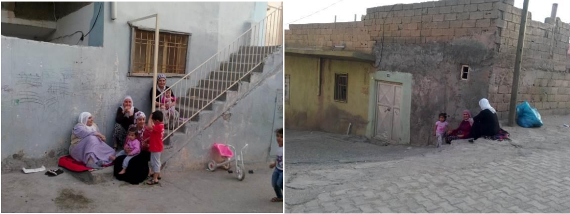
Fotoğraf 9: Oturma, Dinlenme, Muhabbet Mekânları; Sokaklar

Saraçoğlu mahallesi sokakları sadece bir sirkülasyon ve geçiş mekânı değil, insanların bir araya gelerek kapı önlerinde oturdukları, dinlendikleri, sohbet ettikleri mekânlardır. (Fotoğraf 9) Mahalledeki kadınların kendi ekmeklerini pişirdikleri tandırlar sokak kenarlarındadır. (Fotoğraf 10) Kadınlar için bu mekânlar sadece ekmek pişirme değil diyalog kurma yeridir. Bunların yanında düğünlerin yapıldığı, pazarların kurulduğu, çocukların toplaşarak oyun oynadıkları mekândır sokaklar. (Fotoğraf 11) Gözlemlenen pratikler sokak yaşamının sadece bir kısmıdır.