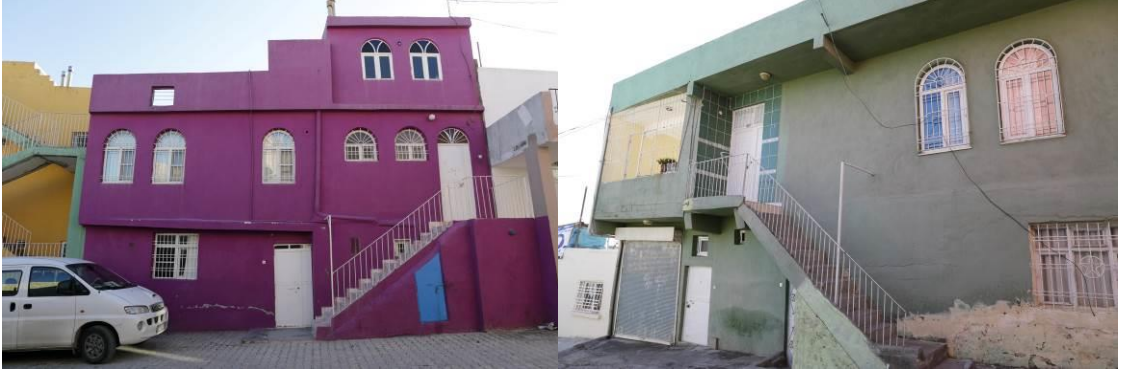
Fotoğraf 13: Binalardaki Kemerli Pencereleler