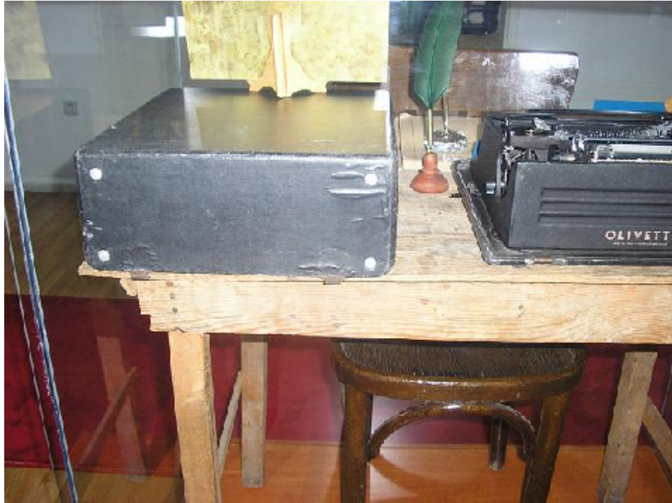
Hüseyin Hüsnü Tekışık'ın kullandığı yazı makinesi ve tahta sandıklardan yaptığı çalışma masası

(Hüseyin Hüsnü Tekışık Eğitime Hizmet Müzesi)