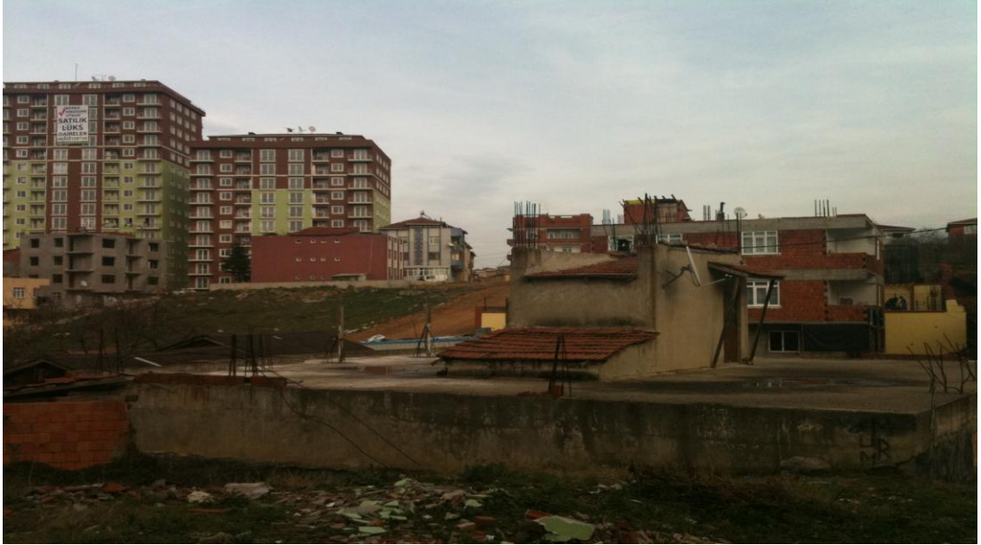
Fotoğraf 1: Sancaktepe'de gecekondulaşma yanısıra son yıllarda lüks sitelerde yaygınlaştığı görülmektedir.“