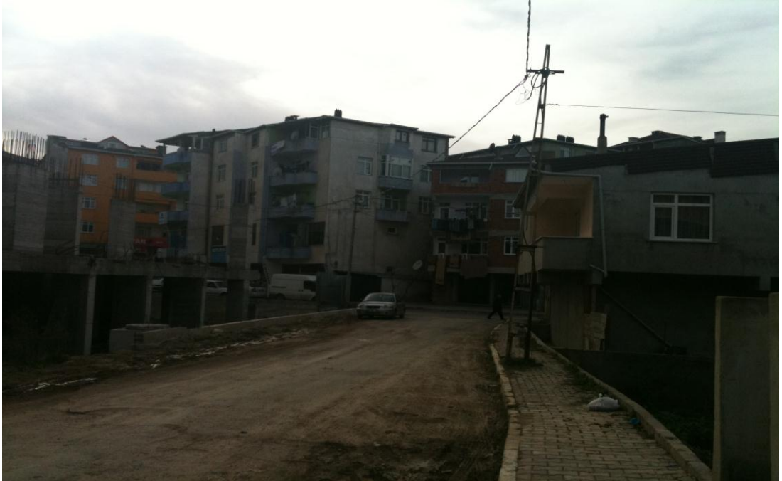
Fotoğraf 2: Yoğun göç alan ve hızlı büyüyen Sancaktepe'de alt yapı hizmetlerinin yetersizliği göze çarpmaktadır