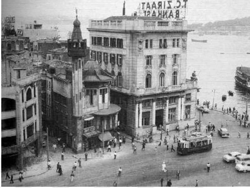
Resim 4: Karaköy'de kıyıda, Galata Köprüsü'ne bakan Ziraat Bankası'nın (bir zamanlar Avusturya Bankası) hemen arkasında yer alan cami yıkılmıştır.