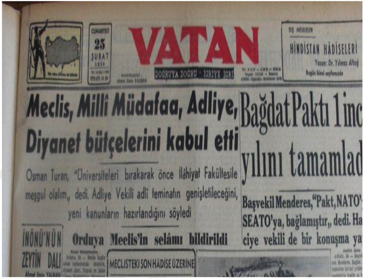
Ek 15: Vatan 25 Şubat 1956