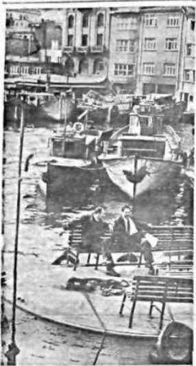
HAVALAR DÜZELİYOR Bu fotoğrafın çekildiği saatlerde İstanbul'da hava temiz ve güneşli idi. Bu durum, DP'nin tahkikat komisyonunun çalışmalarına katkı sağlıyor.

Dün kurulan 15 kişilik DP Tahkikat Komisyonu çalışmaya başladı ve tahkikat sonuna kadar kongrelerle her türlü parti toplantılarını menetti