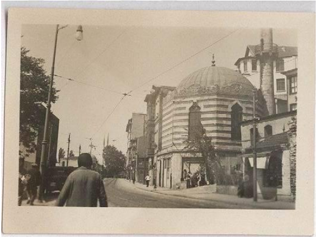
Resim 1: Demokrat Parti döneminde, İstanbul'da yol yapım çalışmaları sırasında 1957'de yıkılan Süheyl Bey Camii.

Bununla birlikte DP iktidarı, 2.600 yıllık tarihi önemsemeyen, kapitalizmin ekonomik tercihi olan, petrol ve otomobil tüketimi için gerekli olan karayolu imar faaliyetinde bulunarak tarihi eserleri yok etmiştir. Yol için feda edilen tarihi eserler; İnhisarlar Binası, Tophane Kışlası, Tophane Müşirliği Binası, Fındıklı Hamamı, Süheyl Camii, Çivici Limanı Camii, Murad Paşa Camii, Kazasker Abdurrahman Camii, Simkeşhane, Hasan Paşa Hanı, Bayezid Hamamı, Fatih Külliyesi'nin Akdeniz Medreseleri, Koca Ragıp Paşa Kütüphanesi ve Sıbyan Mektebi, Şirment Çavuş Camii ve Türbesi, Oğlanlar Tekkesi, Tevekkül Hamamı, Yusuf Paşa Çeşmesi, Çakırağa Camii ve Çeşmesi, Kâtip Çelebi Mezarı, İbrahim Ağa, Revani Çelebi Mescidi, Karaköy Mescidi, II. Abdülhamit Çeşmesi ve bunun gibi daha birçok tarihi eser Osmanlı İstanbul'unun sonunu getirmiştir. Üstelik bu yıkım muhafazakâr bir parti tarafından yapılmıştır. Yol yapımı yüzünden yıkılan bu camilerden birkaç örnek aşağıdaki resimlerden görülebilir (Hür, 2015: 174-177).