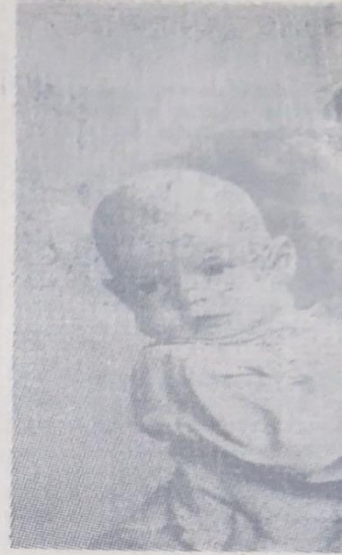
İngrid Bergman ve oğlu Renin Rosselini ile aşkının meyvesi kız resmen eski kocasından ayrılanın gayrimüşru çocuğu olduğunu iddia eden tröm soya