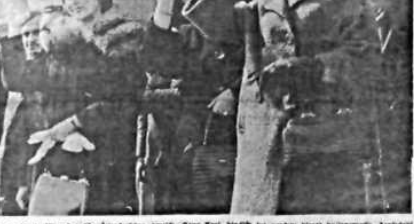
İKRAMİYELERİN YANISI 3 HAZİRANDA ÖDENECEK Devlet kurumları tarafından alınan kararlar.

NUMARALI 3 Tebliğ Her türlü yayının yasak edildi