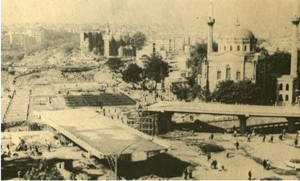
Resim 3: Demokrat Parti döneminde, İstanbul Aksaray'da Vatan Caddesi yapılırken birçok tarihi cami yıkılmıştır.