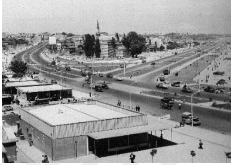
Resim 2: İstanbul'da yol yapım çalışmaları esnasında 1957'de yıkılan Murat Paşa Camii.