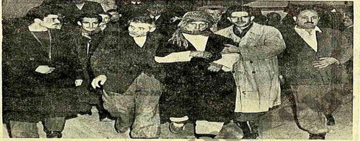
80 lik ihtiyar Salt Nursi dün koltukla Ağır Ceza Mahkemesine getirilirken