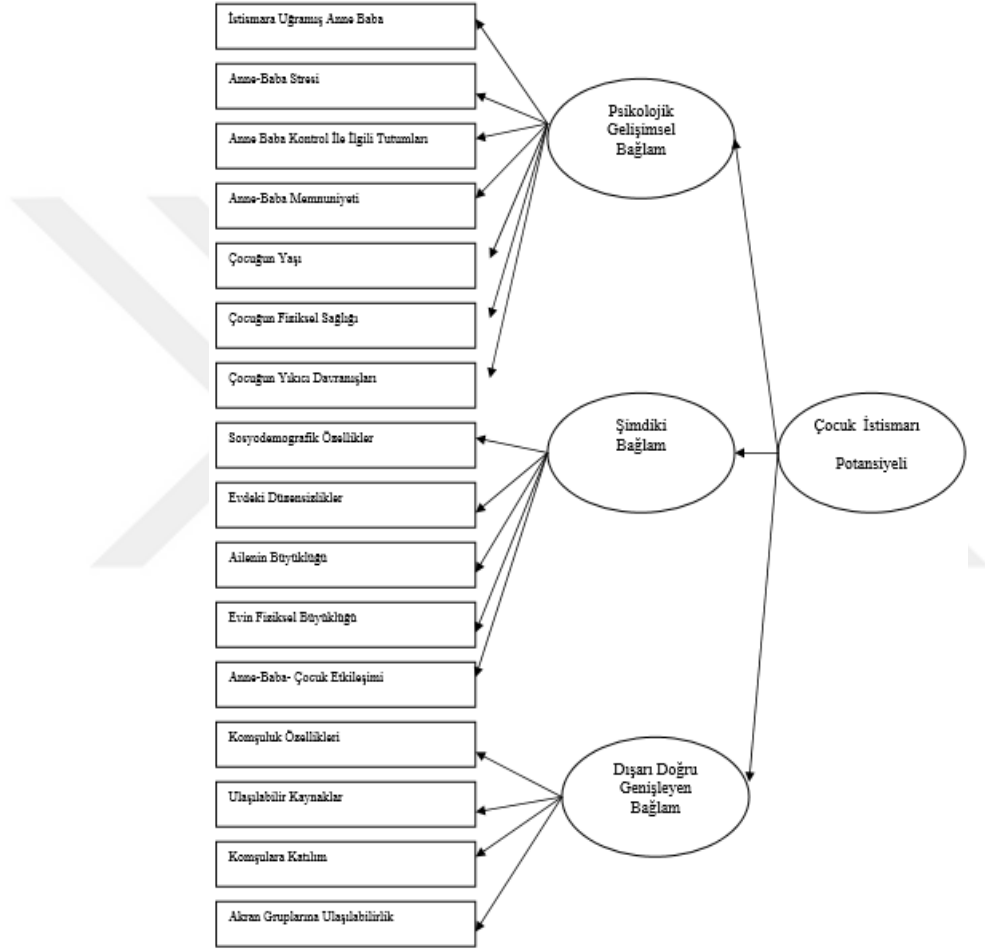
Şekil 2.4: Geliřimsel Ekolojik Model

Literatürde ocuk istismarına neden olan risk faktörlerini Begle ve arkadaşları (2010) üç başlıkta incelenmiř ve sonucunda ortaya ıkan alt başlıkları görebilmek adına řekil haline getirmiřlerdir.