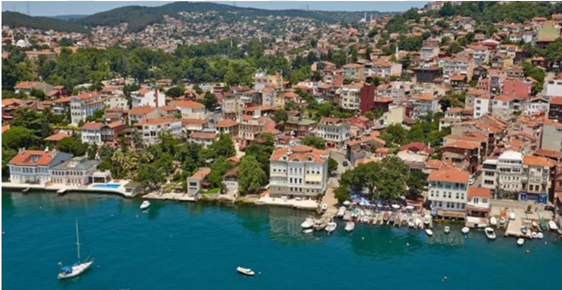
Beykoz – Yalıköy (30.10.2017)