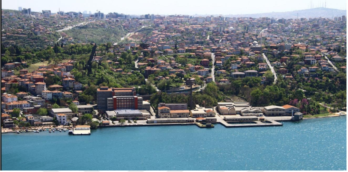
Paşabahçe Tekel ve İspirto Fabrikası – Beykoz (02.07.2017)

http://www.torunlargyo.com.tr/pasabahce.php