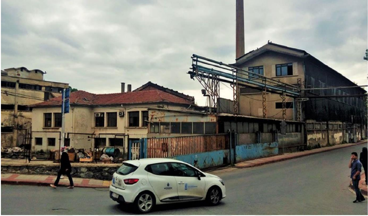
Paşabahçe Şişecam Fabrikası – Beykoz (24 Mayıs 2016)

http://www.sozcu.com.tr/2016/gundem/pasabahcenin-sembolu-yikilip-otel-yapilacak-1243309