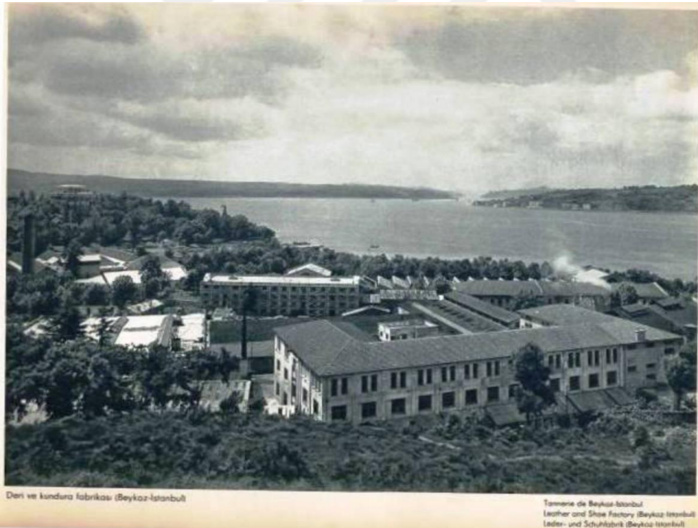
1810 Beykoz Deri ve Kundura Fabrikası

http://www.beykozses.com/bir-zamanlar-beykoz-akbaba-demiryolu.html