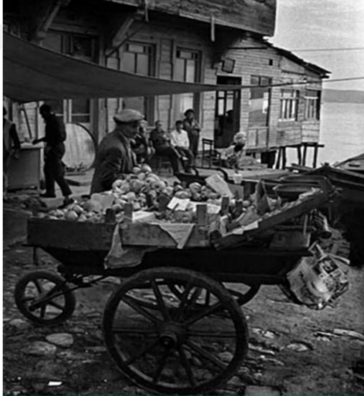
1957 yılı Beykoz'dan bir kare