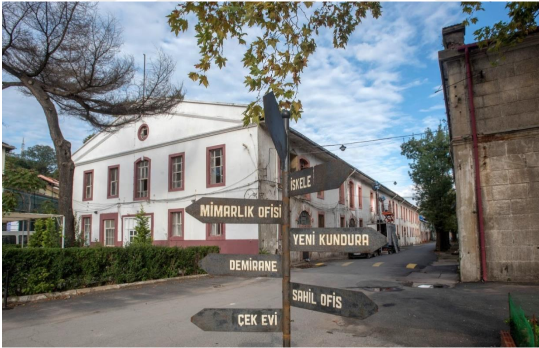
Beykoz Deri ve Kundura Fabrikası (2012)

http://www.sozcu.com.tr/2016/gundem/pasabahcenin-sembolu-yikilip-otel-yapilacak-1243309