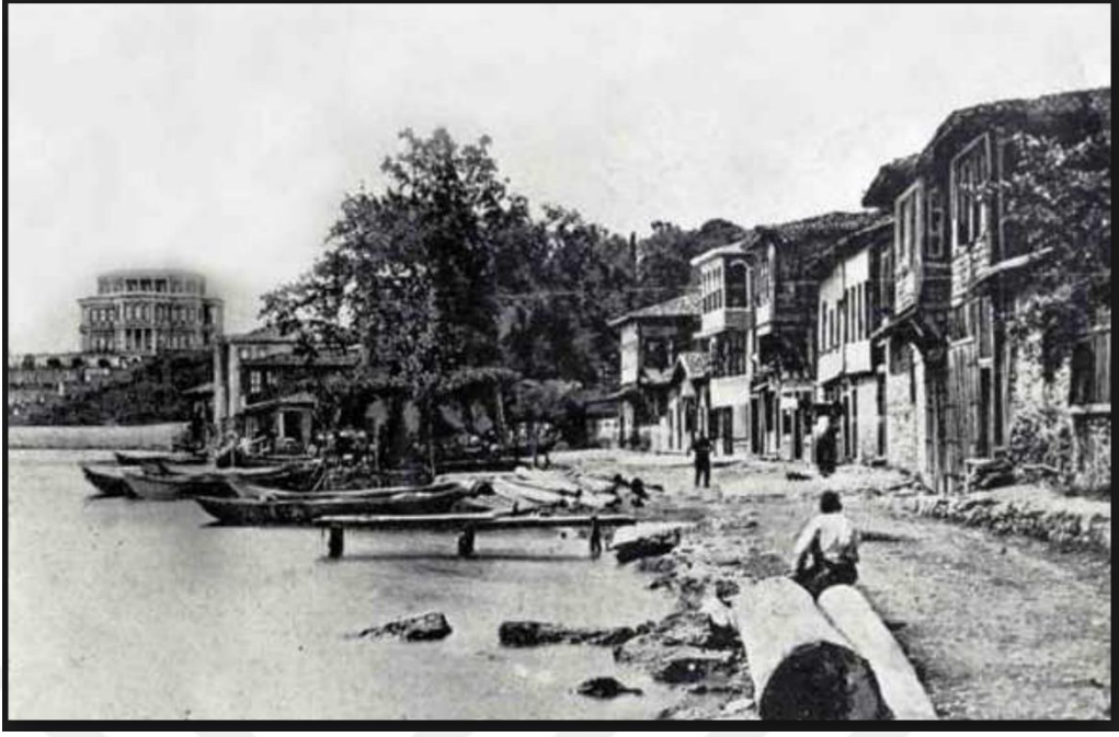
Geçmişten bir kare; Beykoz Yalıköy' den görünen Beykoz Kasrı

http://www.degisti.com/index.php/archives/511