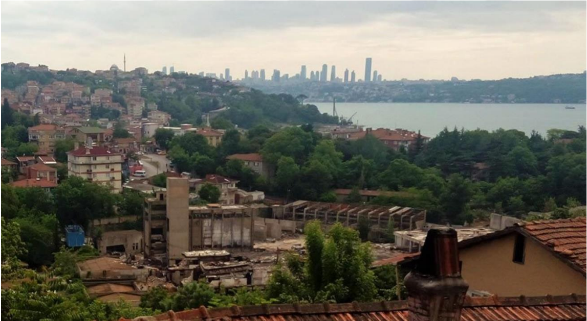
Paşabahçe Şişecam Fabrikası – Beykoz (24 Mayıs 2016)

http://www.torunlargyo.com.tr/pasabahce.php