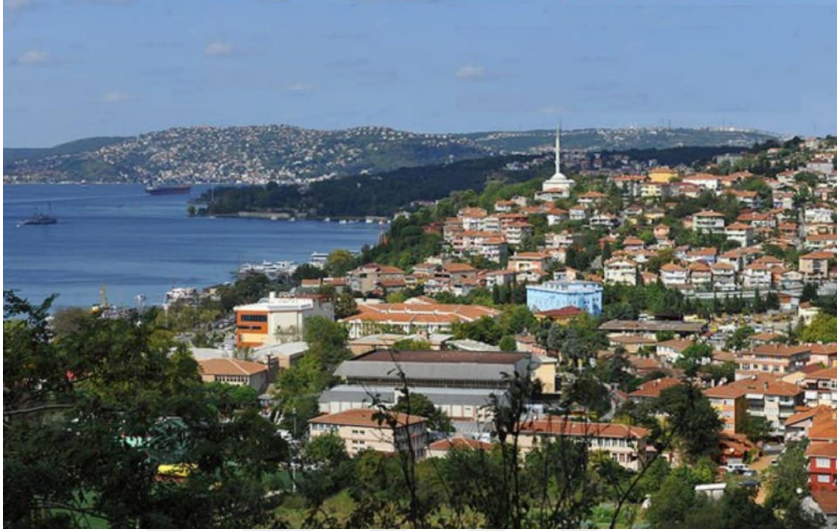
Beykoz – (27.10.2017)