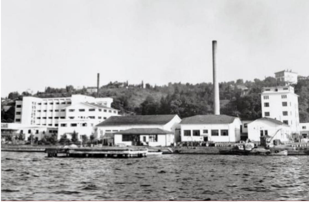
İstanbul Paşabahçe Şişe ve Cam Fabrikası 1935 – Beykoz