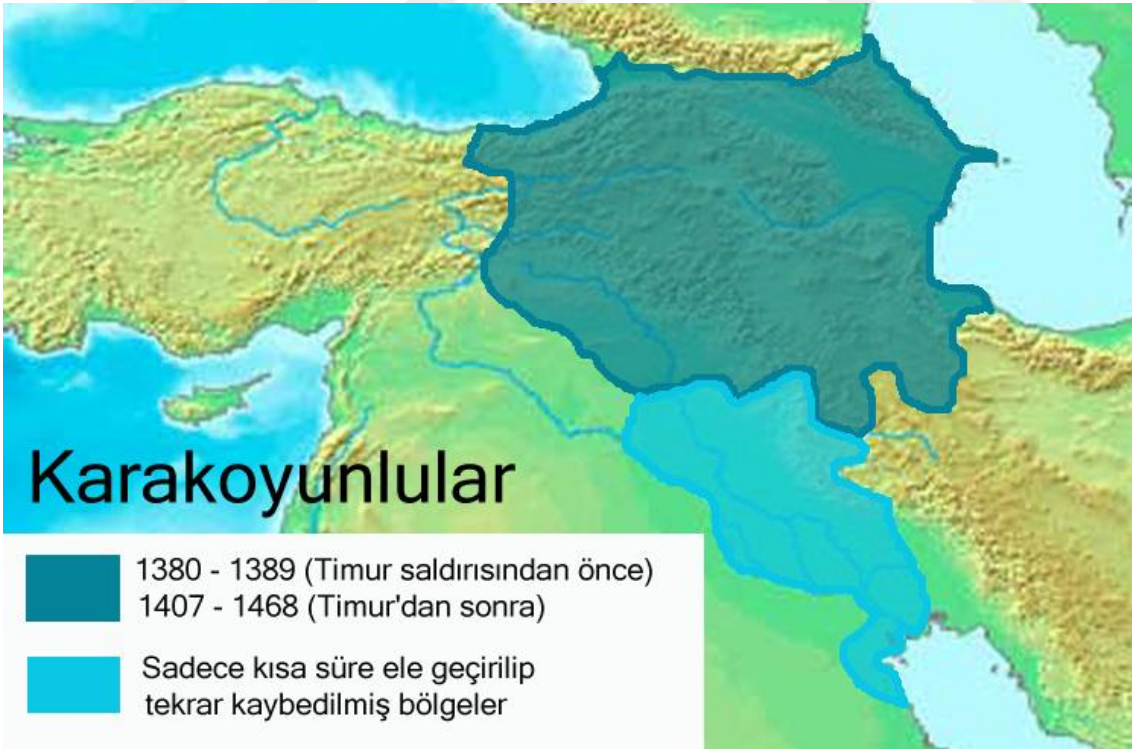
Harita 2. Karakoyunluların Tarih Sahnesine Çıkışı