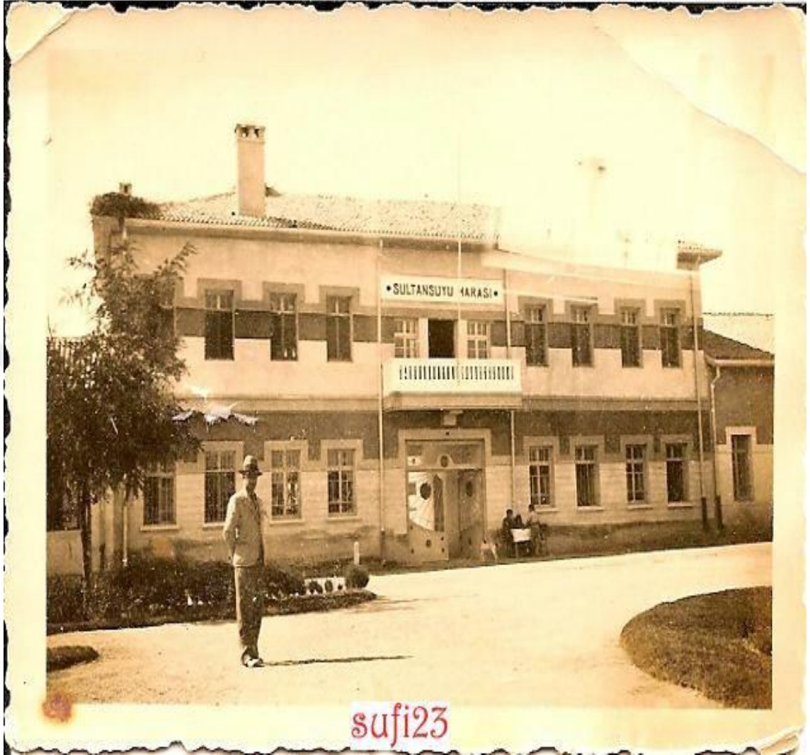
Ek 3: Sultansuyu Harası Merkez Binası