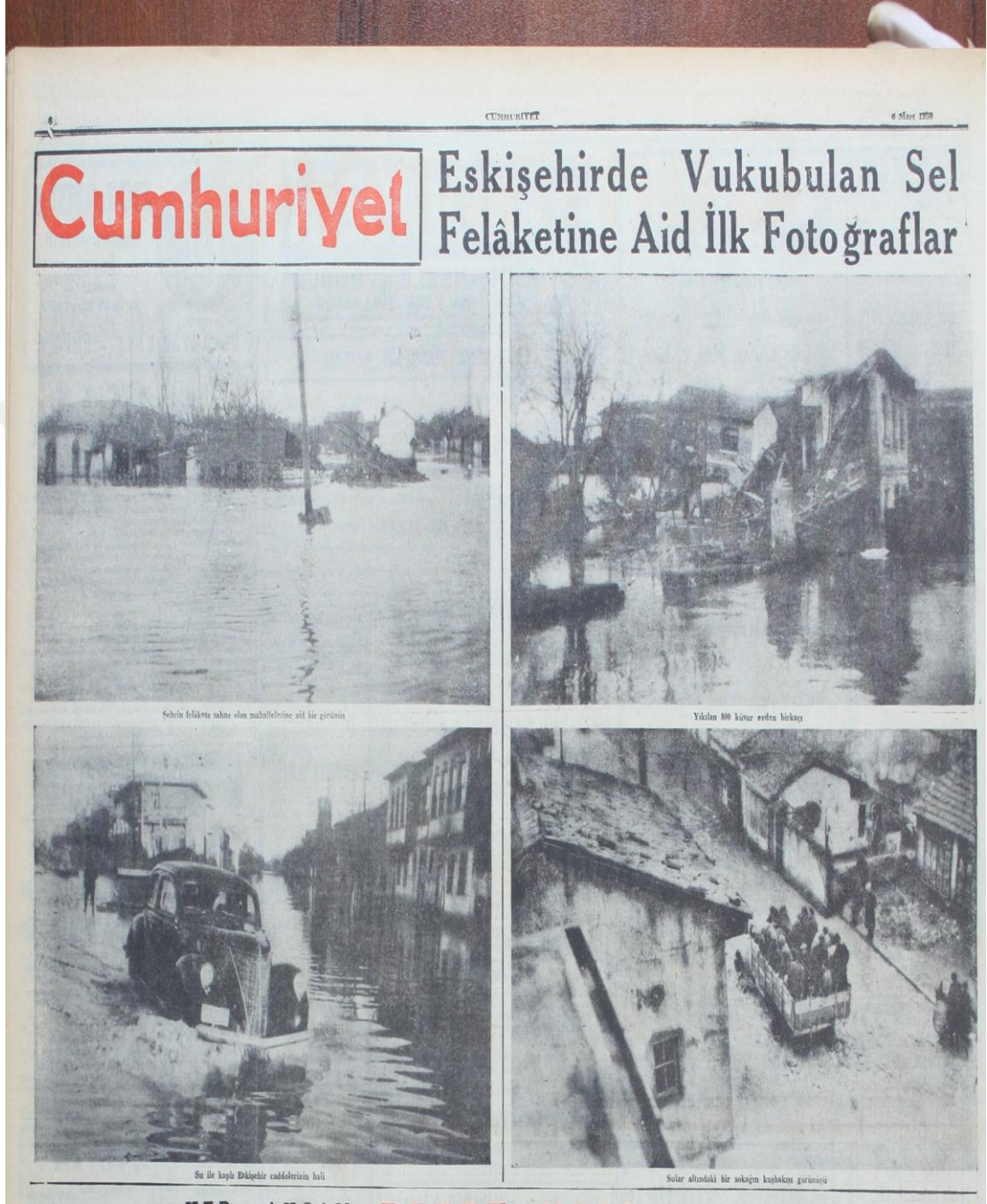
Ek 7: 1950 Eskişehir Sel Afeti'ne Ait 5 Mart 1950 Tarihinde Cumhuriyet Gazetesi'nde Yer Alan Fotoğraflar