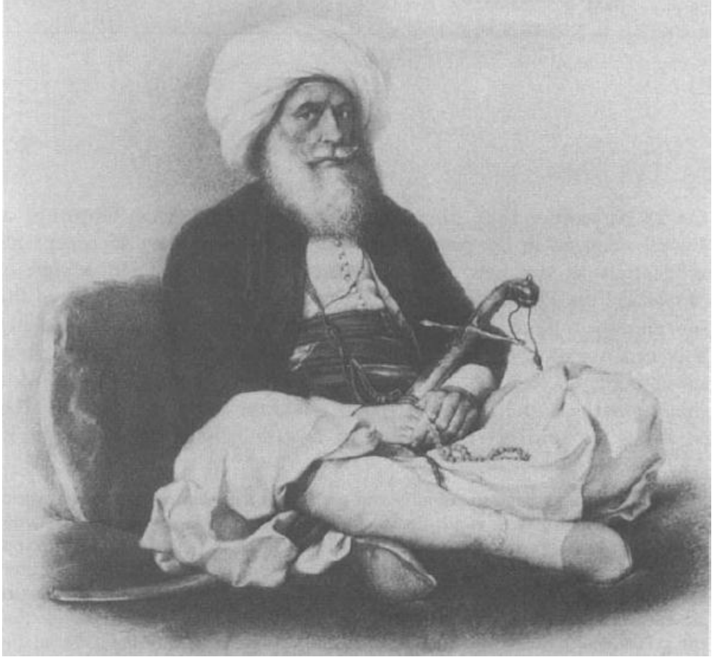
Ek 1: Kavalalı Mehmet Ali Paşa 309 .