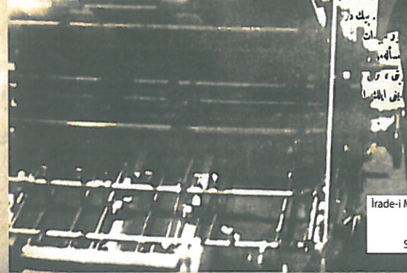
İrade-i Milliye Gazetesi, Sivas Kongresi kararlarıyla kurulan Heyet-i Temsiliye'nin yayım organıdır. İlk sayısı 14 Eylül 1919 günü Sivas Vilayeti Basimevinde yayımlanmıştır.

عوام قانده سنک ۱۷ تشرین ثانی تاریخل ایچنده تورکیاده اوزون مدت قامت ایتن جنرال سونلی آیتدیکی سوزلری سوبیلمشدر : تورک مننک اکثون عتسده حربه جبراسور و کلانش