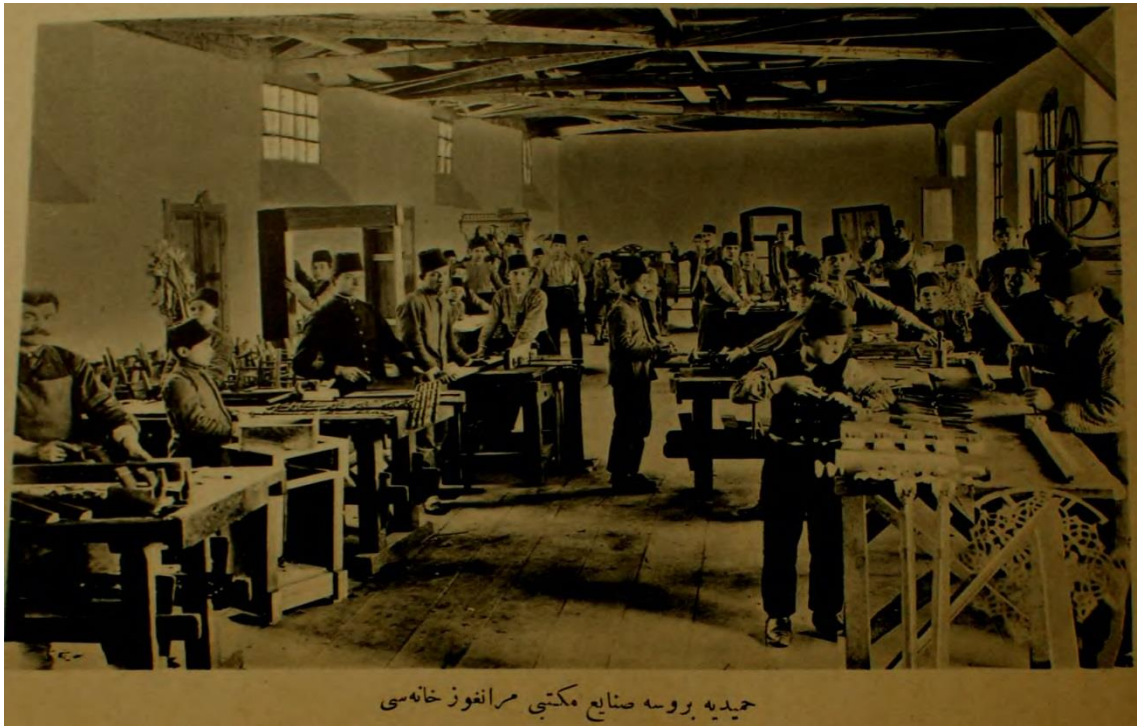
حمیدیه بروسه صنایع مکتبی مرانفوز خانہ سی