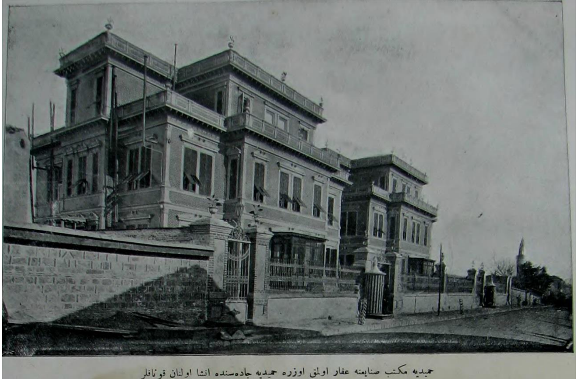
حمیدیه مکتب صنایعنه عقار اولقی اوزره حمیدیه جاده سنده انشا اولنان قوناقلر