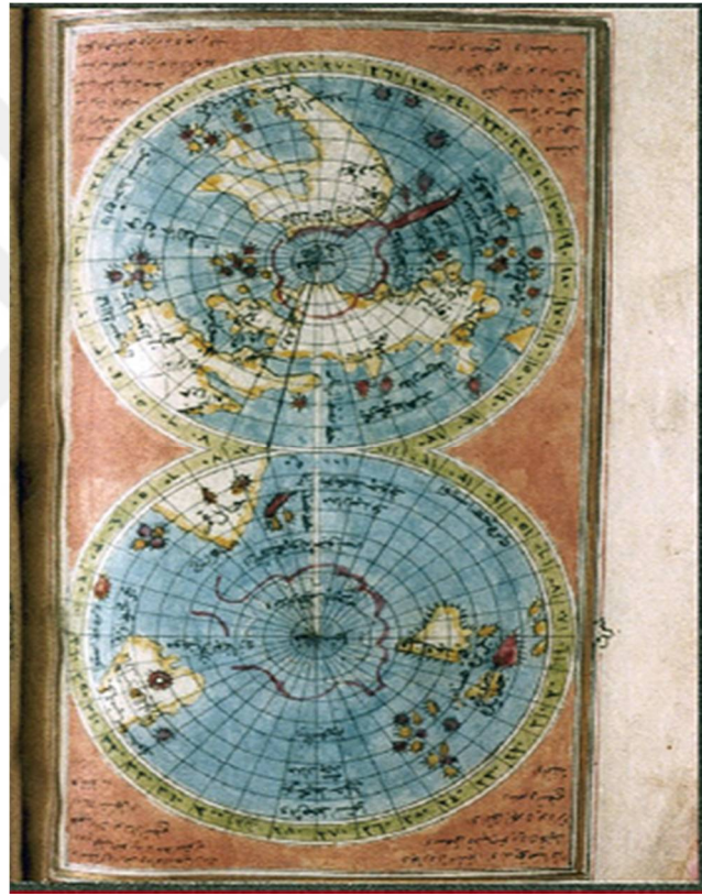
Resim 3. İbrahim Hakkı'nın Çizmiş Olduğu Dünya Haritası 111

dakika eğikliği, enlem boylam ve bazı şehirleri gösteren ahşaptan yer küre yapması ve dünyanın kuzey ve güney kutuplarını detaylıca gösteren dünya haritası çizmesi (Resim 3); yıldızların ve güneşin ufuktan geçme anına göre zamanı ve kişinin dünya üzerinde bulunduğu konumu hesaplamaya yarayan usturlab, rub’ul müceyyip ve Rub’ul Mukantanat isimli aletleri yapması; el yazması Marifetname isimli eserinin başlığında kullandığı boyaları kendisinin üretmesi 110 sahip olduğu ilmi birikimi deneysel anlamda uygulamaya geçirdiğini göstermektedir. Özetle ifade edecek olursak İbrahim Hakkı, pozitif ilimlerle ilgili yazdığı bilgileri deneysel etkinlikler ile temellendirmiş, verdiği nazari bilgileri pratik zeminde uygulamaya geçirmiştir.