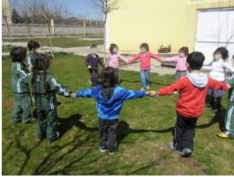
Fotoğraf 1. Anaokullarında Oyun Olarak Yapılan Egzersiz Hareketlerinden Biri

Aşağıda bir anaokulunda çocuklarla yapılan oyunlu egzersiz ve jimnastik hareketleri görsel olarak verilmiştir.