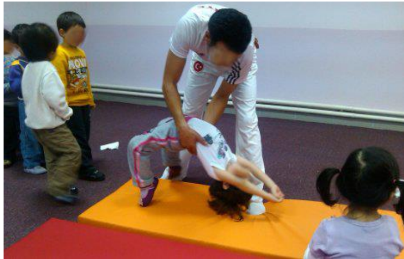
Fotoğraf 2. Anaokullarında Yapılan Jimnastik Hareketlerinden Biri