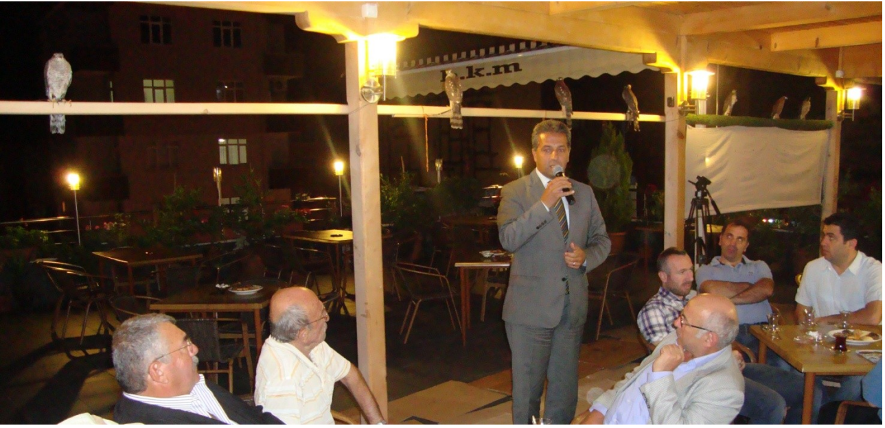
Fotoğraf 7. Atmacacılık kültürünü koruma ve yaşatma derneği toplantısı (Arhavi)