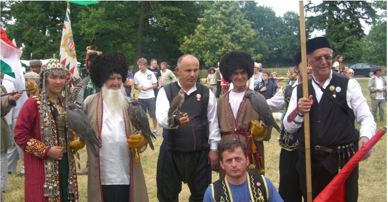
Fotoğraf 10. Uluslararası yırtıcı kuşlar festivali Türkiye ve Türkmenistan kabileleri