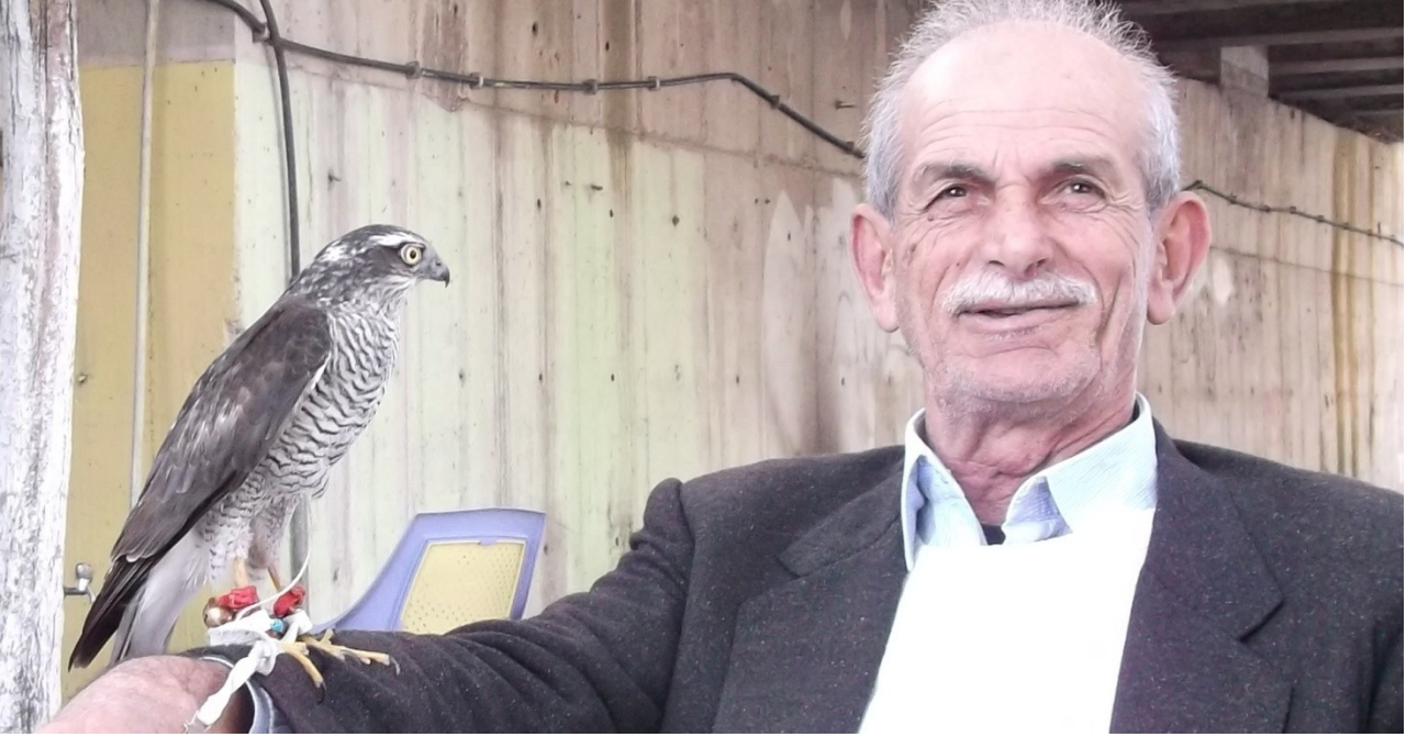
Fotoğraf 1. Sahibine tabii olma aşamasındaki acemi bir atmaca ile usta atmacacı