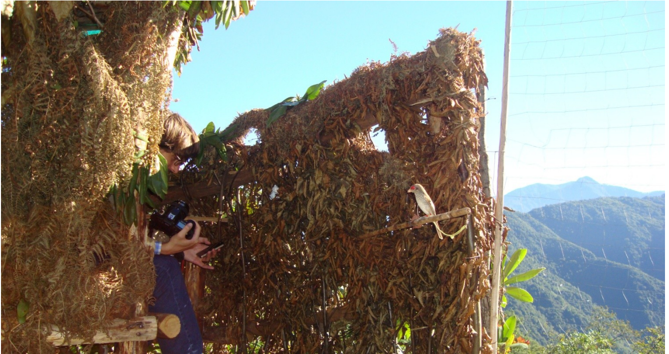
Fotoğraf 6. Tenta'da kızs ırtl örümcek kuşu ile atmaca yakalanmasını görüntülemeye çalışan fotoğrafçı