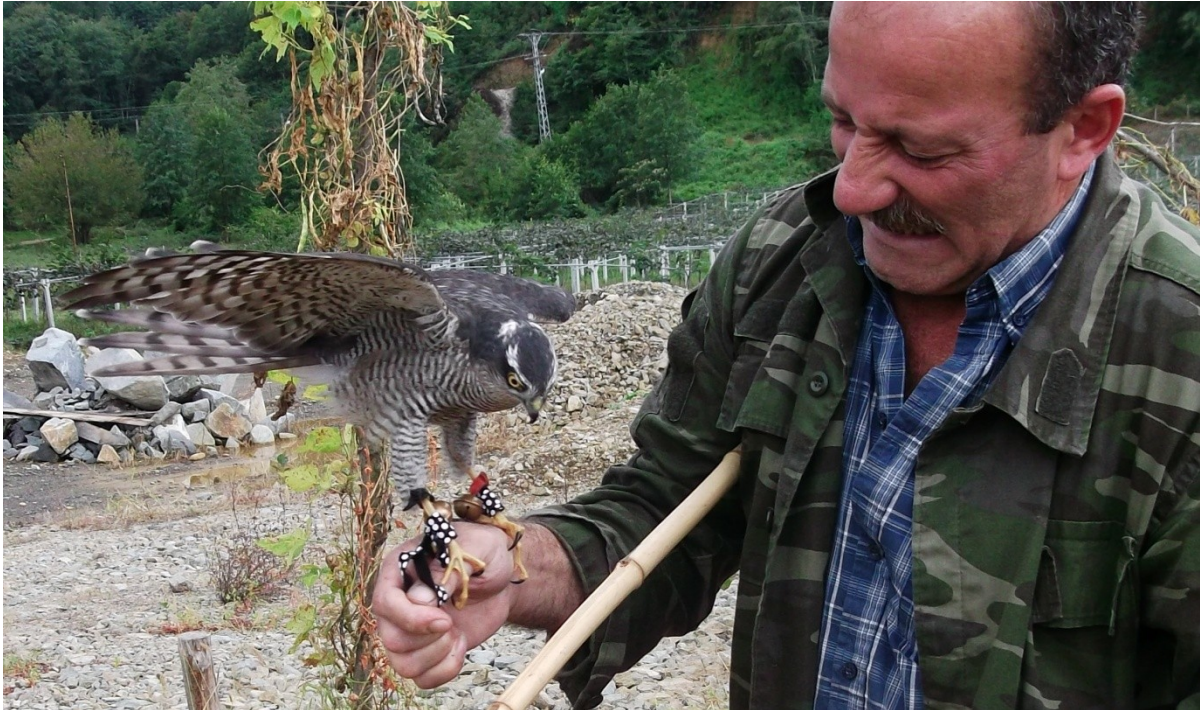
Fotoğraf 2. Usta atmacacının kolunda avlanmak için sabırsızlanan atmaca