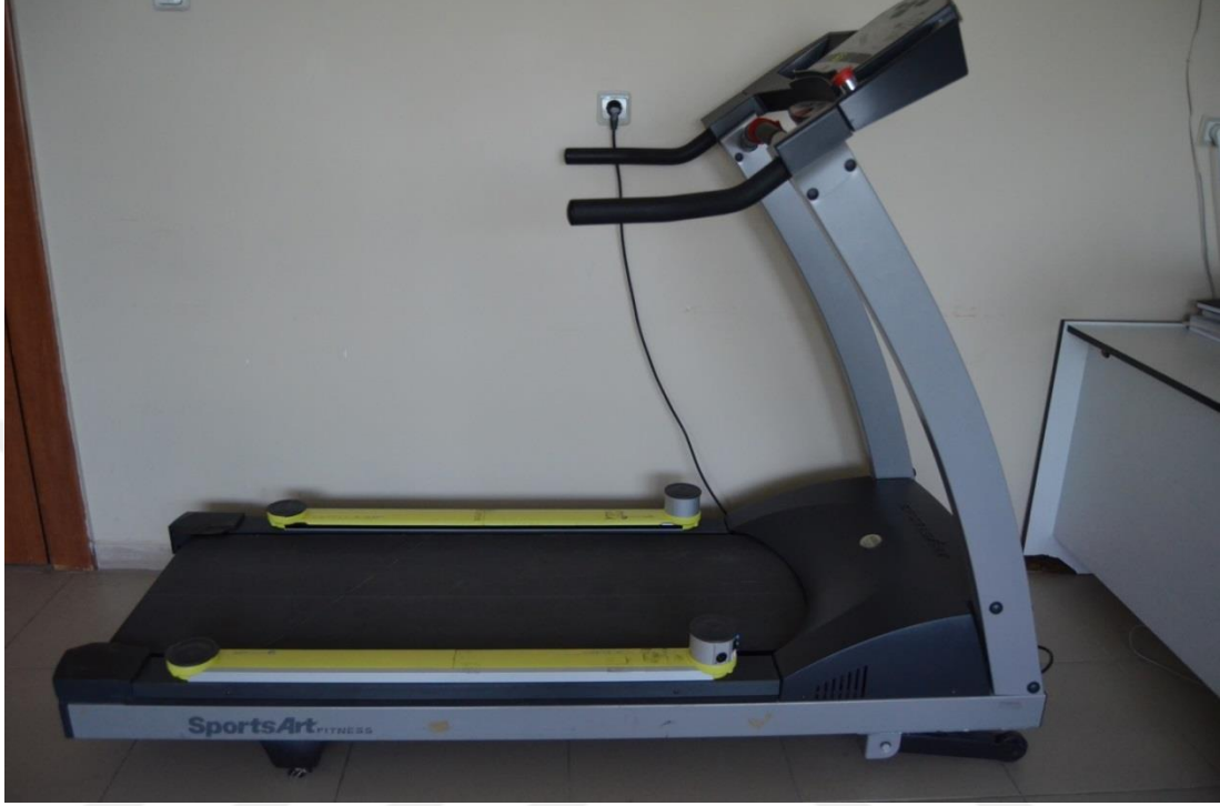
Şekil 3.2. Optojump yürüme bandının üzerine yerleştirildikten sonra

kisimlarına yerleştirilerek ölçülmüştür (Şekil 3.1 ve 3.2.). Optojump Rago V. ve arkadaşları tarafından 2018 yılında yürütülen bir çalışmada, adım uzunluğu ölçümleri alınırken kullanılmış ve güvenilirliği kanıtlanmıştır (52).