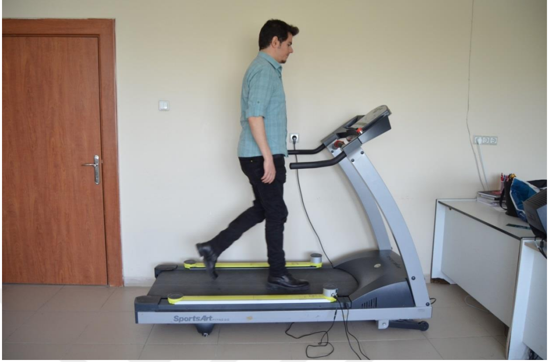
Şekil 3.4.Katılımcı yürürken

Bunlarla beraber kişilerin boyları Martin tip antropometre ile ölçüldü. Kişilerin boyları ve adım uzunlukları ölçümleri santimetre cinsinden alındı. Kilonları cinsiyetleri ve doğum tarihleri kaydedildi. Daha sonra toplanan bütün verilerin girişi yapıldı. Bütün ölçümler aynı araştırmacı tarafından günün aynı saatinde alındı.