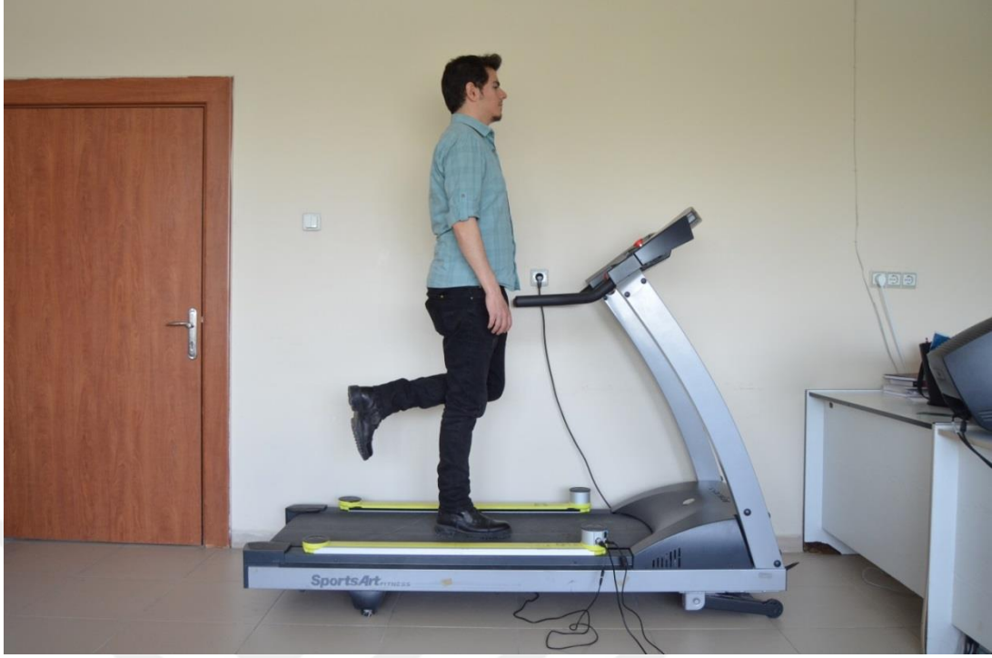
Şekil 3.3. Ayak uzunluğu ölçümü alınırken

Adım uzunlukları gerek kadın gerekse erkek bireyler için daha önceden belirlenmiş olan iki farklı hızda birer dakika boyunca yürürken alınmıştır. Çalışmamızda yürüyüş hızlarını Whittle' in 2007 yılında yapmış olduğu ve ortalama yürüme hızı hesapladığı çalışmayı baz alarak belirledik (53). Biz çalışmamızı yaşları 18 – 49 arasında değişen bireyler üzerinde yürüttüğümüz için Whittle'ın 18 – 49 yaş arası erişkin bireylerden almış olduğu ölçümlerle ortaya koyduğu yürüme hızlarını kullanarak adım uzunluğunu değerlendirdik (53). Yürüme hızları erkek katılımcılar için 3,3 km/s ve 5,3 km/s, kadınlar içinse 2,7km/s ve 4,7 km/s olarak belirlenmiştir. Her iki cinsiyet için de kişi yürüme bandında yürümeye başladıktan sonra hız kademeli olarak arttırılarak belirlenmiş birinci hıza ulaşılmış ve katılımcı bu hızda bir dakika yürütülerek ilk ölçümler alınmıştır. Daha sonra bandın hızı tekrar kademeli olarak arttırılarak saptanmış olan ikinci hıza ulaşılmış ve tekrar bir dakika yürütülerek adım uzunluk ölçümleri alınmıştır (Şekil 3.4.).