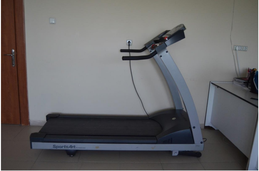
Şekil 3.1. Yürüme bandı boş hali

Çalışma Başkent Üniversitesi öğrencisi olan ya da Başkent Üniversitesi personel kadrosunda görev yapan 104 erkek 102 kadın toplam 206 birey üzerinde yürütülmüştür. Katılımcıların yaşları 18 ile 49 arasında değişmektedir. Herhangi bir kalp ve akciğer hastalığı olan ve bu doğrultuda ilaç kullanan kişiler ile herhangi bir alt ekstremitte sakatlığı olan bireyler çalışmaya dahil edilmemiştir.