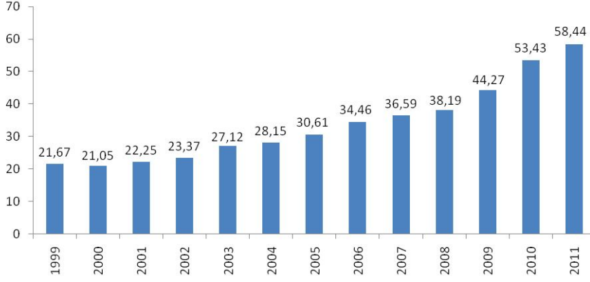
Şekil 2 : Türkiye’de Yıllara Göre Yükseköğretim Brüt Okullaşma Oranları (1999-2011) 1

Türkiye’de 1999-2011 dönemine ait yükseköğretim brüt okullaşma oranları Şekil 2’de gösterilmiştir. Brüt okullaşma oranı ilgili öğrenim türündeki tüm öğrencilerin, ait olduğu öğrenim türündeki teorik yaş grubunda bulunan toplam nüfusa bölünmesi ile elde edilmektedir. Türkiye’de yükseköğretim brüt okullaşma oranlarında 2007-2008 eğitim-öğretim yılından sonra büyük bir artış olmuştur. Türkiye’de 2007-2008 öğretim yılında %38,19 olan yükseköğretim brüt okullaşma oranı 2009-2010 öğretim yılı itibariyle %15,24’lük artışla %53,43’lük orana ulaşmıştır. 2010-2011 öğretim yılı itibariyle ise; artış hızında düşüş görünmesine rağmen, Türkiye’de yükseköğretim brüt okullaşma oranı yaklaşık %5’lik artışla %58,44 oranına ulaşmıştır.