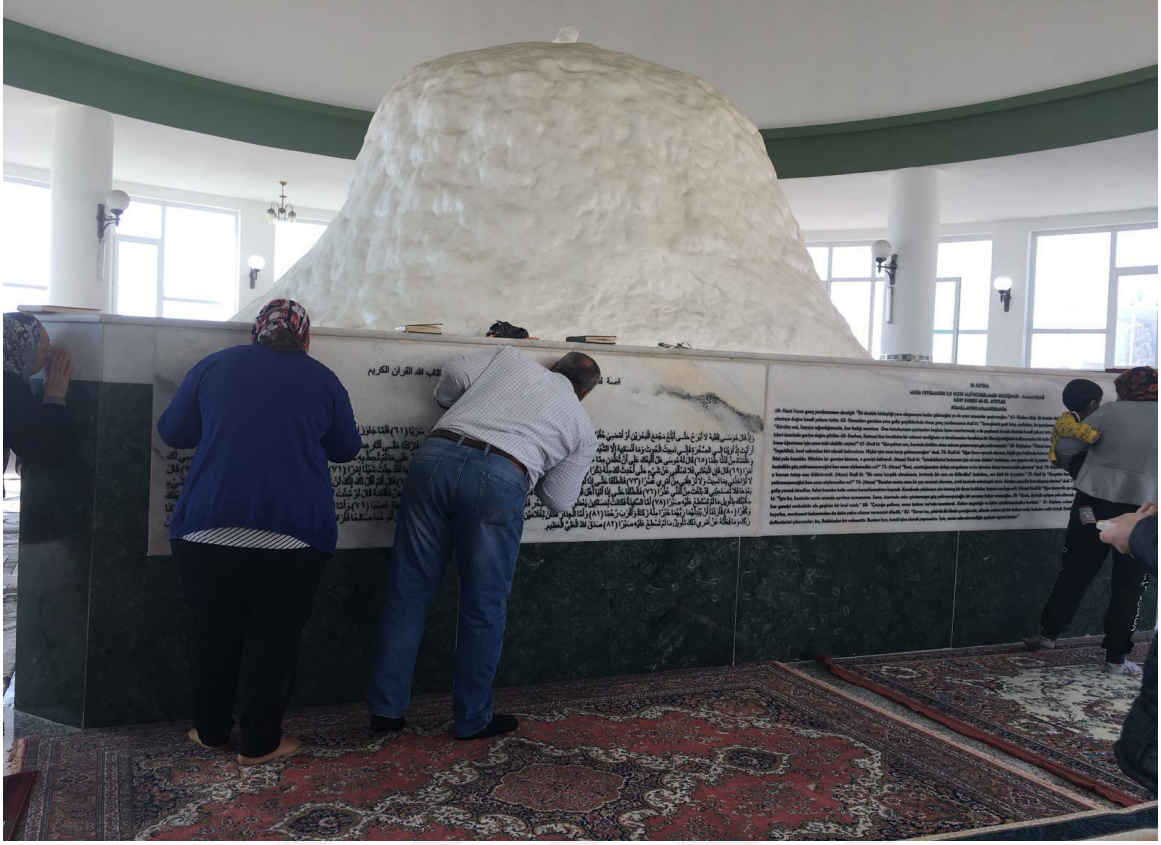
Fotoğraf-8 Samandağ'da Hızır Türbesi Ziyareti (Hatay Samandağ, Ocak 2018)