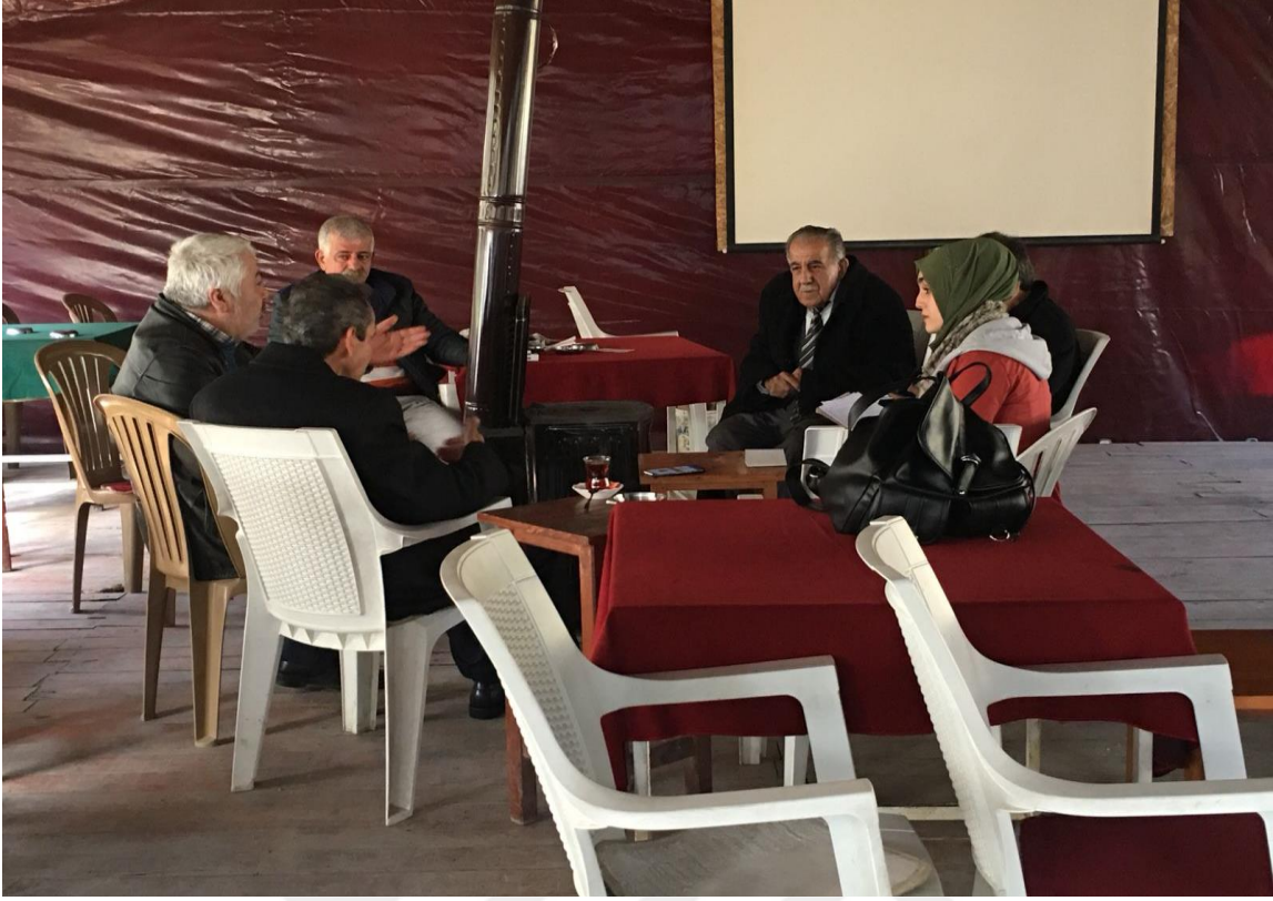
Fotoğraf-5 Antakya'da Fevzi Y. İle Mülakat-2 (Ayşe Yalçın Arşivi, Hatay Antakya, Ocak 2018)