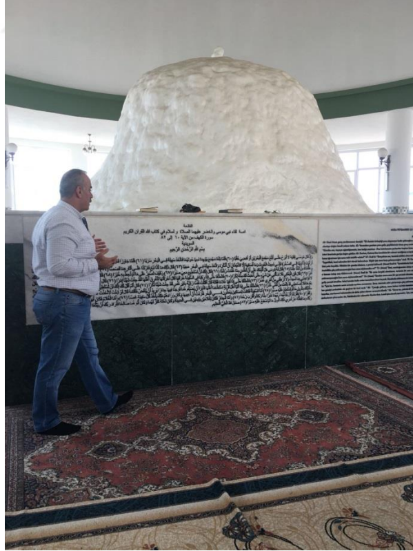
Fotoğraf-9 Samandağ'da Hızır Türbesi Ziyareti-2 (Ayşe Yalçın Arşivi, Hatay Samandağ, Ocak 2018)