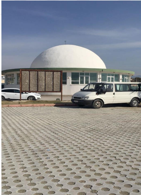
Fotoğraf-11 Samandağ'da Hızır Türbesi Ziyareti-4 (Ayşe Yalçın Arşivi, Hatay Samandağ, Ocak 2018)