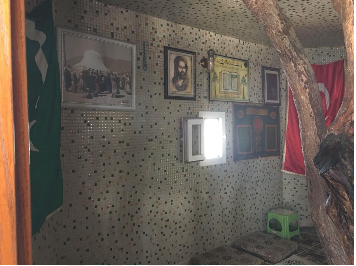
Fotoğraf-14 Antakya Merkez'de bulunan bir Türbe-3 (Hatay Antakya, Ocak 2018)