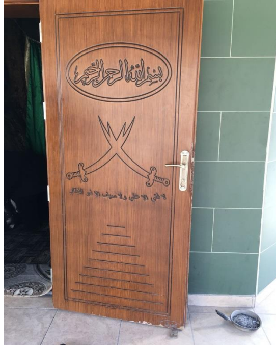
Fotoğraf-13 Antakya Merkez'de bulunan bir Türbe-2 (Ayşe Yalçın Arşivi, Hatay Antakya, Ocak 2018)