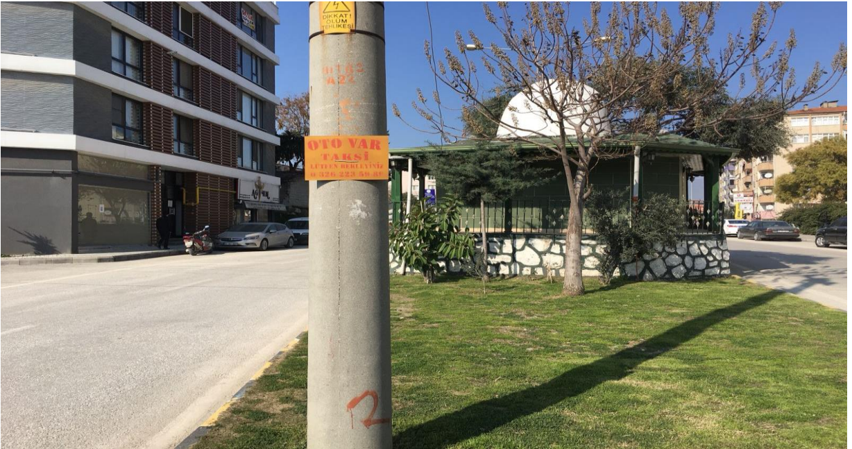
Fotoğraf-15 Antakya Merkez'de bulunan Türbe-4 (Ayşe Yalçın Arşivi, Hatay Antakya, Ocak 2018)