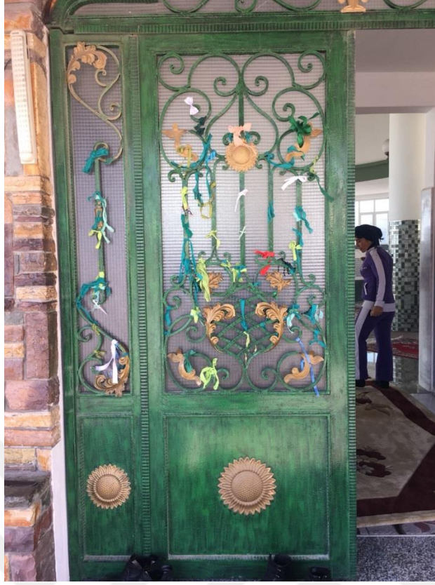
Fotoğraf-10 Samandağ'da Hızır Türbesi Ziyareti-3 (Hatay Samandağ, Ocak 2018)