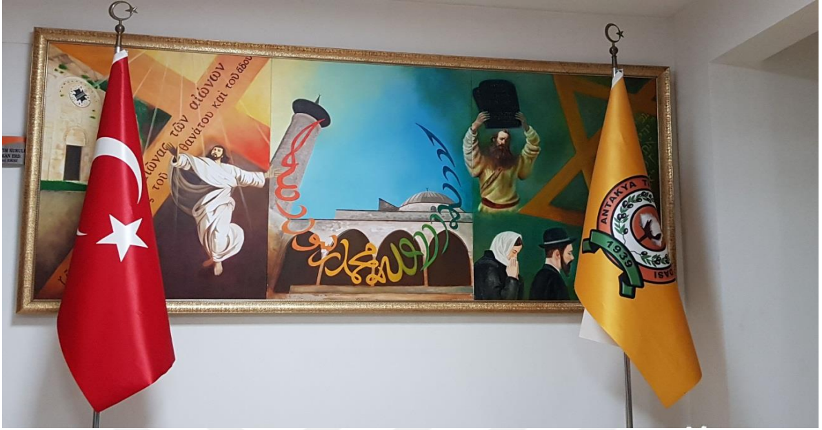
Fotoğraf-3 Antakya Ticaret ve Sanayi Odası (Ayşe Yalçın Arşivi, Hatay Antakya, Ocak 2018)