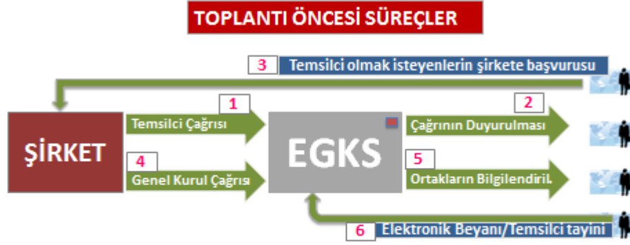
Şekil 1:Önerilen modele göre toplantı öncesi süreci