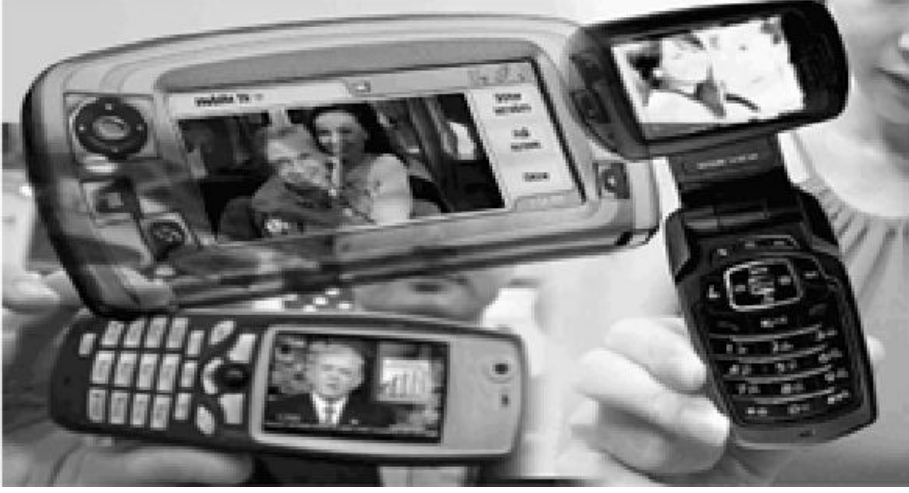
Resim1.1 mobil ağ

noktasının kitle iletişimde “mobil TV” olarak ortaya çıkması ağ toplumunun “hipersosyal” yapısına, mobil insan çağına işaret etmektedir. 6