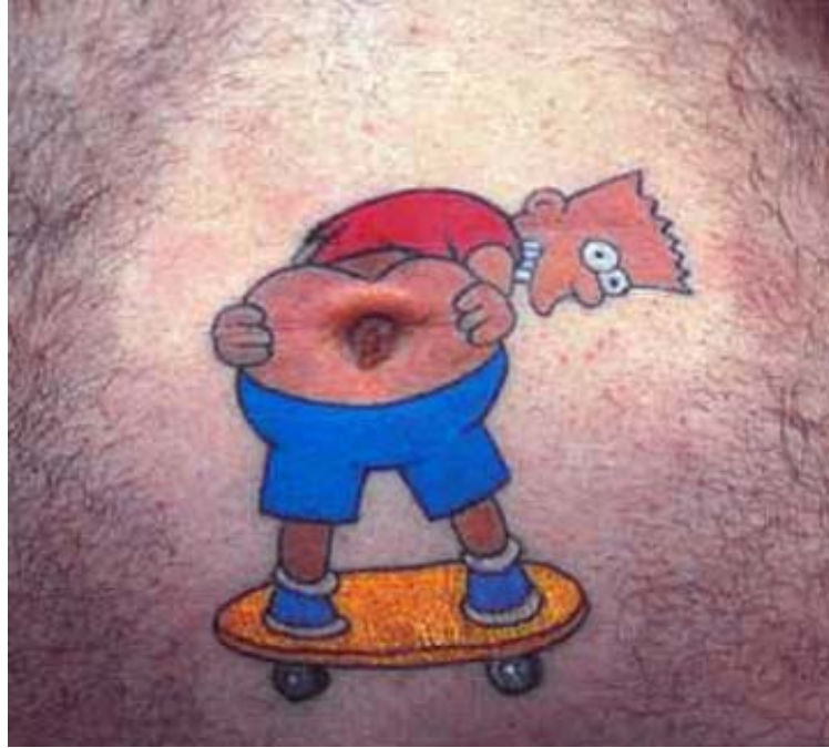
Resim – 3

Bunun yanında bir takım maddi sorunlar da vardır. Müstehcen bir resmin teşhiri Ceza Kanununda suç kılınmıştır. Ancak bir kişinin bu müstehcen tasvirleri, vücuduna dövme yaptırması halinde ne olacaktır? Zira hukukumuzda göre kişiler, dokunulamayacak bir vücut bütünlüğüne sahiptir. 236 Bu durumda kişinin vücut bütünlüğüne dokunulamayacağı gibi müstehcenlik suçunun tesisinden amaçlanan yarar da sağlanamayacaktır. Bu tür dövmelere ait kimi örnekleri Resim - 3, Resim - 4 ve Resim - 5'te görmek mümkündür.