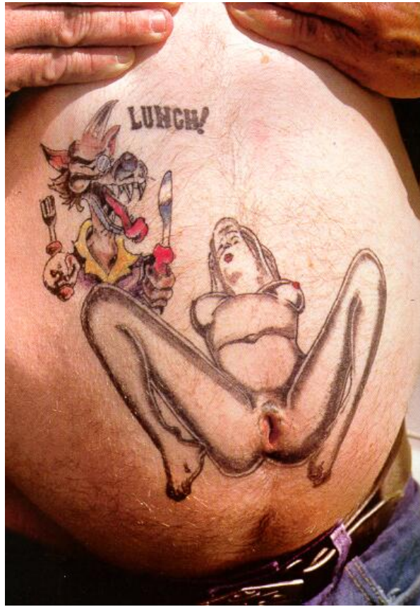
Resim – 4

müsteahcenlik suçunda genel ahlak kavramına gönderme yaptığı için, Kurul üyeleri, değerlendirmelerini kendi ahlaki değerlerine göre yapabilmektedirler. Kurmaca metinleri değerlendirirken de adeta metin içindeki kurmaca kişilikleri ahlaki açıdan değerlendirmeye tutulmaktadır.