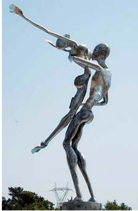
Resim - 1