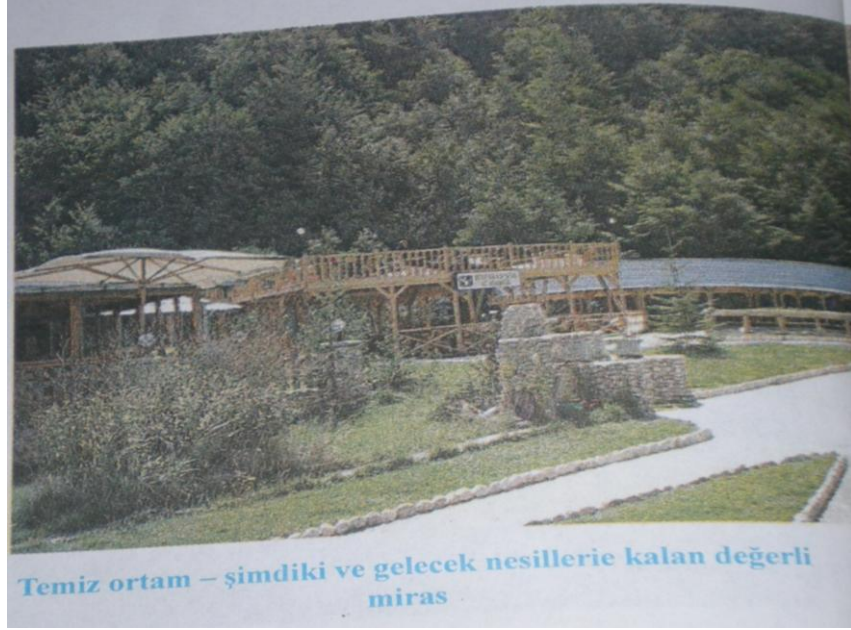
Resim 11 : Yurttaşlık Eğitimi 8. Sınıf, “Çevre Hakkı ve İstikrarlı Gelişme Hakkı”, s. 10 (2008)

9. resimde, öğrencilerde çevre korunması bilinci geliştirilmeye çalışılmıştır. Öyle ki, öğrencilerin görsel alanına hitap etmesi açısından temiz bir çevre ortamı resmedilmiştir. Ayrıca temiz bir çevre ortamının hem şimdi hem de gelecek nesillere kalan en değerli mirası oluşturduğu ifade edilmiştir.