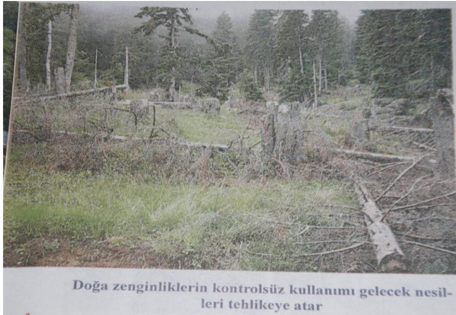
Resim 12: Yurttaşlık Eğitimi 8. Sınıf, “Çevre Hakkı ve İstikrarlı Gelişme Hakkı”, s. 11 (2008).

9. resimde, öğrencilerde çevre korunması bilinci geliştirilmeye çalışılmıştır. Öyle ki, öğrencilerin görsel alanına hitap etmesi açısından temiz bir çevre ortamı resmedilmiştir. Ayrıca temiz bir çevre ortamının hem şimdi hem de gelecek nesillere kalan en değerli mirası oluşturduğu ifade edilmiştir.