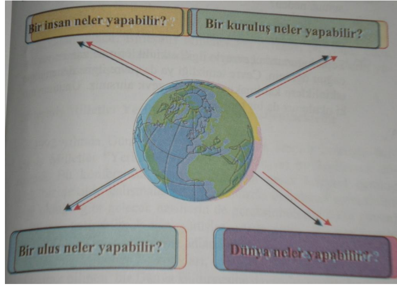
Resim 9: Yurttaşlık Eğitimi 6. Sınıf, “Çevre Sorunları, s. 125 (2006a).

“Çevrenin Korunması” adlı konuda, 1992 yılında Güney Amerika’nın Rio de Janeiro kentinde Birleşmiş Milletler’in “Yerkürenin Zirvesi” olarak adlandırılan bir konferans düzenledikleri ve konferansta oluşan görüşmelerin “kalıcı gelişme” olarak adlandırıldığı ifade edilmiştir. Konun devamında öğrencilerin çevrenin korunmasıyla ilgili duyarlı olmalarına dikkat çekmek için, birikmiş çöplerin insan sağlığına yol açtığı olumsuz durumlar, bir hikâye ile anlatılmaya çalışılmıştır.