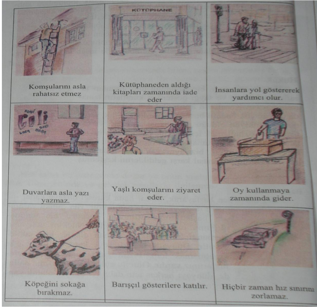
Resim 2: Yurttaşlık Eğitimi 6. Sınıf, “İyi Yurttaş Kimdir?”, s. 6 (2006a)

1. resimde, iyi yurttaşların sosyal ve siyasal sorumluluklar bağlamında, komşularını rahatsız etmemesi, kütüphaneden aldığı kitapları zamanında iade etmesi, insanlara yol göstererek yardımcı olması, duvarlara yazı yazmaması, yaşlı komşularını ziyaret etmesi, oy kullanmaya zamanında gitmesi, köpeğini sokağa bırakmaması, barışçıl gösterilere katılması, hız sınırını zorlamaması gibi, özellikleri/erdemleri taşıdığı belirtilmektedir.