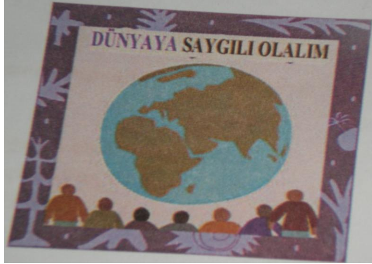
Resim 10: Yurttaşlık Eğitimi 6. Sınıf, “Çevre Korunması”, s. 131 (2006a).