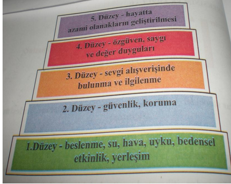
Resim 4: Yurttaşlık Eğitimi 6. Sınıf “Gereksinim ve Arzular” s. 70 (2006a)

gereksinimlerden/haklardan söz edilmiş ve bu temel gereksinimler/haklar, bir piramit şeklinde resmedilmiştir (Mato ve Shatri, 2006a: 69).