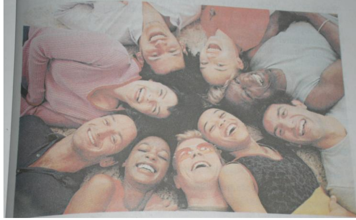
Resim 8: Yurttaşlık Eğitimi 9. Sınıf, “ ’Çok kültürlülük”, s. 99 (2009).

olan kültürlerin sadece kâğıt üzerinde değil, özel kültürler olarak geçerli olmaları ve çokkültürlülük kavram ilkesinin siyasi örgütlenme için ideoloji olarak kabul edilmesi gerektiği ifade edilmektedir. Kitapta, farklı kültürden insanlar resmedilmiştir.