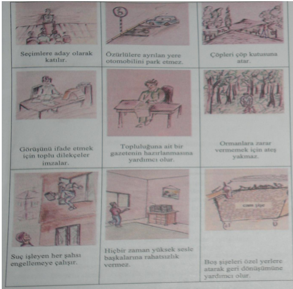
Resim 3: Yurttaşlık Eğitimi 6. Sınıf, “İyi Yurttaş Kimdir?”, s. 7 (2006a)

2. resimde, iyi yurttaşların sosyal ve siyasal sorumluluklar bağlamında, seçimlere aday olarak katılması, özürliülere ayrılan yerlerde otomobilini park etmemesi, çöpleri çöp kutusuna atması, görüşünü ifade etmek için toplu dilekçeler imzalaması, topluluğuna ait bir gazetenin hazırlanmasına yardımcı olması, ormanlara zarar vermemek için ateş yakmaması, suç işleyen şahsı engellemeye çalışması, yüksek sesle müzik dinlememesi, çöplerin geri dönüşümüne yardımcı olması gibi, özellikleri/erdemleri taşıdığı belirtilmektedir.