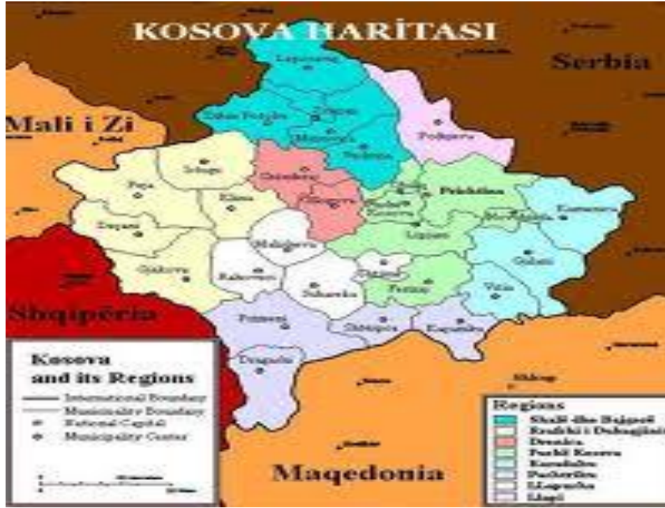
Resim 1: Kosova'nın Siyasi Haritası

Kosova'nın coğrafi açıdan stratejik konumunu ortaya çıkarmaktadır (Karademir, 2008: 99).