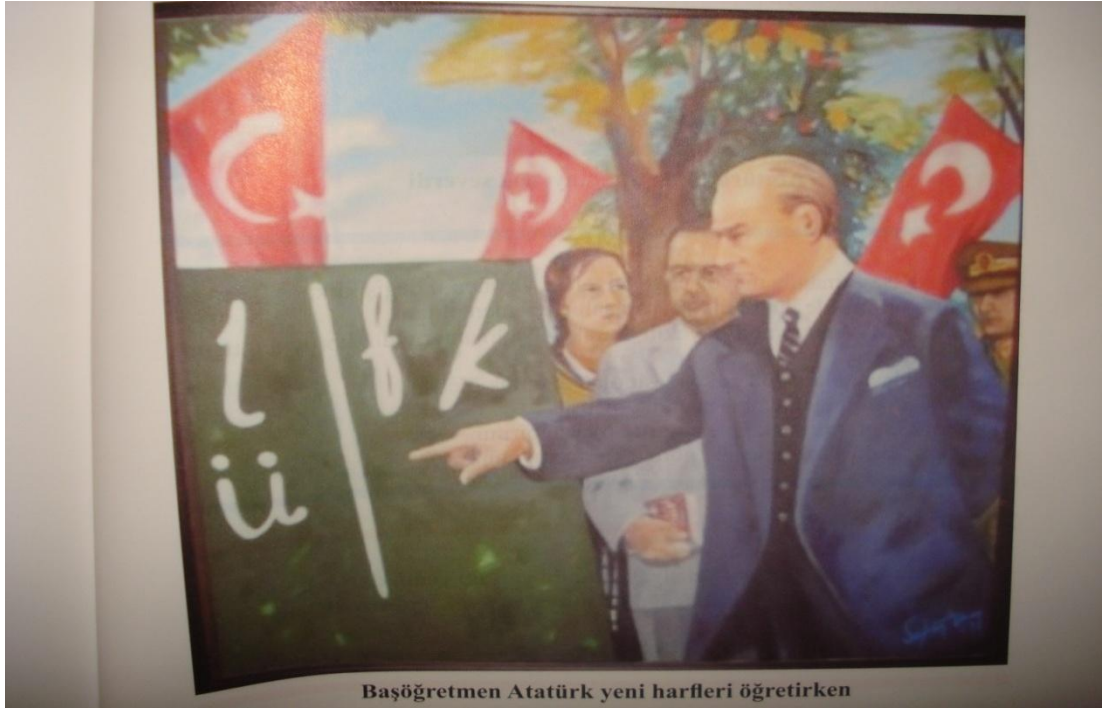
Resim 8: Tarih 5. Sınıf. “Türkiye Kurtuluş Savaşı” s. 143. (2010).

6. sınıf yeni tarih ders kitabında “Ulusal (Türk) Tarihi”ne iki üniteye yer verilmiştir. Bu üniteler ve içerikleri: “Türklerin İlk Yurdu ve Onların Göçleri” (Türklerin ilk yurdu ve onların göçleri, orta Asya ve Avrupa’da Hun devleti, Göktürkler ve Uygurlar, Türklerin kültür ve uygarlığı); “Orta Asya ve Yakın Doğu’da Türk Devletleri” (erken ortaçağda Türk boyları ve devletleri, Türklerin İslamiyet’i kabul etmesi, Karahanlı ve Gazneli devleti, Selçuklular ve Türk Beylikleri döneminde Anadolu, Anadolu’da Selçuk kültürü ve uygarlığı, Orta Doğu ve Orta Asya’da Türk devletleri) şeklindedir (EBTB, 2003).