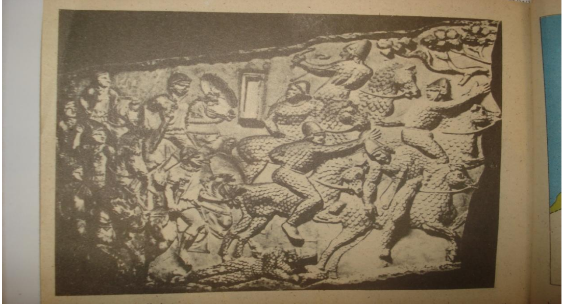
Resim 4: Tarih 5. Sınıf. “Roma Devletinin Bölünmesi ve Batı Roma Çarlığının Dağılması” s. 110. (1995).

Aynı konu işlenirken “Romalıların Barbarlarla Savaşı” adı altında bir resme yer verilmiştir.