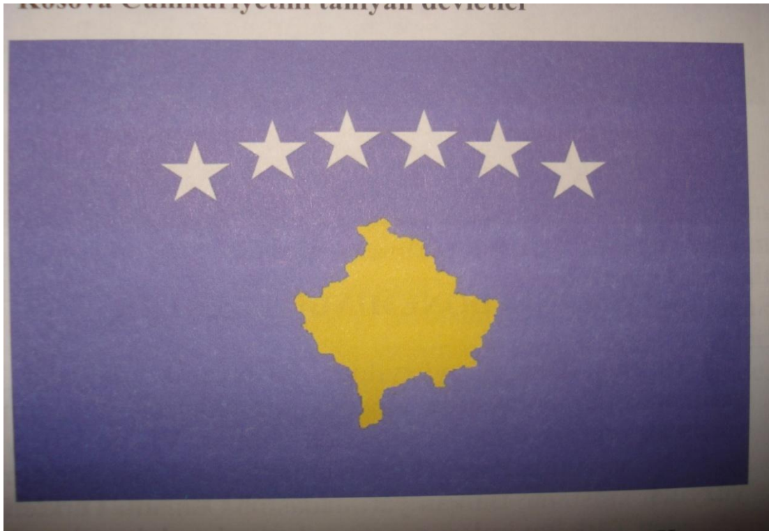
Resim 11: Tarih 5. Sınıf “XX. Yüzyılın Sonunda Kosova” s. 165. (2010).

Kosova Cumhuriyeti’nin bayrağı konu sonunda resmedilmiştir.