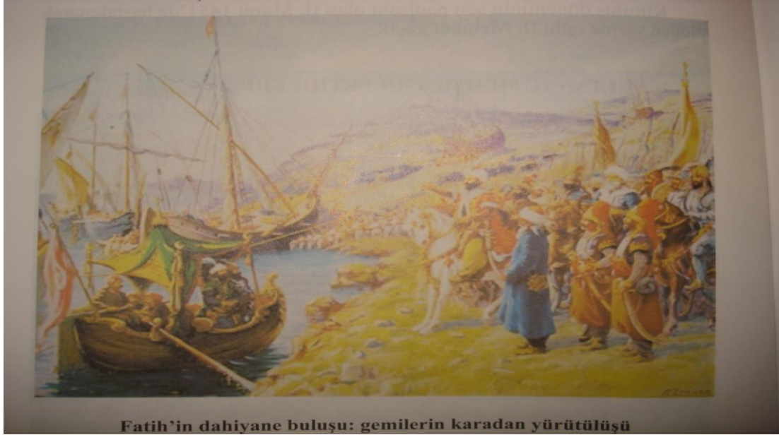
Fatih’in dahiyane buluşu: gemilerin karadan yürütülüşü

Ardından İstanbul’un fethini gerektiren sebepler sıralanmış, Hz. Muhammed’in söylediği “İstanbul mutlaka fethedilecektir. Onu fetheden komutan ne güzel komutan, onu fetheden asker ne güzel askerdir” hadise yer verilmiştir. İstanbul’un fethedilmesinde gemilerin karadan yürütülüşü resmedilmiştir.