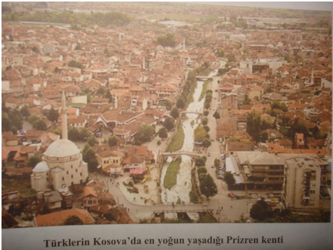
Resim 12: Tarih 5. Sınıf "Kosova Türkleri" s. 167. (2010).

Kosova'da Türklerin en yoğun olarak yaşadığı kent olan Prizren resmedilmiştir.