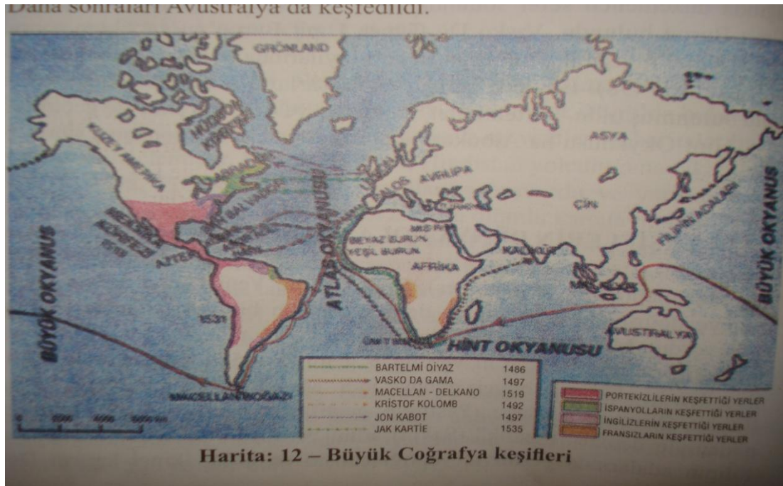
Resim 5: Tarih 7. Sınıf. “Büyük Coğrafya Keşifleri” s. 86. (2005b).

Konunun sonunda büyük coğrafi keşifler haritası yer almaktadır.