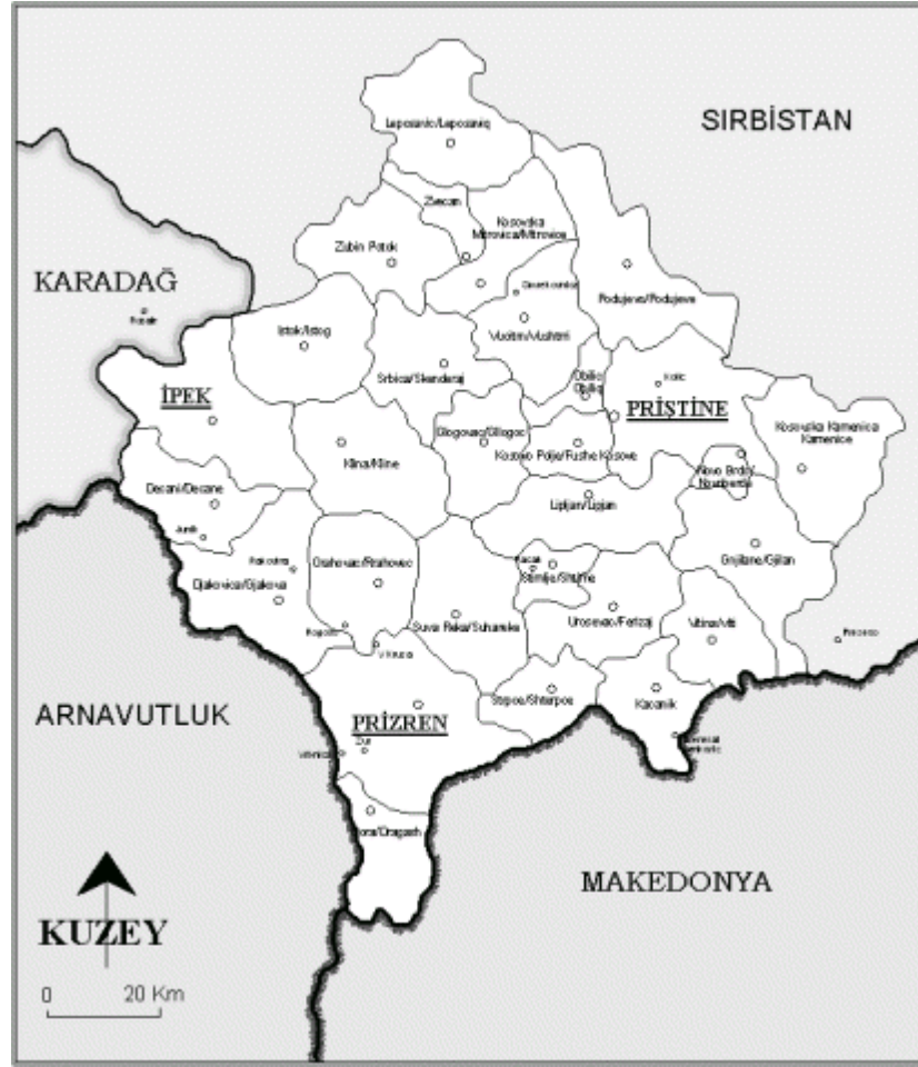
Resim 1: Kosova Türkçe Eğitiminde Gelişmeler. “Kosova Yönetim (Belediye) Birimleri” s. 46. (2011).