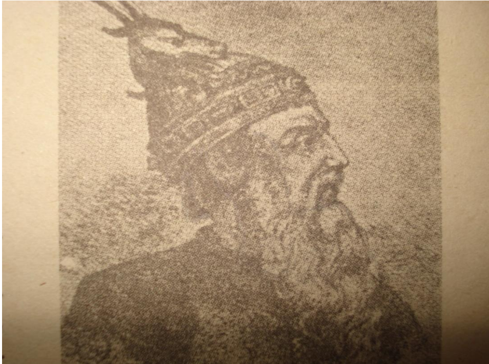
Resim 13: Tarih 6. Sınıf. “Arnavutların Osmanlılara Karşı Savaşları” s. 83. (1987a).

Konunun devamında Arnavutların önderi olarak görülen İskender Bey’in resmine yer verilmiştir.