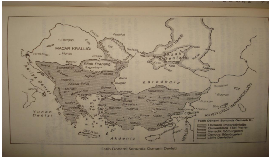
Resim 6: Türk Ulusal Tarihinden Ek Dersler. “Osmanlı Türkleri ve Onların Balkan’daki İlk Fetihleri” s. 35. (1995).