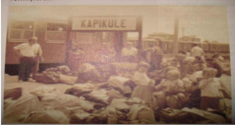
Resim 9: Tarih 5. Sınıf “İki Dünya Savaşı Arasındaki Dönemde Kosova” s. 150. (2010).

Sırp baskısından kurtulmak için Müslüman Kosova ahalisinin göç etmeye mecbur kalması resmedilmiştir.