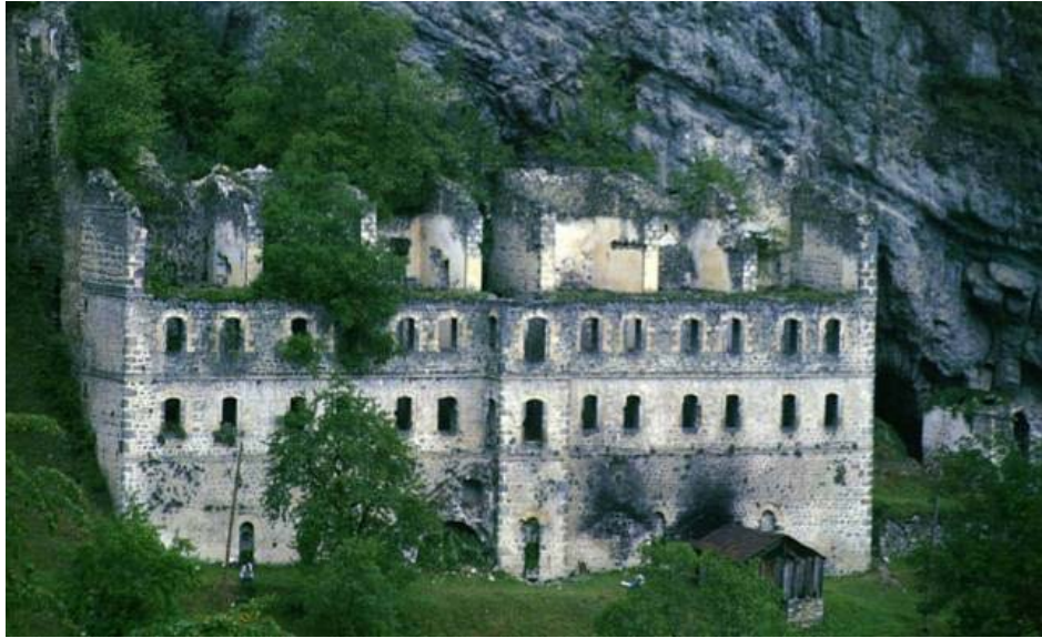
Fotoğraf 4. Kayaya Oyularak Yapılmış Bir Manastır: Vazelon Manastırı

Maça'ya 8 kilometre uzaklıkta Gümüşhane karayolu üzerinde Kiremitli Köyü'nün çam ormanları arasında yer almaktadır. Manastırın ilk kurucusu ve yapım tarihi bilinmemektedir. Günümüze oldukça büyük değişikliklerle gelebilen manastırı, imparator Justinianus onartmıştır ( www.trabzonkulturturizm.gov.tr ). Yapının, Vazelon ismini kurulmuş olduğu "Zabulon Dağı" ndan aldığı görüşü kuvvetli ihtimaldir. Manastır ıssız, sakin yerde seçilmesi, ona daha kutsal bir hava vermek istenmesindedir ( www.macka.bel.tr ). Vazelon Manastırı, XIII. yy.dan sonra Maça'nın dini, kültürel ve ekonomik yapısında etkili olmuştur. Sümela Manastırı'nın da, yörenin en zengin manastırı olan Vazelon Manastırı'nın gelirleri ile yaptırıldığı söylenmektedir (Bingöl, 2007: 425).