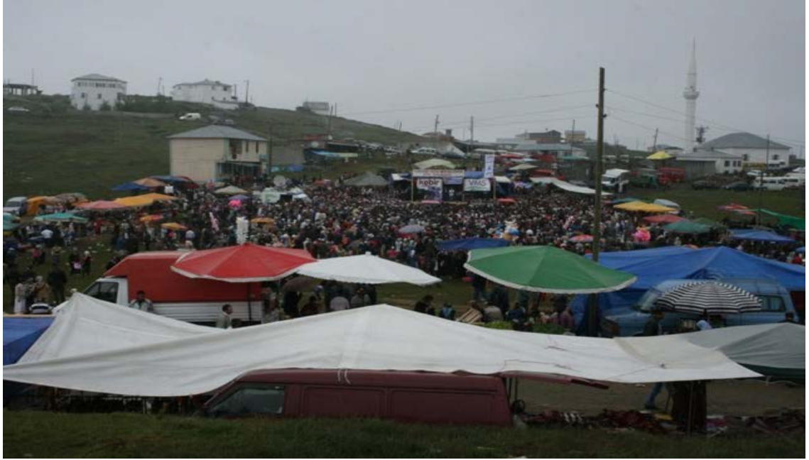
Fotoğraf 3: Karadağ Turizm Merkezinde Yapılan Yayla Şenliklerinden Bir Görünüş