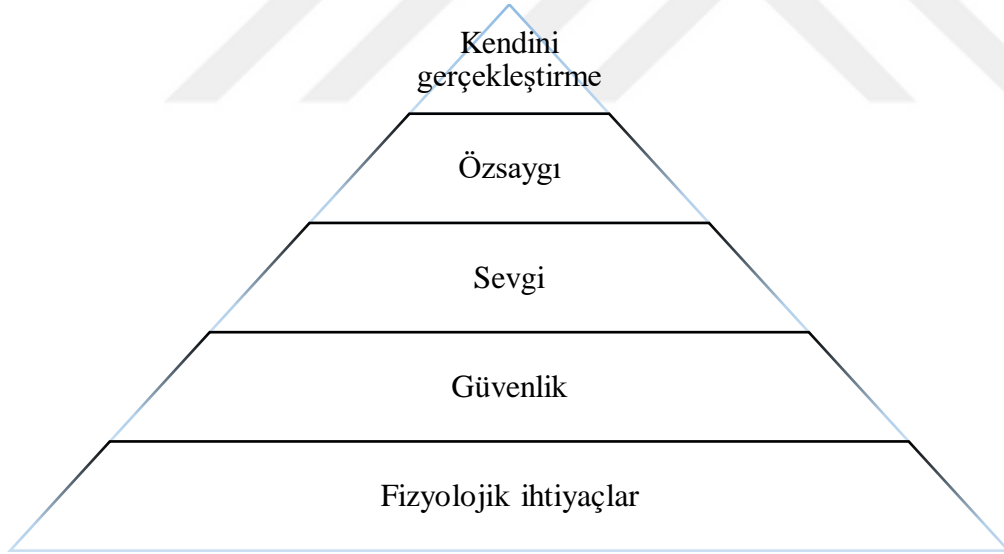
Şekil I. Maslow'un İhtiyaçlar Hiyerarşisi Piramidi

Hür iradeleri dâhilinde hareket eden ve sınırsız olasılıklar dünyasında özgürce seçimler yapan insanlar kendilerini içsel doyuma ulaştıracak yolu seçmeye çalışmaktadır. Psikanalitik kuramın merkezinde bilinçdışı, davranışçılığın merkezinde öğrenme yer alırken insancıl kuramın merkezinde de bu kendini gerçekleştirme fikri yer almaktadır.