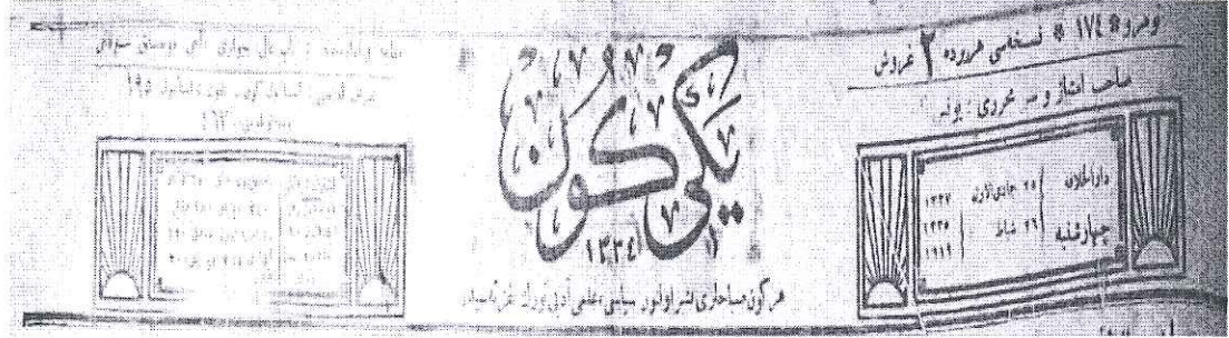
EK-1: YENİ GÜN (26 Şubat 1919)