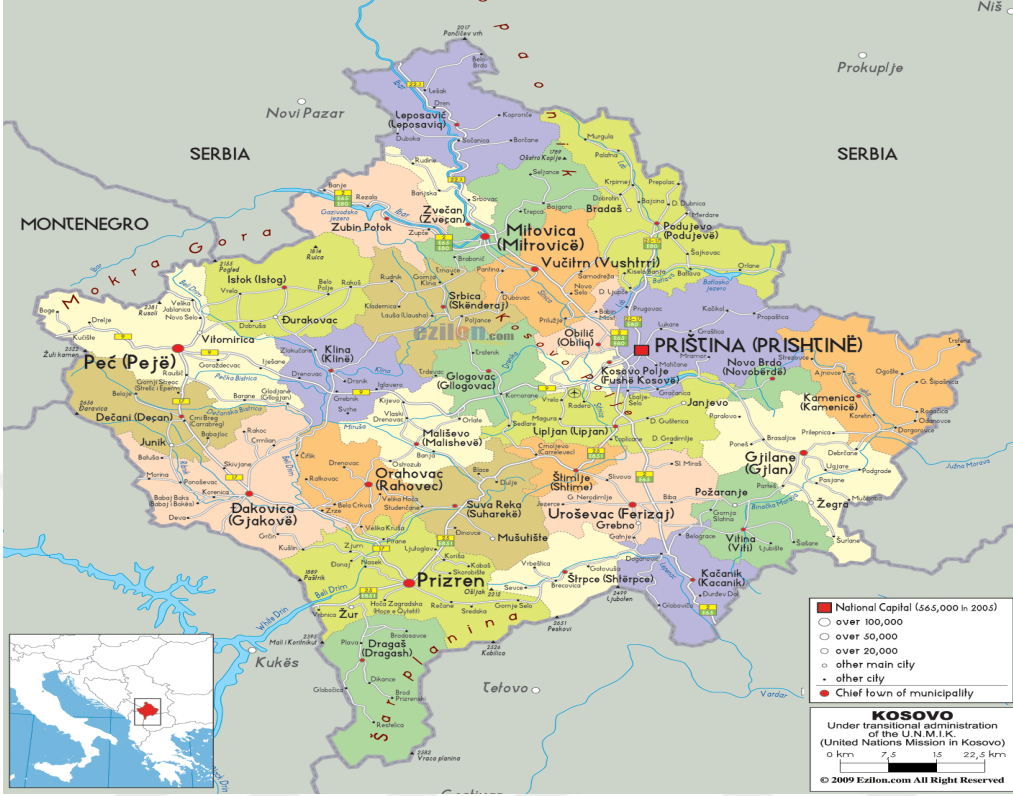
Kosova siyasi haritası

Kosova'da siyasi nedenler yüzünden son çeyrek yüzyılda kesin bir nüfus sayımı yapılamamıştır. Nüfusun yaklaşık 2.200.000 olduğu tahmin edilmektedir. Bu nüfusun yaklaşık % 90'ını Arnavutlar, % 5'ini Sırp, % 2'sini Boşnaklar, % 1'ini Türkler, % 2'sini Gora, Rom ve Aşkaliler oluşturmaktadır. Kosova, 1999 yılından itibaren fiilen Birleşmiş Milletler idaresinde olan bölgece 17 şubat 2008 tarihinde tek taraflı olarak bağımsızlığını ilan etmiştir. Başkenti Priştine olan Kosova'nın diğer önemli şehirleri Prizren, Cakova, Ferizay, İpek, Gilan ve Mitroviçadır (Koro, 2008: 8).