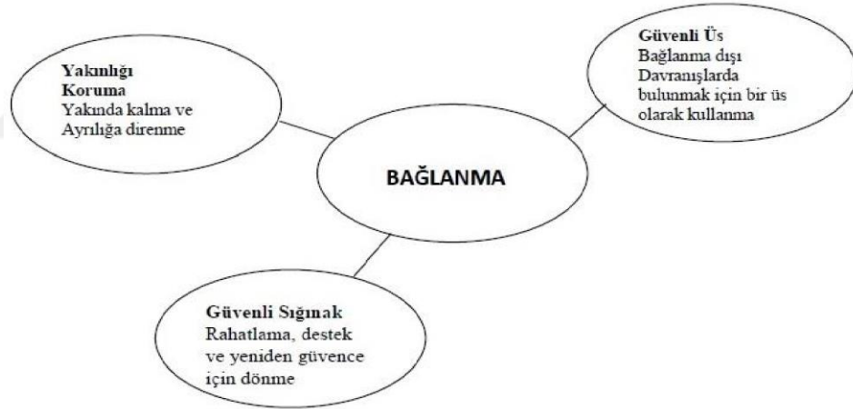
Şekil 2: Bağlanmanın Temel İşlevleri (Hazan ve Shaver, 1994; Akt. Güngör, 2000: 6).

Bowlby’e göre yakınlığı koruma, güvenli üs ve güvenli sığınak bağlanmanın üç tanımlayıcı özelliği ve bağlanma ilişkisinin üç temel işlevidir (Hazan ve Shaver, 1994: 4).