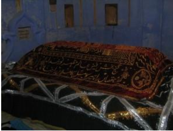
Hâce Seyfeddin Fârûkî'nin Kabri

EK 2: Sultan Âlemgîr'in Hâce Seyfeddin Fârûkî'ye Hitâben Mektubu 310