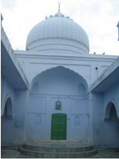
Hâce Seyfeddin Fârûkî'nin Türbesinin Girişi