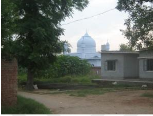
Hâce Seyfeddin Fârûkî'nin Türbesi, Sirhind, Hindistan

EK 1: Hâce Seyfeddin Fârûkî'nin Türbesinin Fotoğrafları Sirhind, Hindistan 309