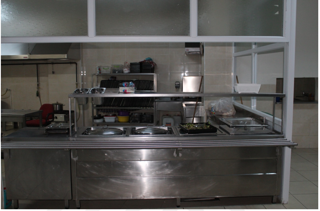
Fotoğraf 7: Erikli Baba Dergahı Mutfağı ve Yemekhanesi (Dergah çalışanları ve ziyaretçileri için günlük yemek düzeni).