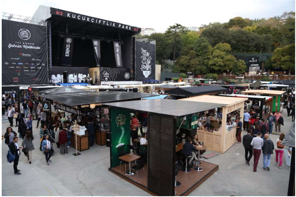
Fotoğraf 4. İstanbul Coffee Fest'te alana kurulan kahve standları, 2018.

kahve tadımları ile workshop ve seminerlerin düzenlendiği bu festivalde, dünya kahveleri ile tanışma imkanı da sunulmaktadır. Katılımcıların kahveyi “deneyimledikleri” bu festival, nitelikli kahveyi çok daha ulaşılabilir kılmaktadır.