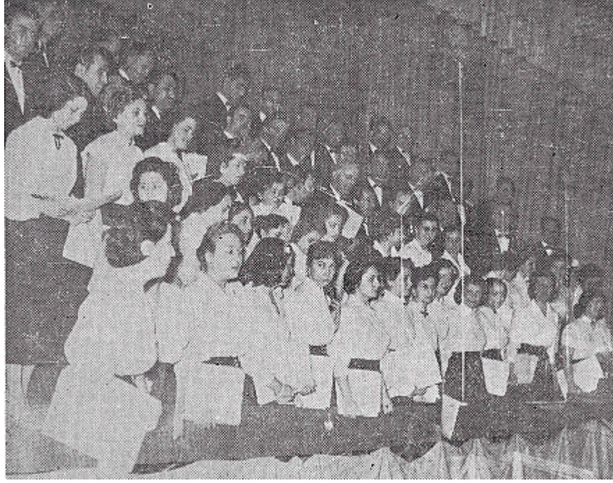
İstanbul Şehir Korusu, Taksim Belediye Gazinosu konserlerinden biri