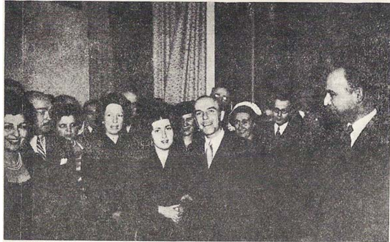
İda Haendel dernek üyeleri arasında