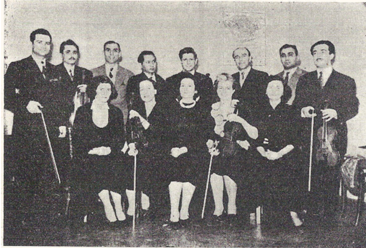
Cemal Reşit Rey yönetiminde yaylı sazlar grubu