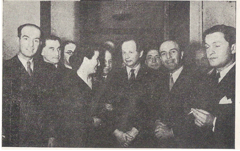
Dernek salonunda W. Kempff şerefine bir davet