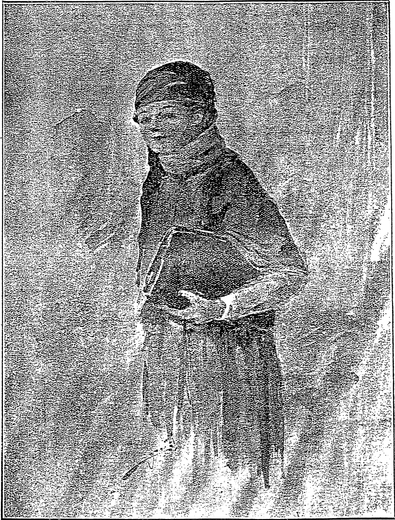
پہلی یوردیہ سیدہ حسن ... [ بگاہہ صنعتکارہیز رافت توفیق بک اندازیک طابولوزندن آاندیر۔ ]